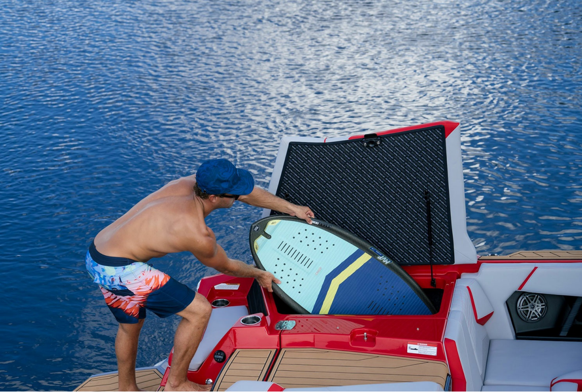
Nautique Super Air S 23