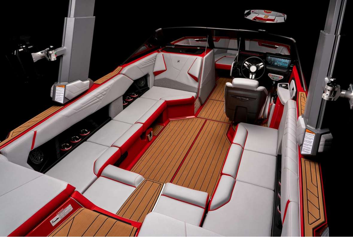
Nautique Super Air S 23