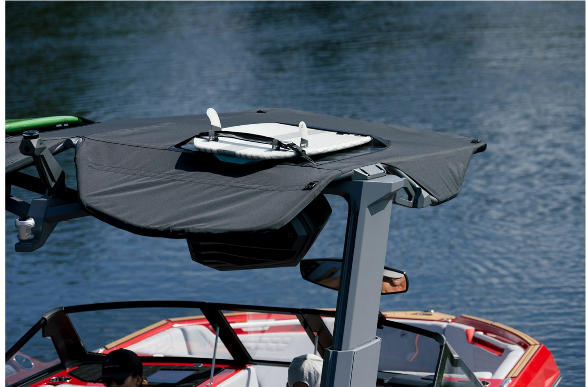
Nautique Super Air S 23