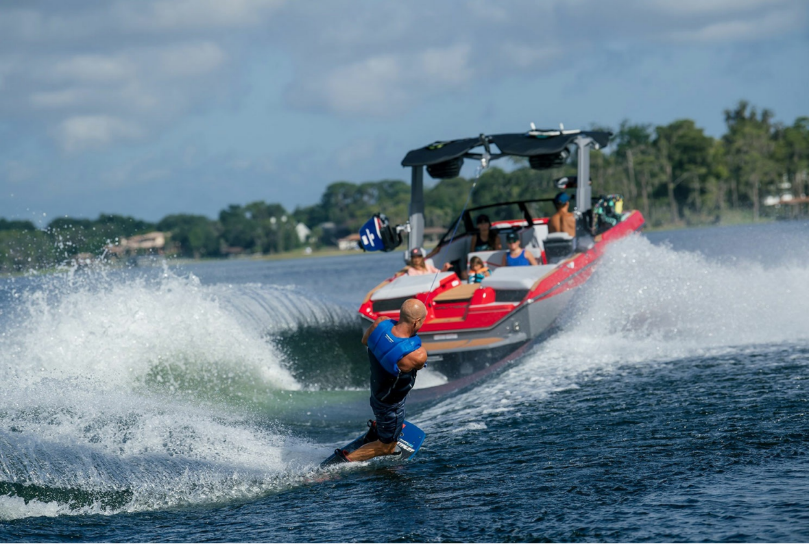
Nautique Super Air S 23