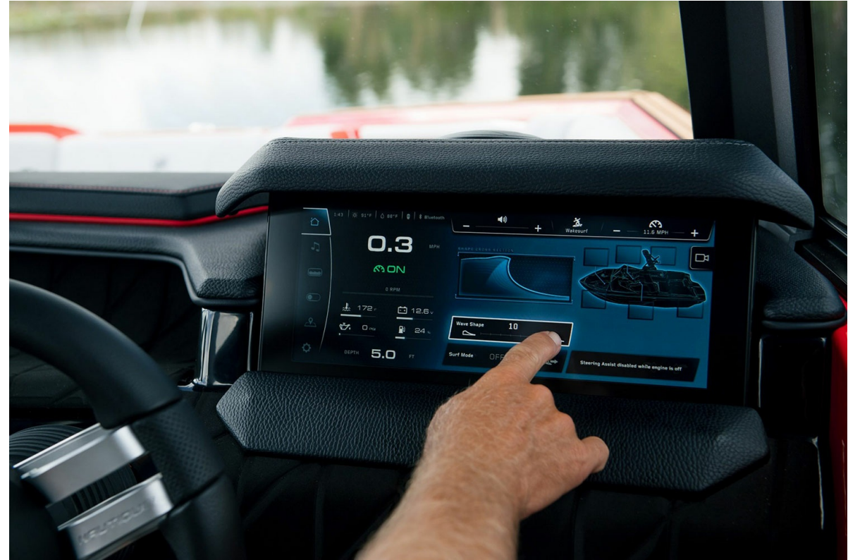
Nautique Super Air S 23