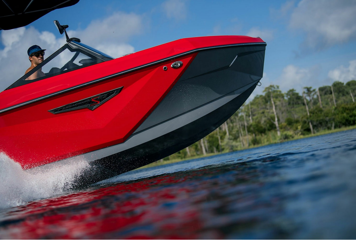
Nautique Super Air S 23