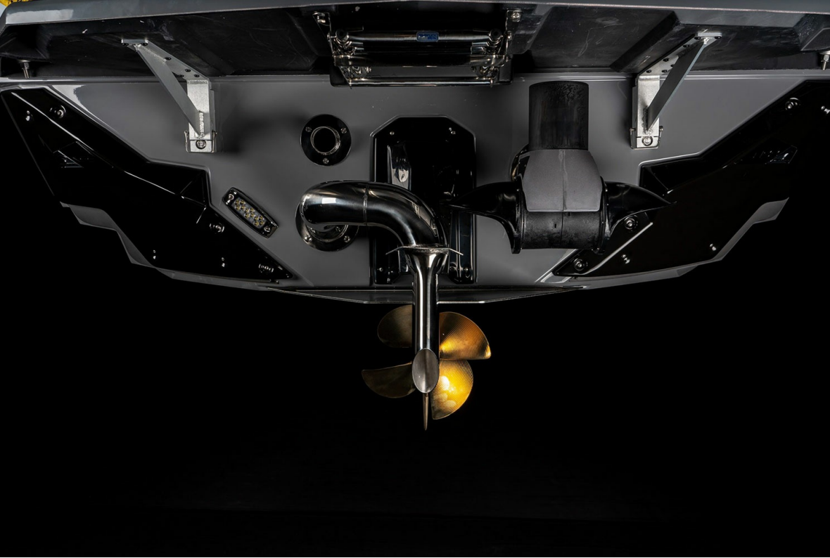
Nautique Super Air S 23