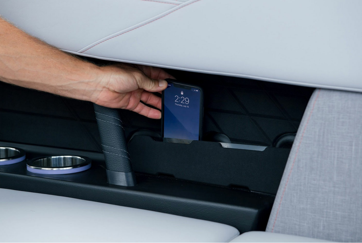
Nautique Super Air S 23