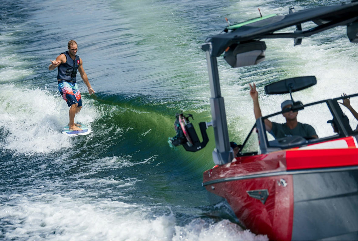
Nautique Super Air S 23