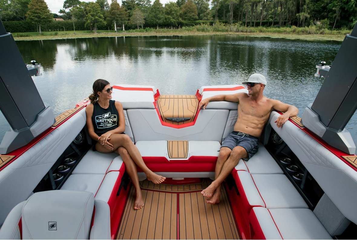
Nautique Super Air S 23