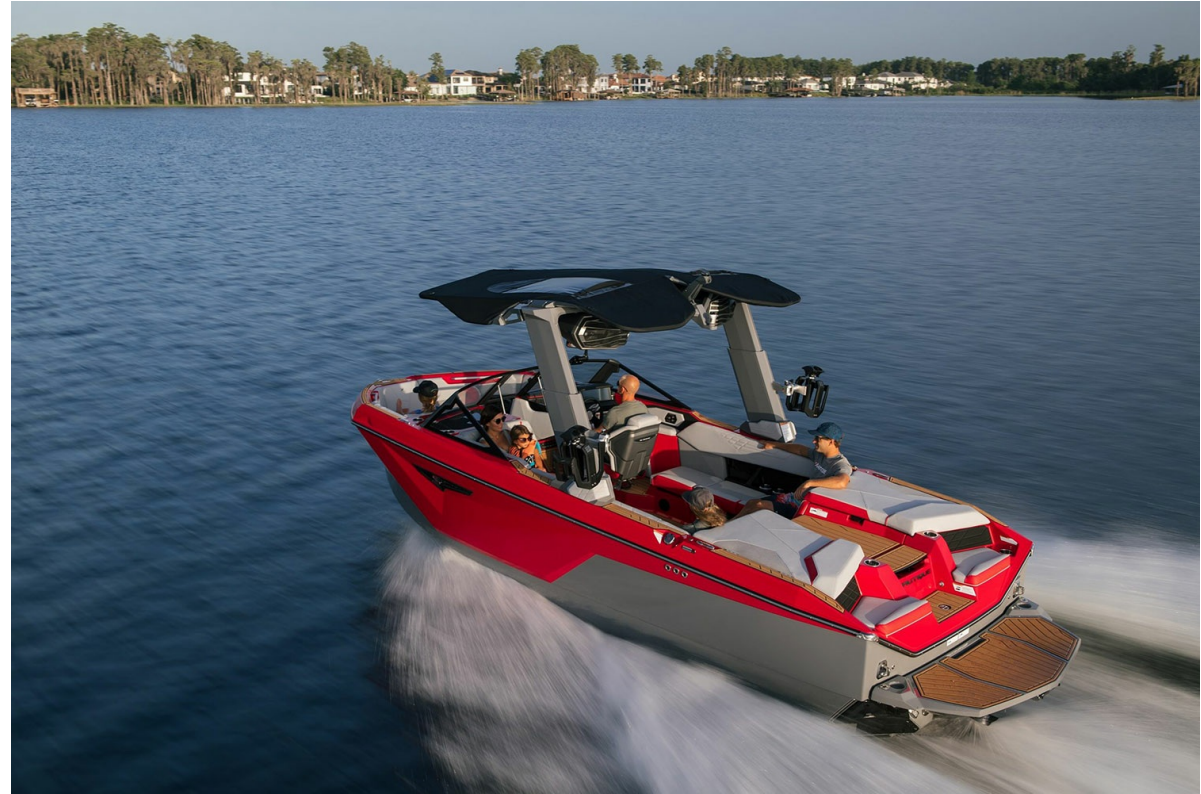
Nautique Super Air S 23