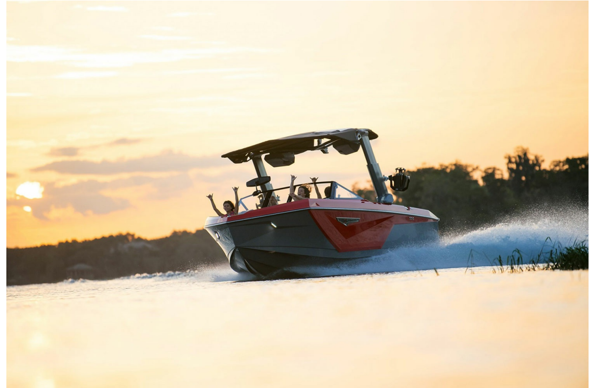
Nautique Super Air S 23