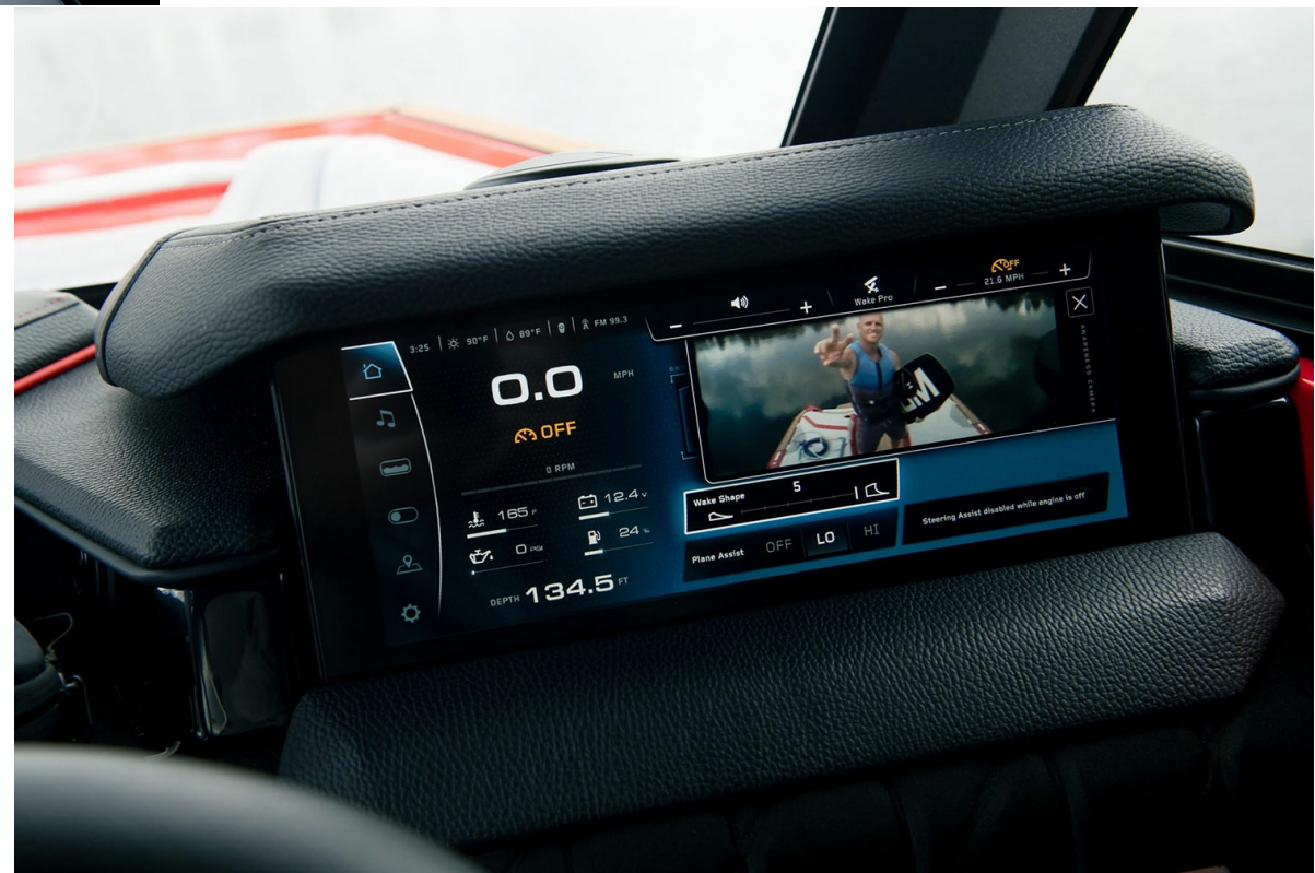
Nautique Super Air S 23