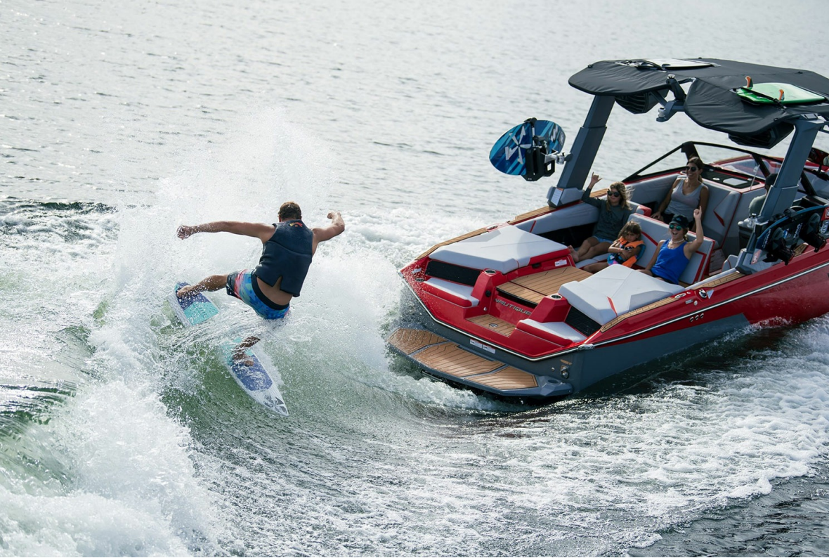
Nautique Super Air S 23