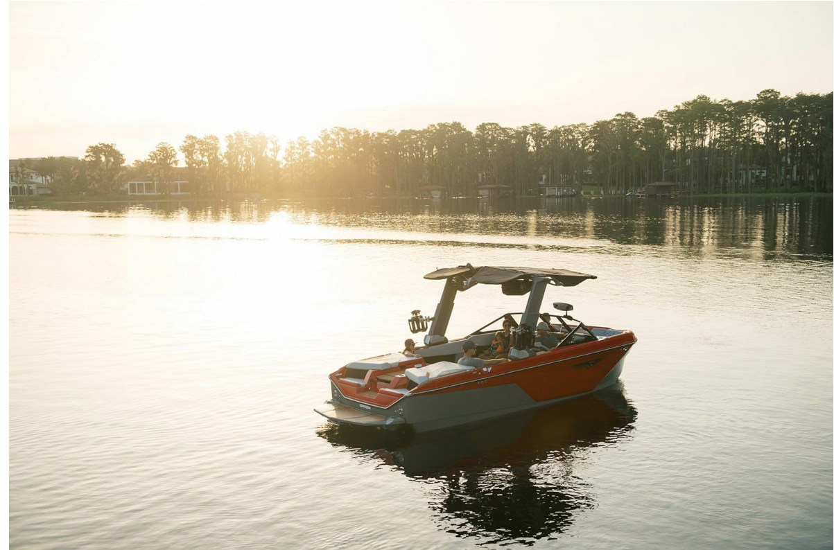
Nautique Super Air S 23