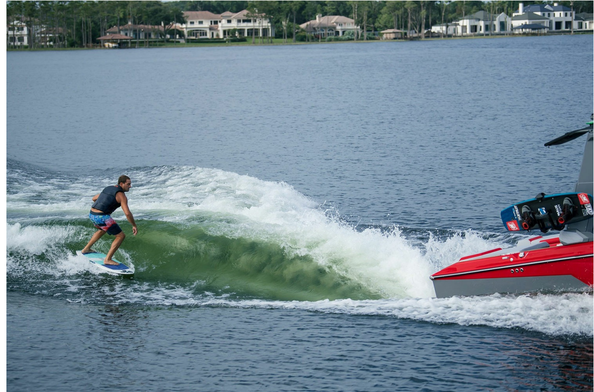
Nautique Super Air S 23