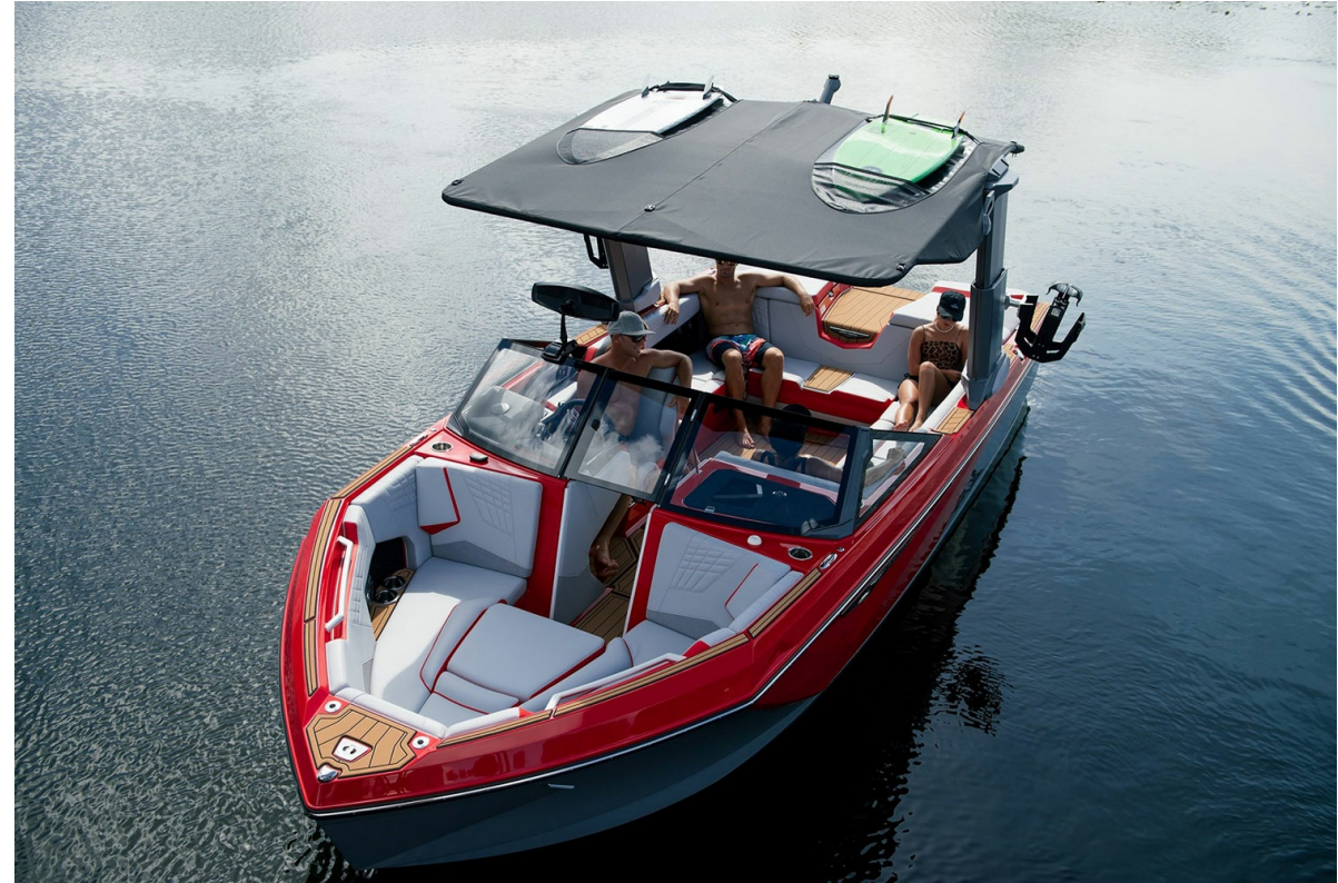
Nautique Super Air S 23