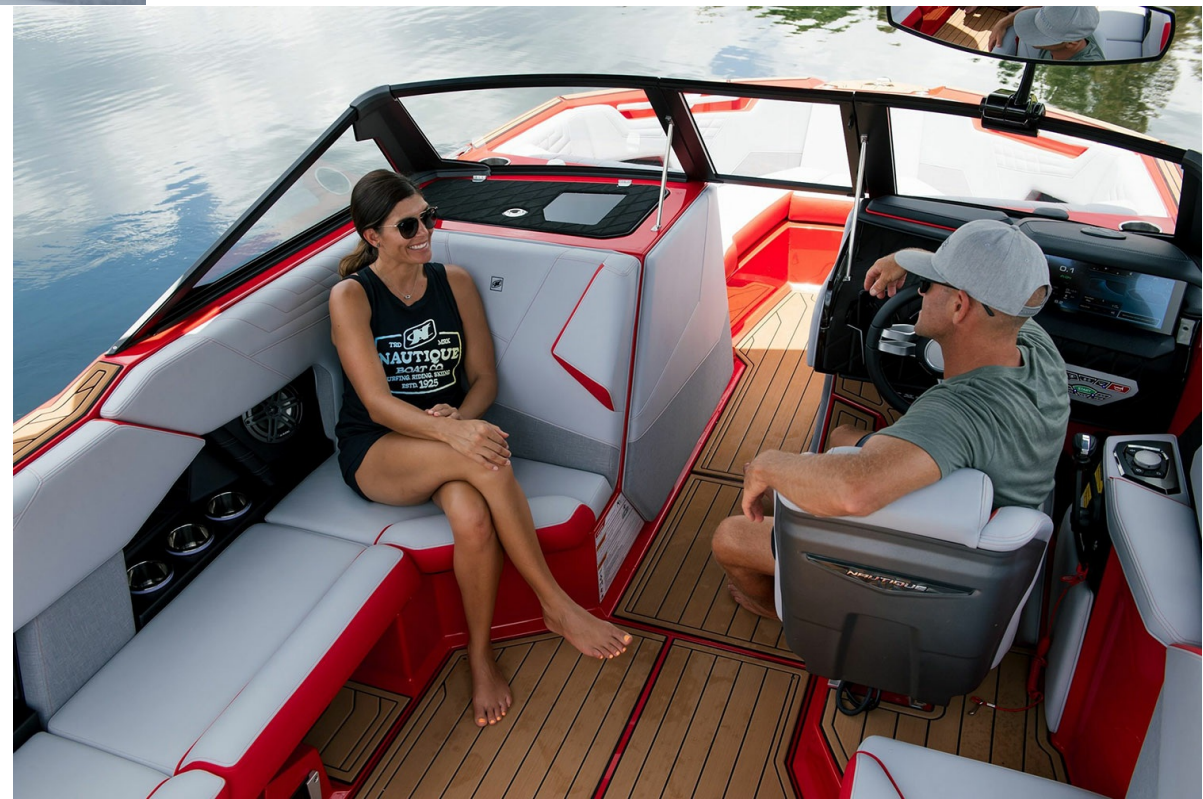
Nautique Super Air S 23