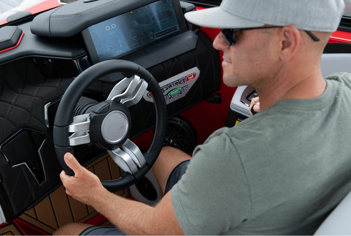
Nautique Super Air S 23