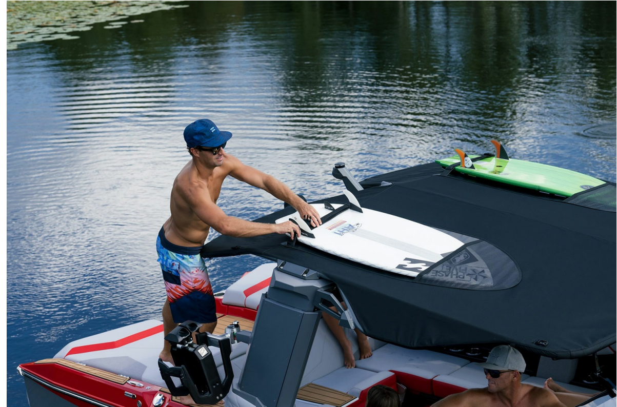
Nautique Super Air S 23