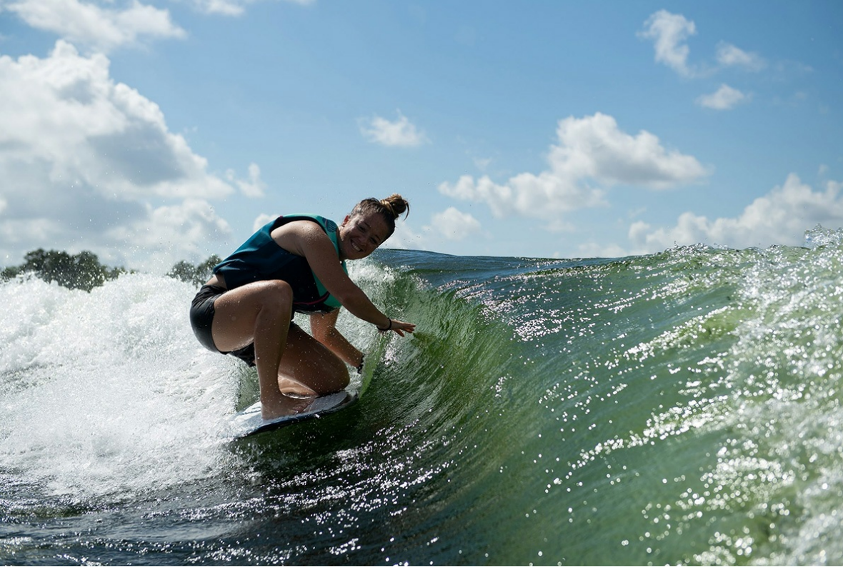
Nautique Super Air S 21