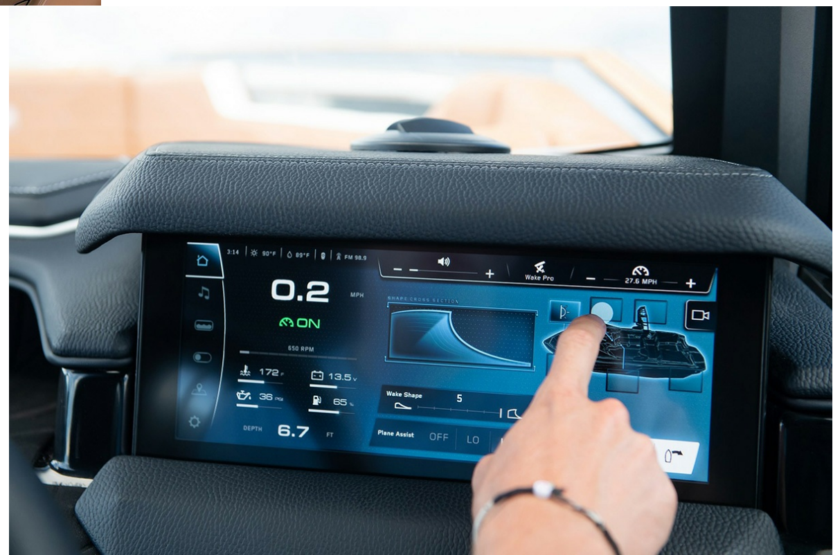
Nautique Super Air S 21