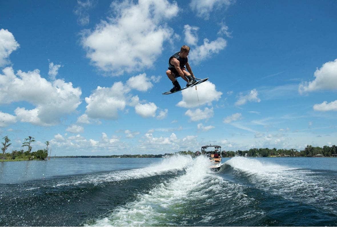
Nautique Super Air S 21