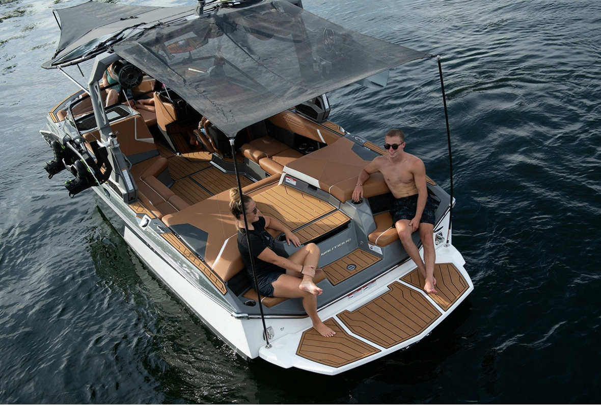
Nautique Super Air S 21