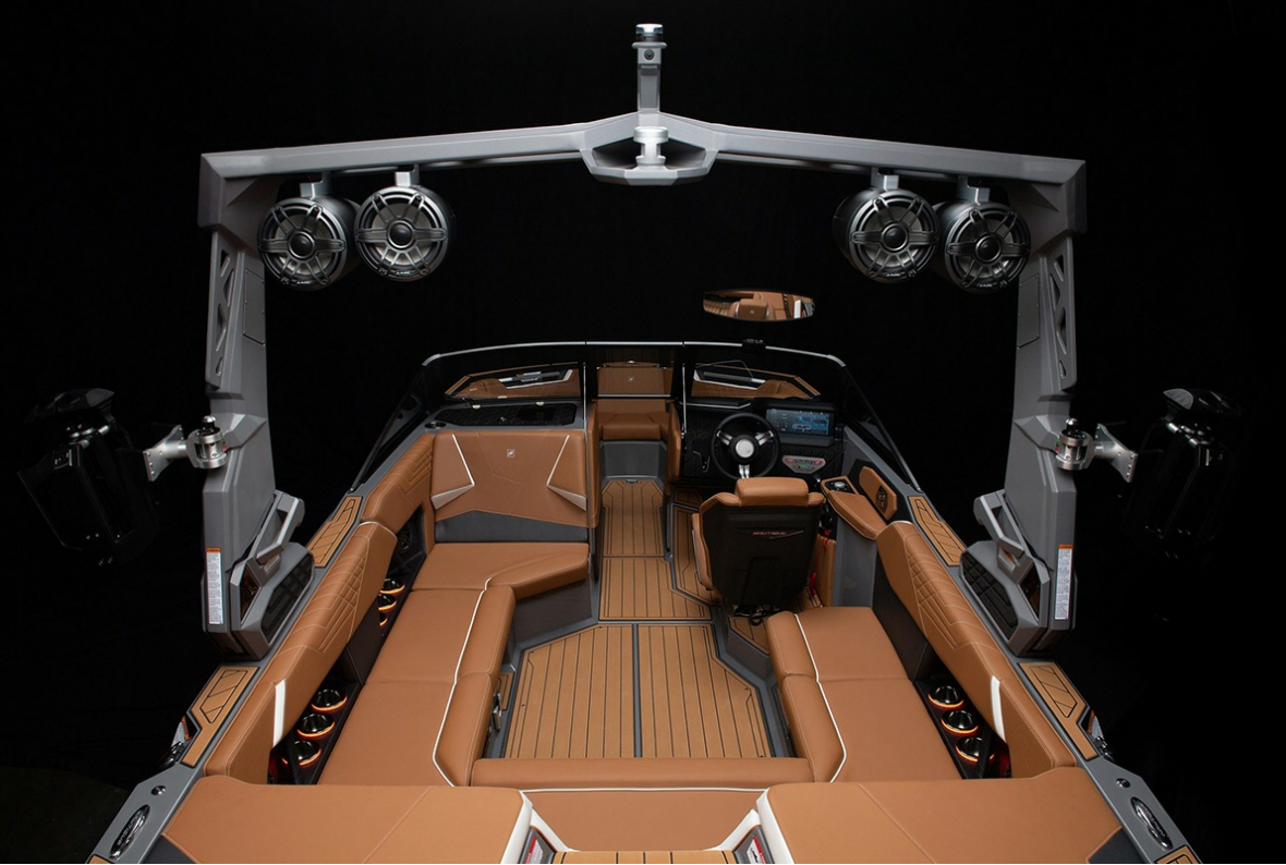
Nautique Super Air S 21