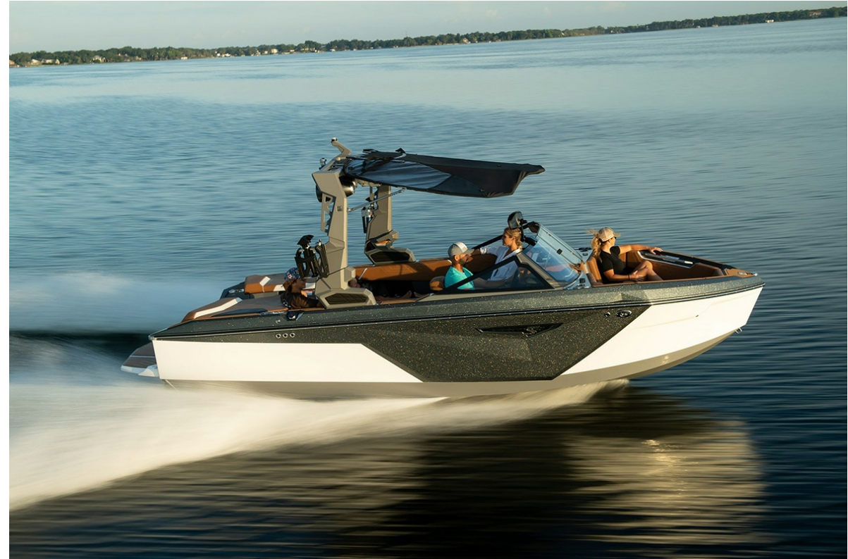
Nautique Super Air S 21