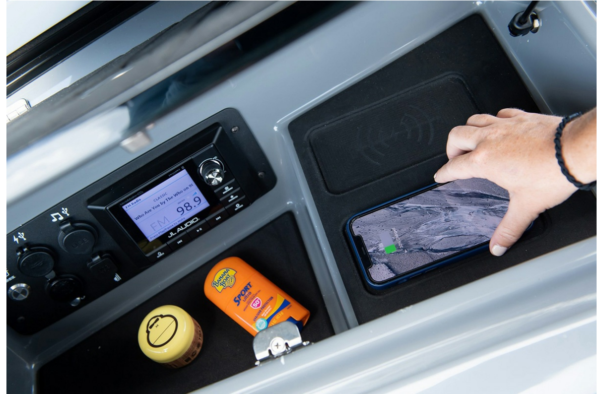
Nautique Super Air S 21