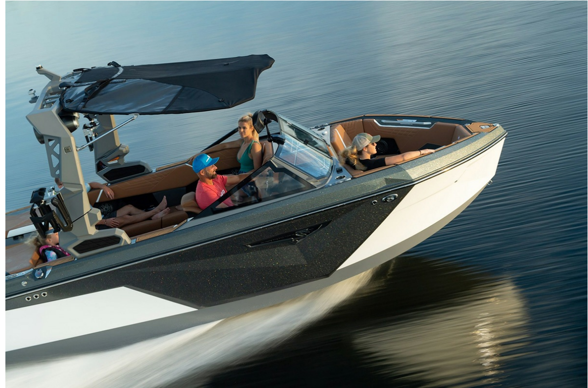
Nautique Super Air S 21