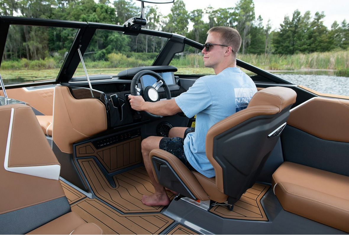
Nautique Super Air S 21