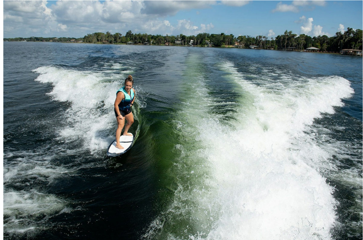
Nautique Super Air S 21