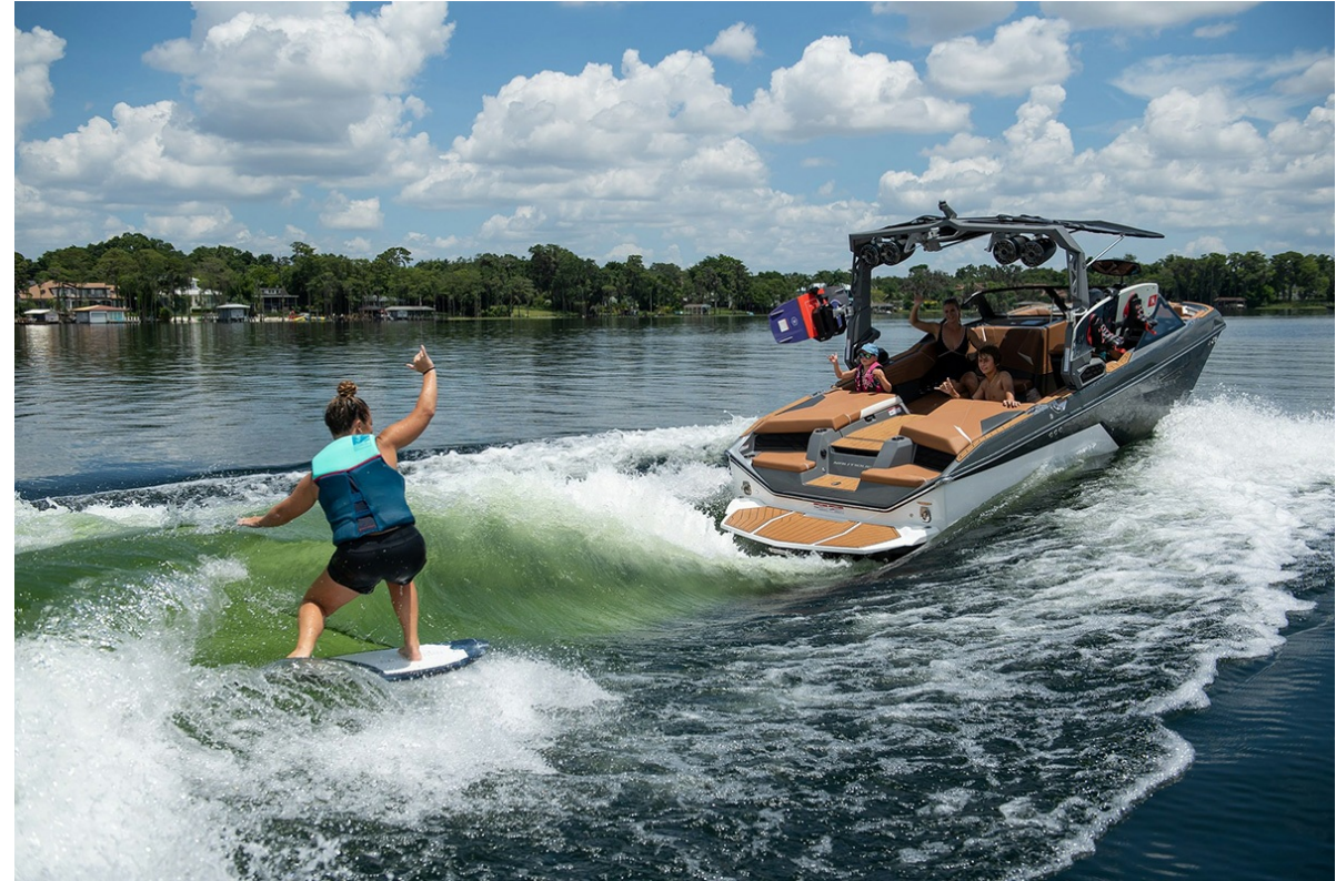
Nautique Super Air S 21