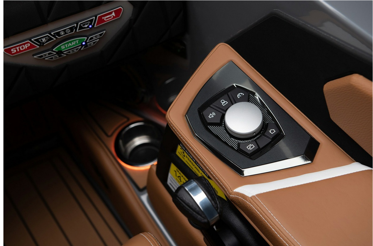
Nautique Super Air S 21