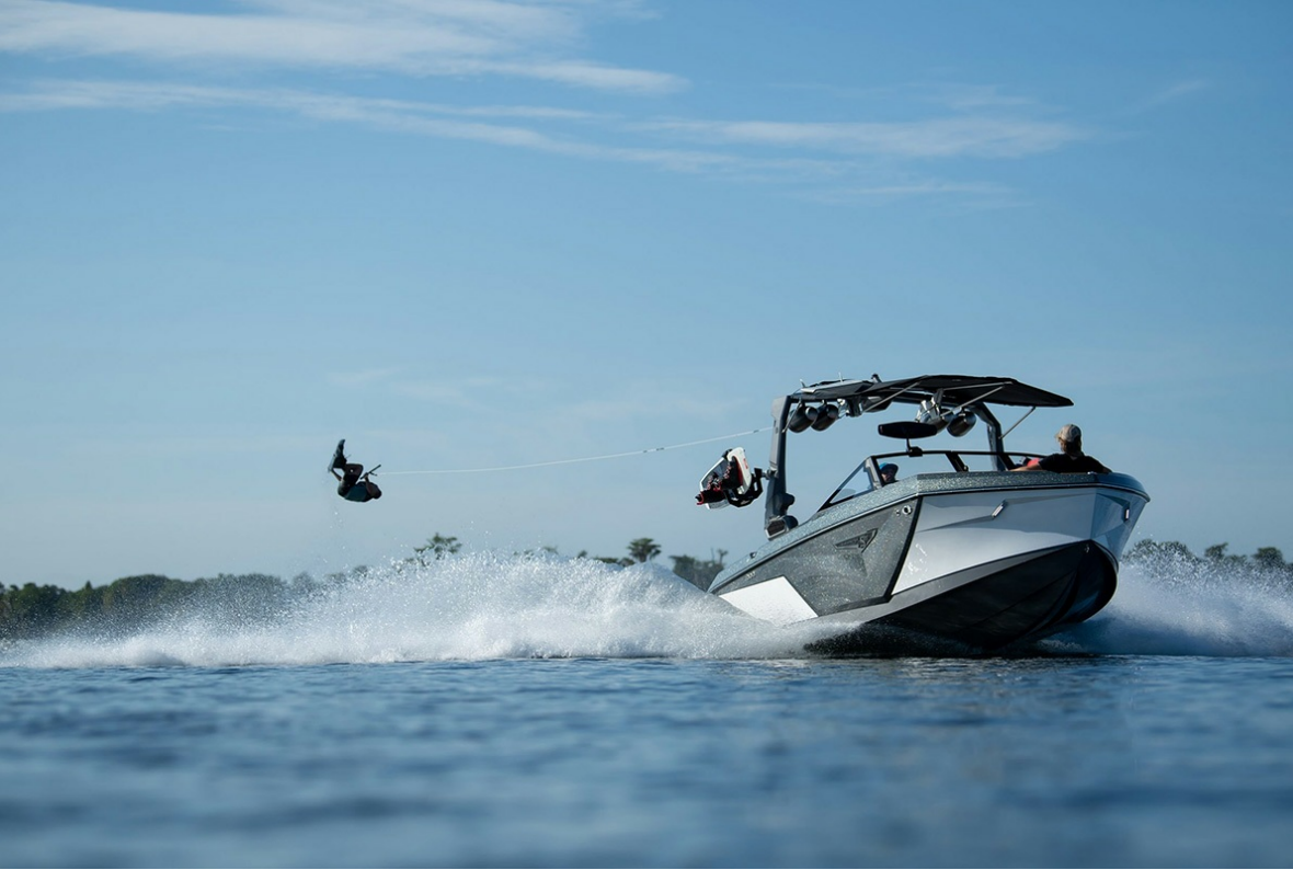
Nautique Super Air S 21