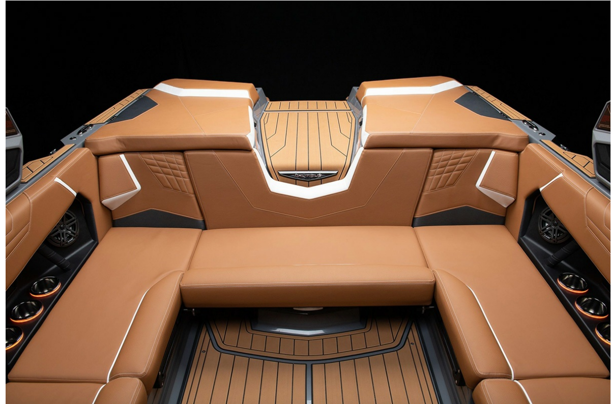
Nautique Super Air S 21