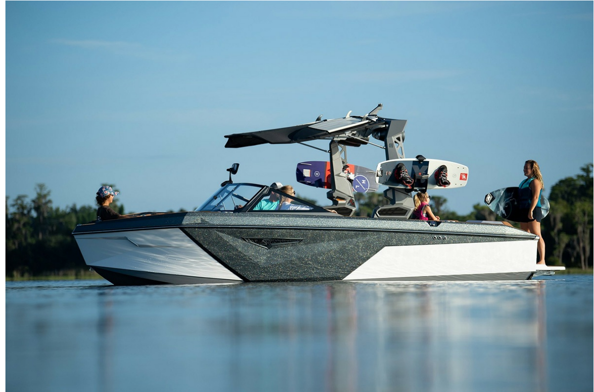
Nautique Super Air S 21