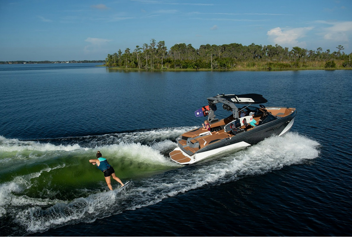
Nautique Super Air S 21