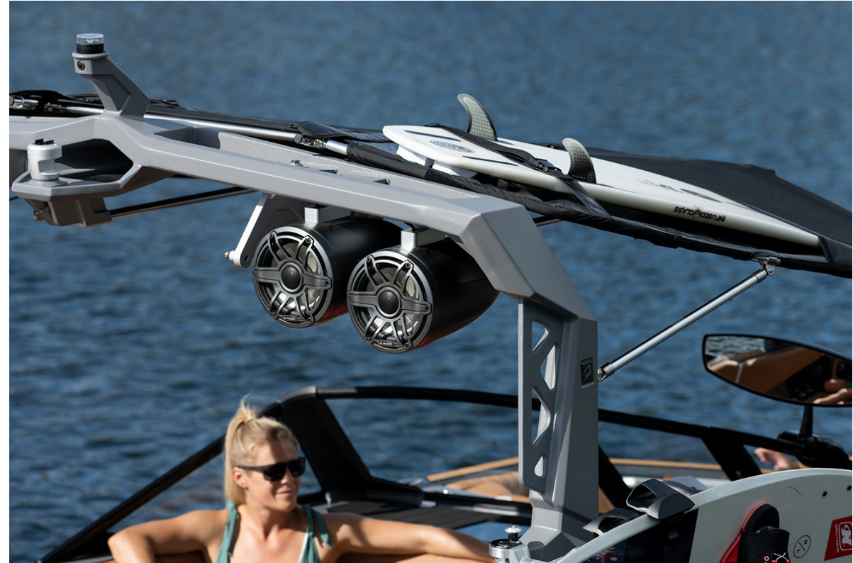
Nautique Super Air S 21