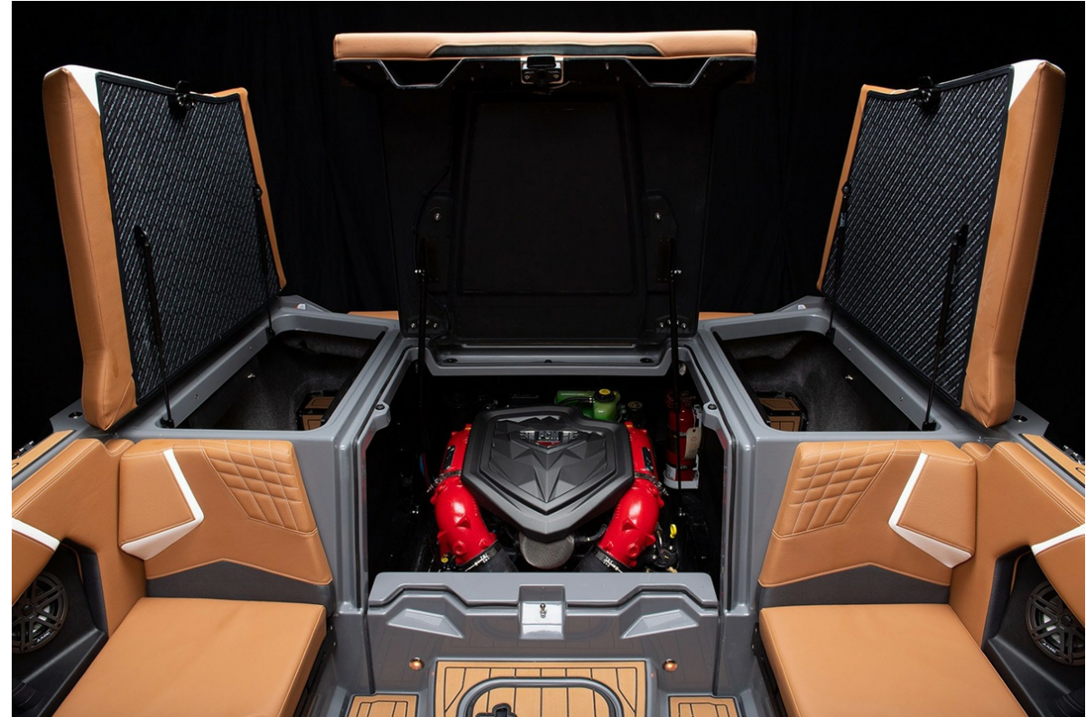
Nautique Super Air S 21