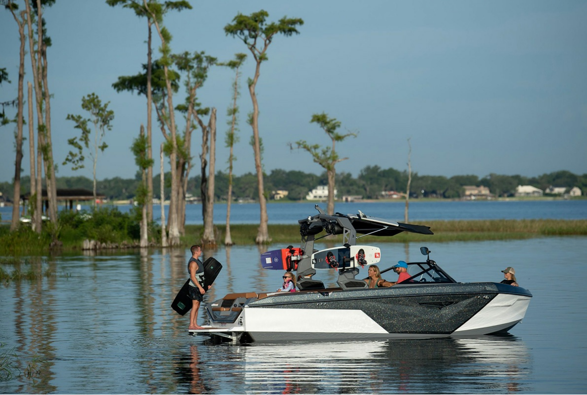
Nautique Super Air S 21