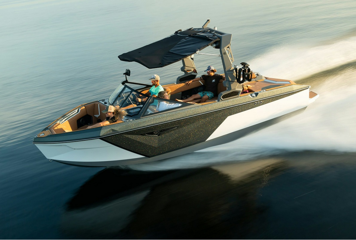
Nautique Super Air S 21