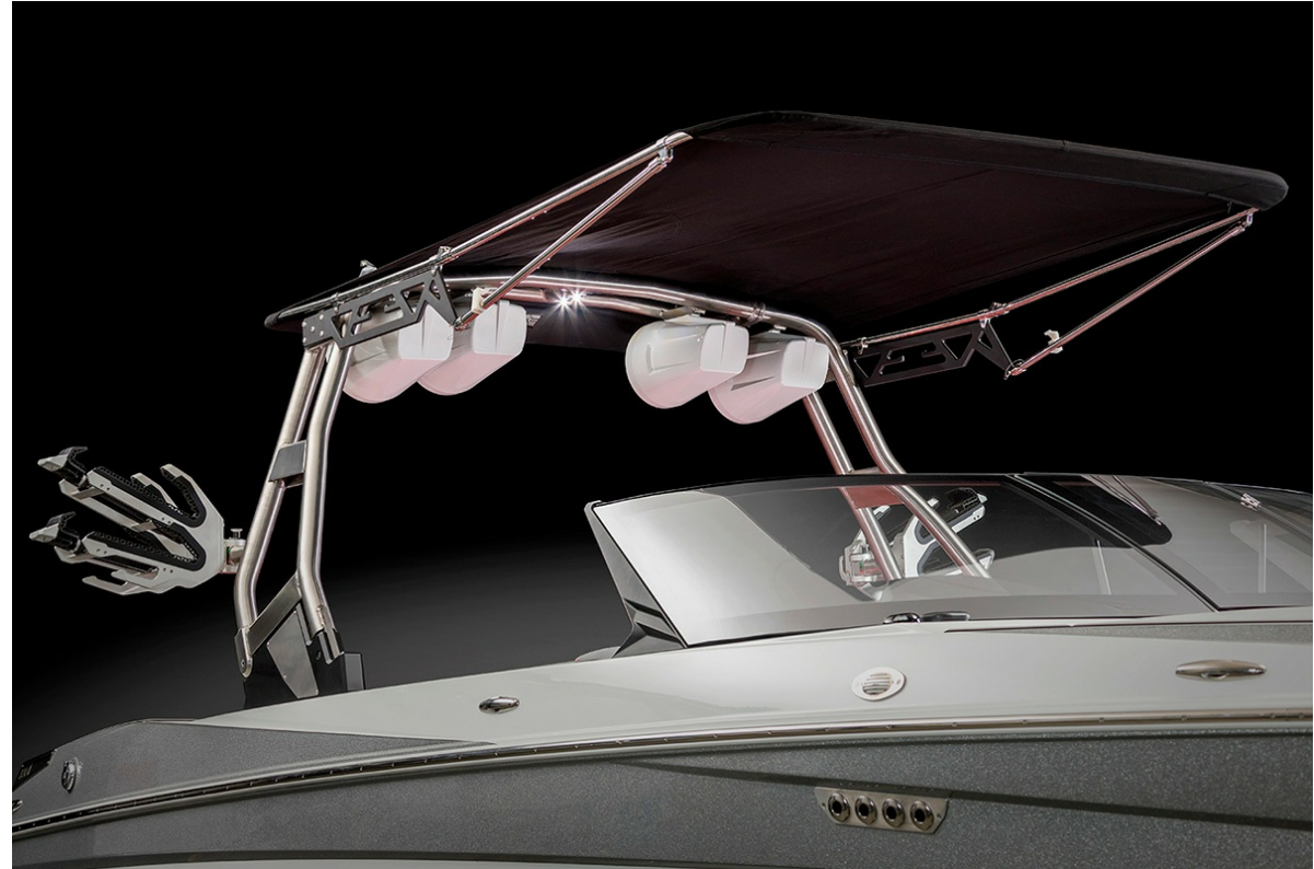
Supreme S 240