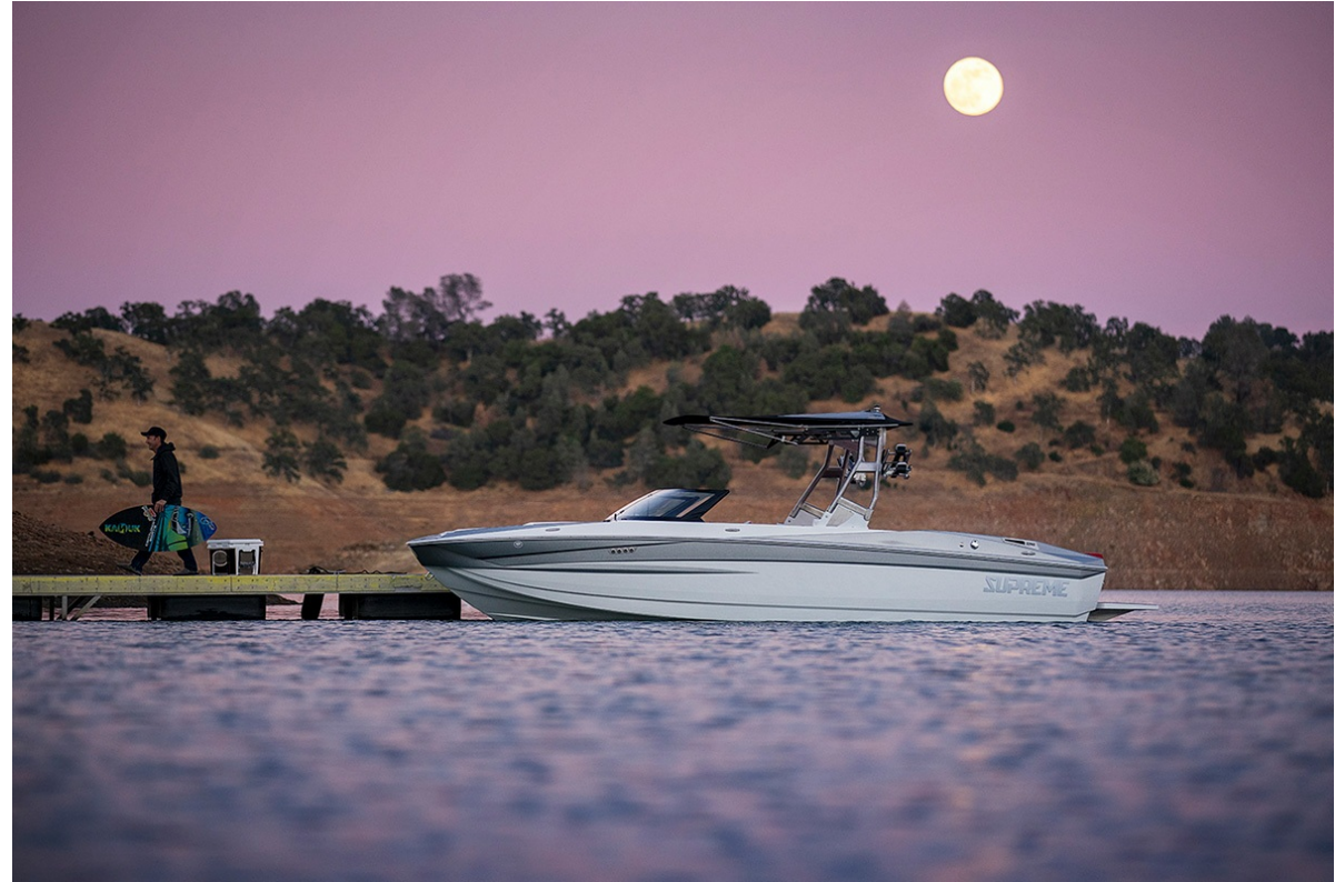
Supreme S 240