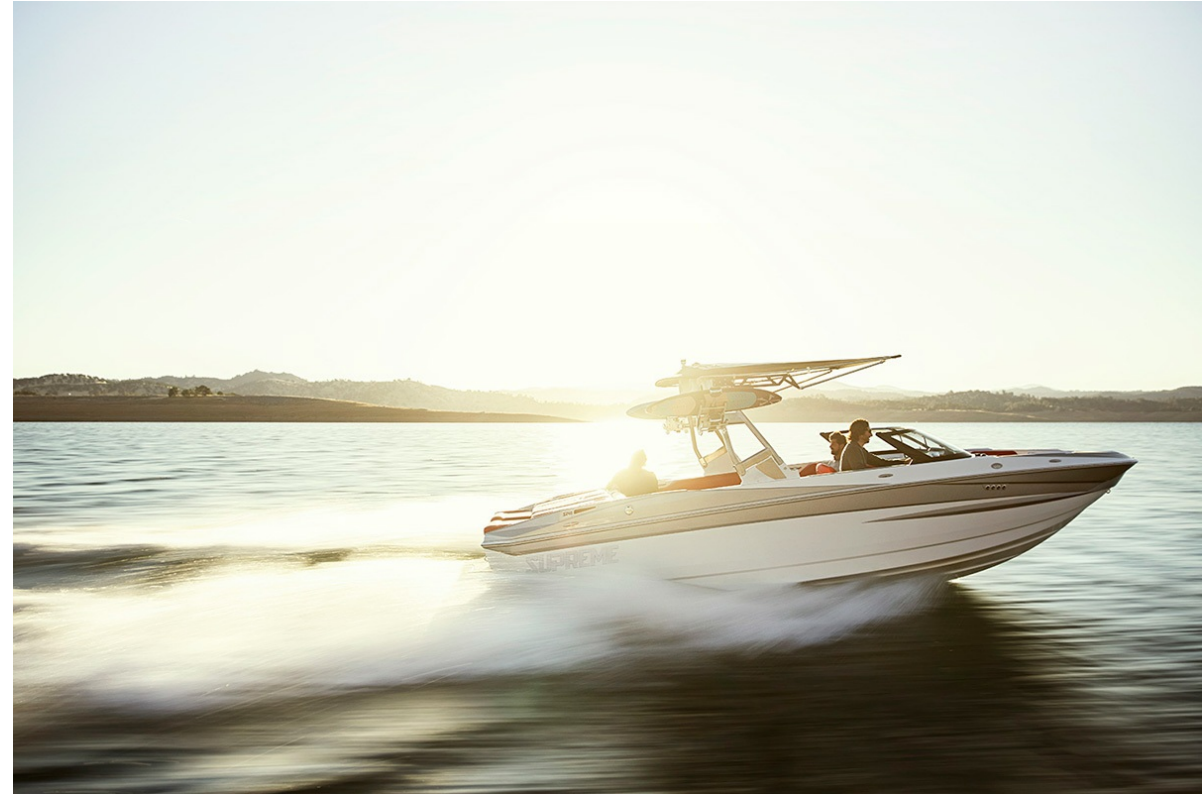
Supreme S 240