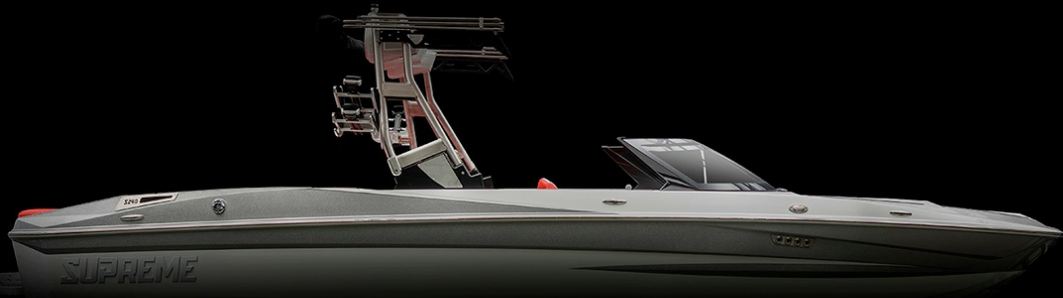
Supreme S 240