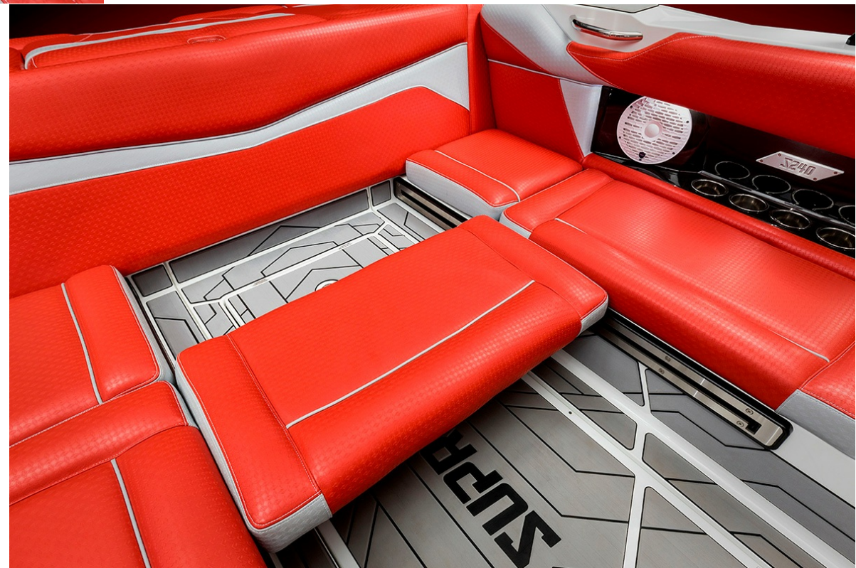
Supreme S 240