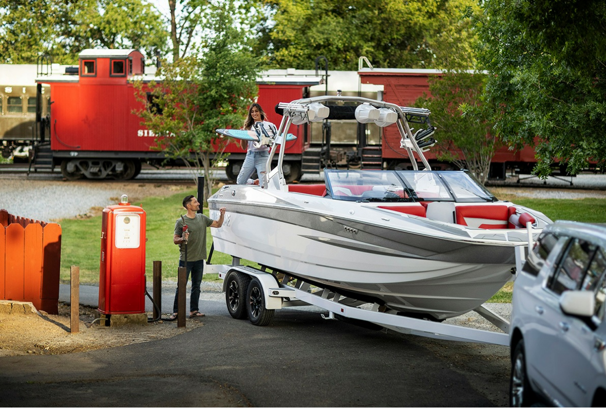
Supreme S 240