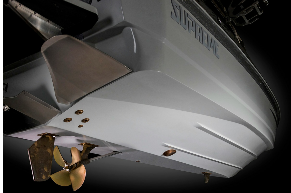
Supreme S 240