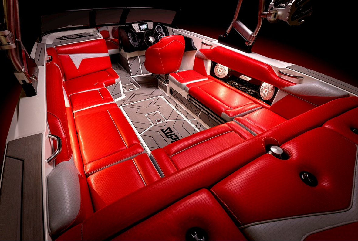
Supreme S 240