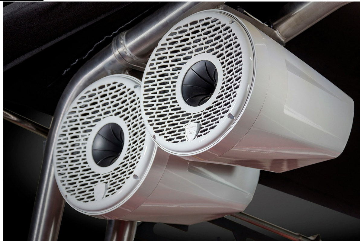
Supreme S 240