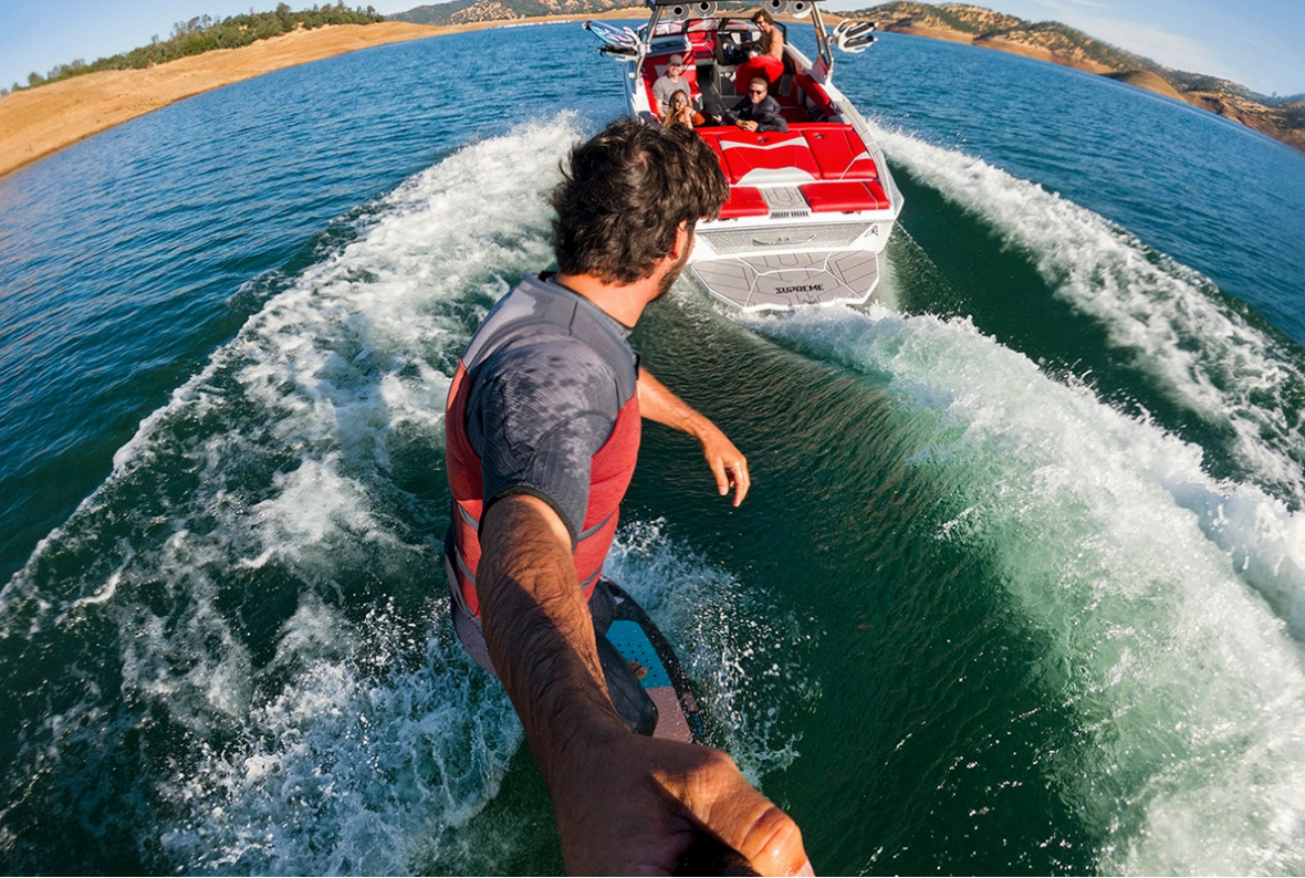
Supreme S 240