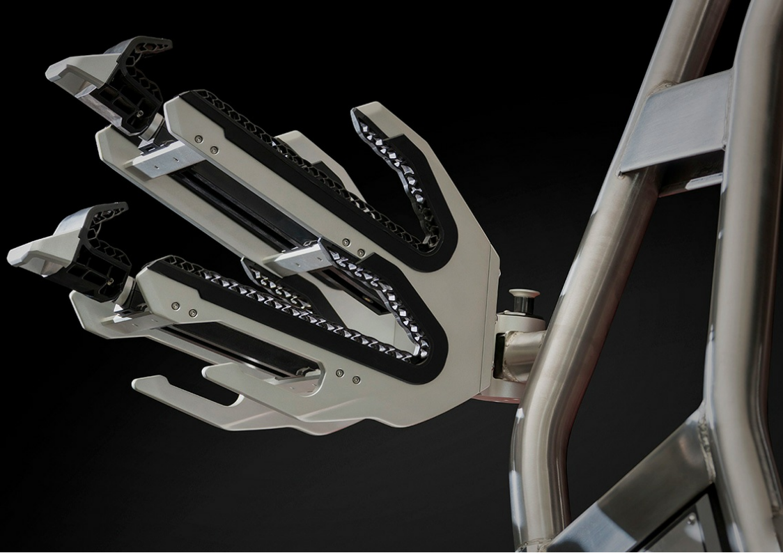
Supreme S 240