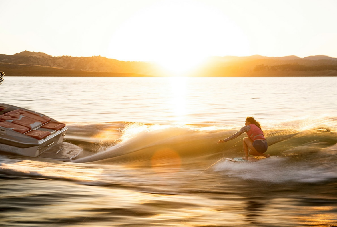
Supreme S 240