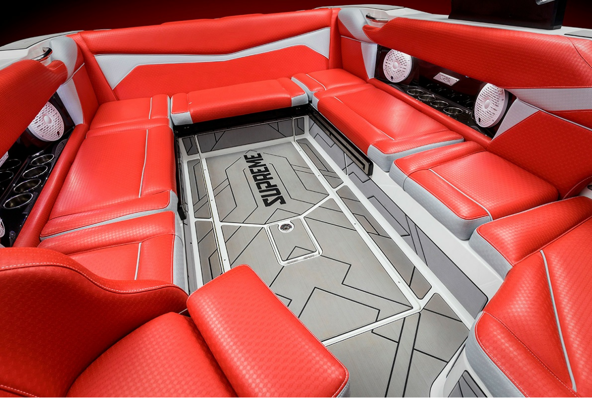
Supreme S 240