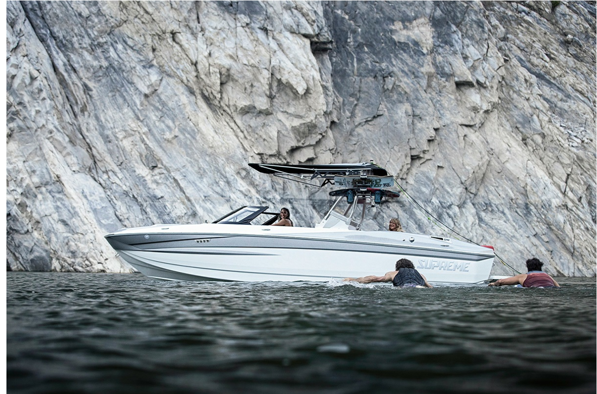
Supreme S 240