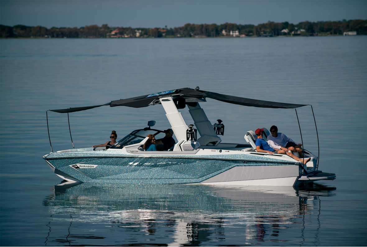
Nautique Super Air G25 Paragon