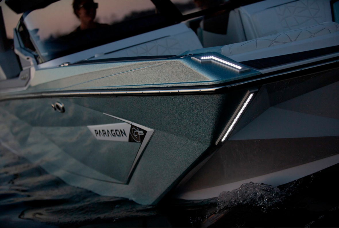
Nautique Super Air G25 Paragon