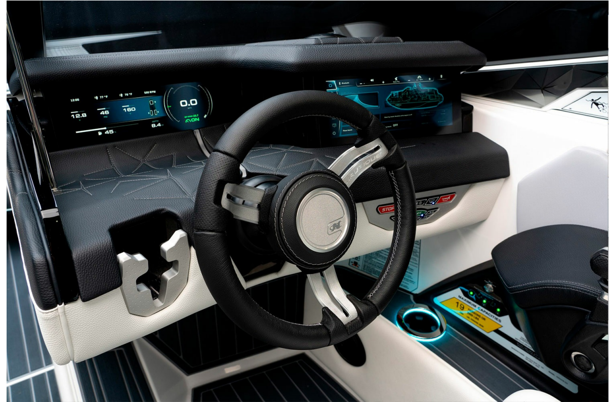
Nautique Super Air G25 Paragon