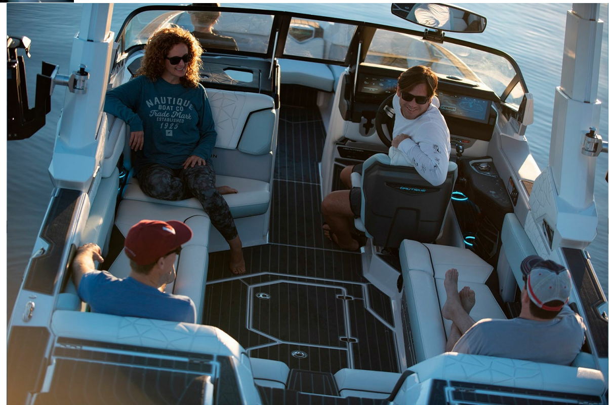
Nautique Super Air G25 Paragon