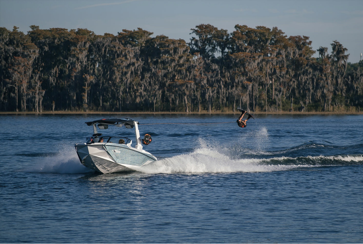
Nautique Super Air G25 Paragon