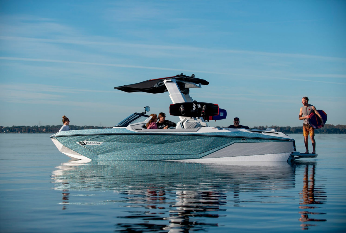
Nautique Super Air G25 Paragon