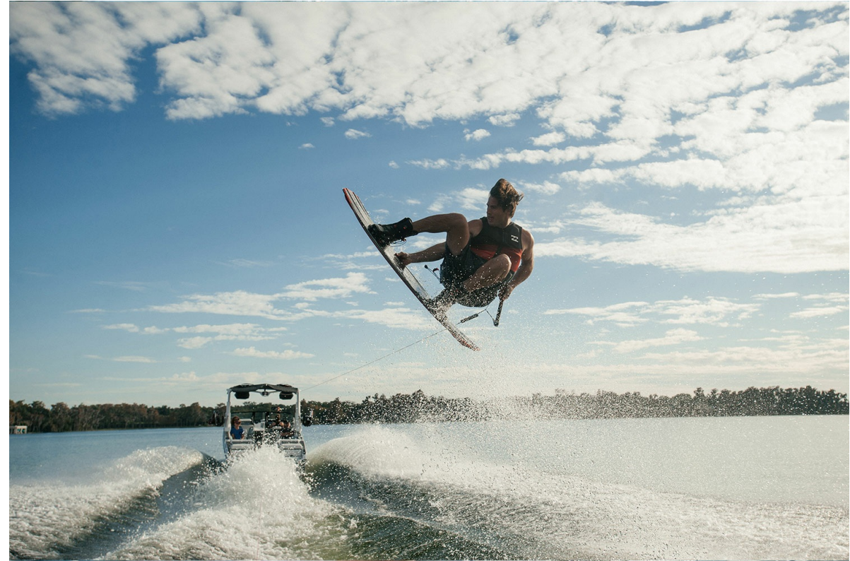
Nautique Super Air G25 Paragon