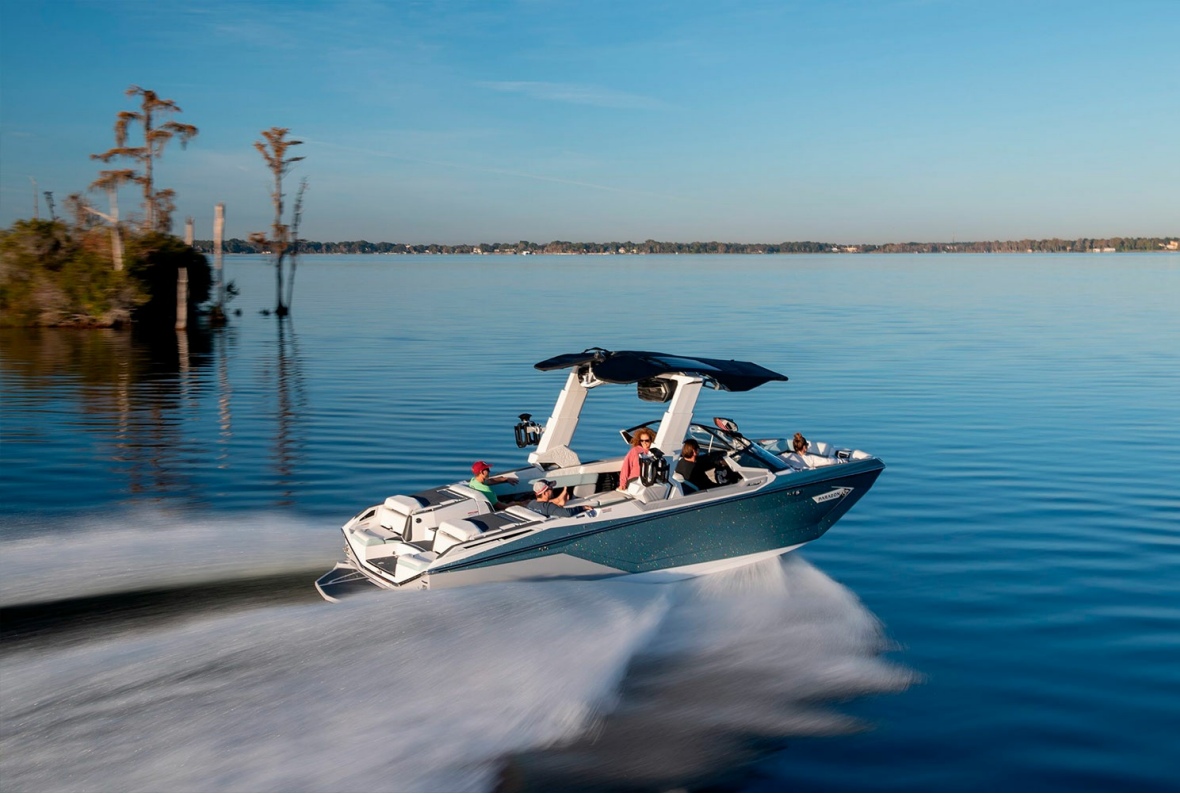
Nautique Super Air G25 Paragon