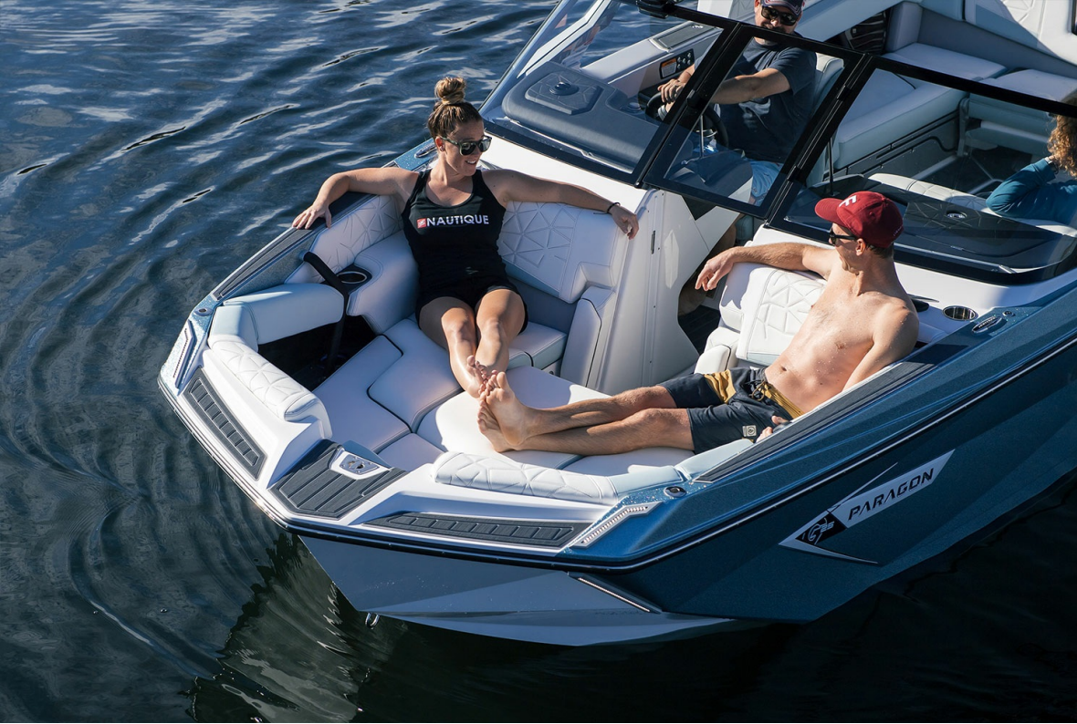
Nautique Super Air G25 Paragon