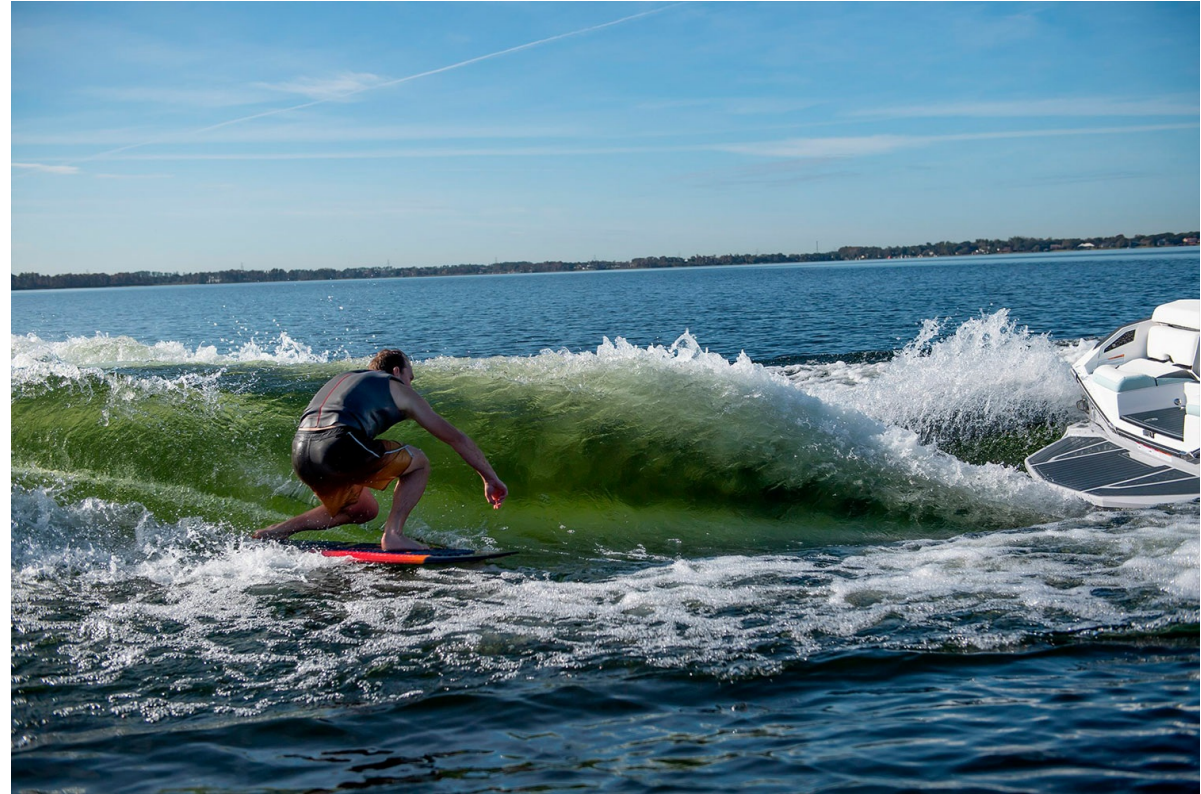
Nautique Super Air G25 Paragon