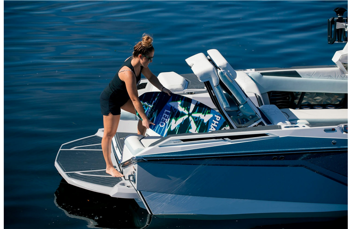
Nautique Super Air G25 Paragon