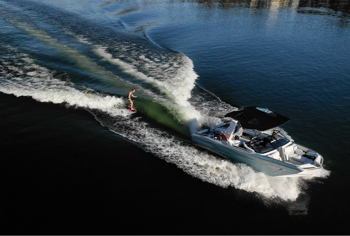
Nautique Super Air G25 Paragon