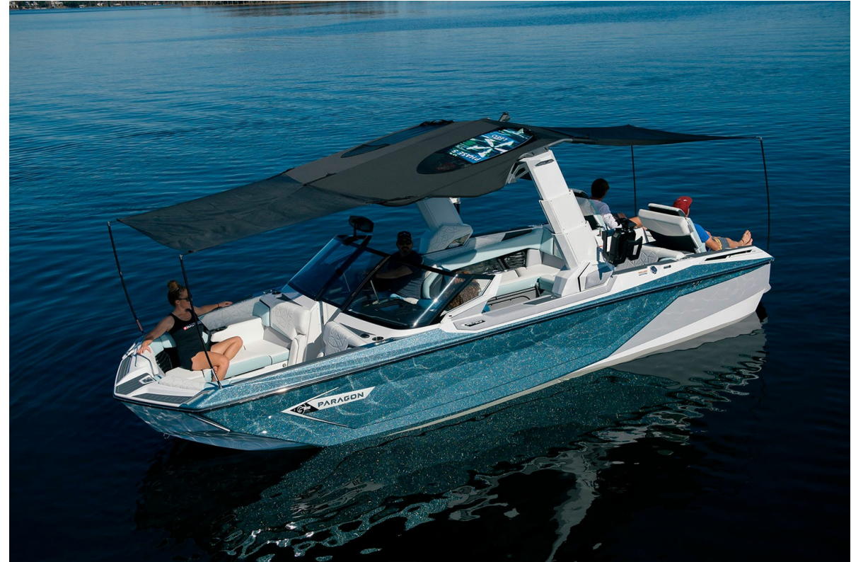
Nautique Super Air G25 Paragon