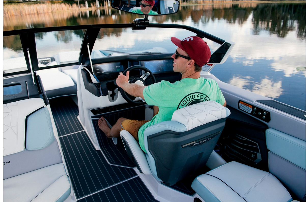
Nautique Super Air G25 Paragon