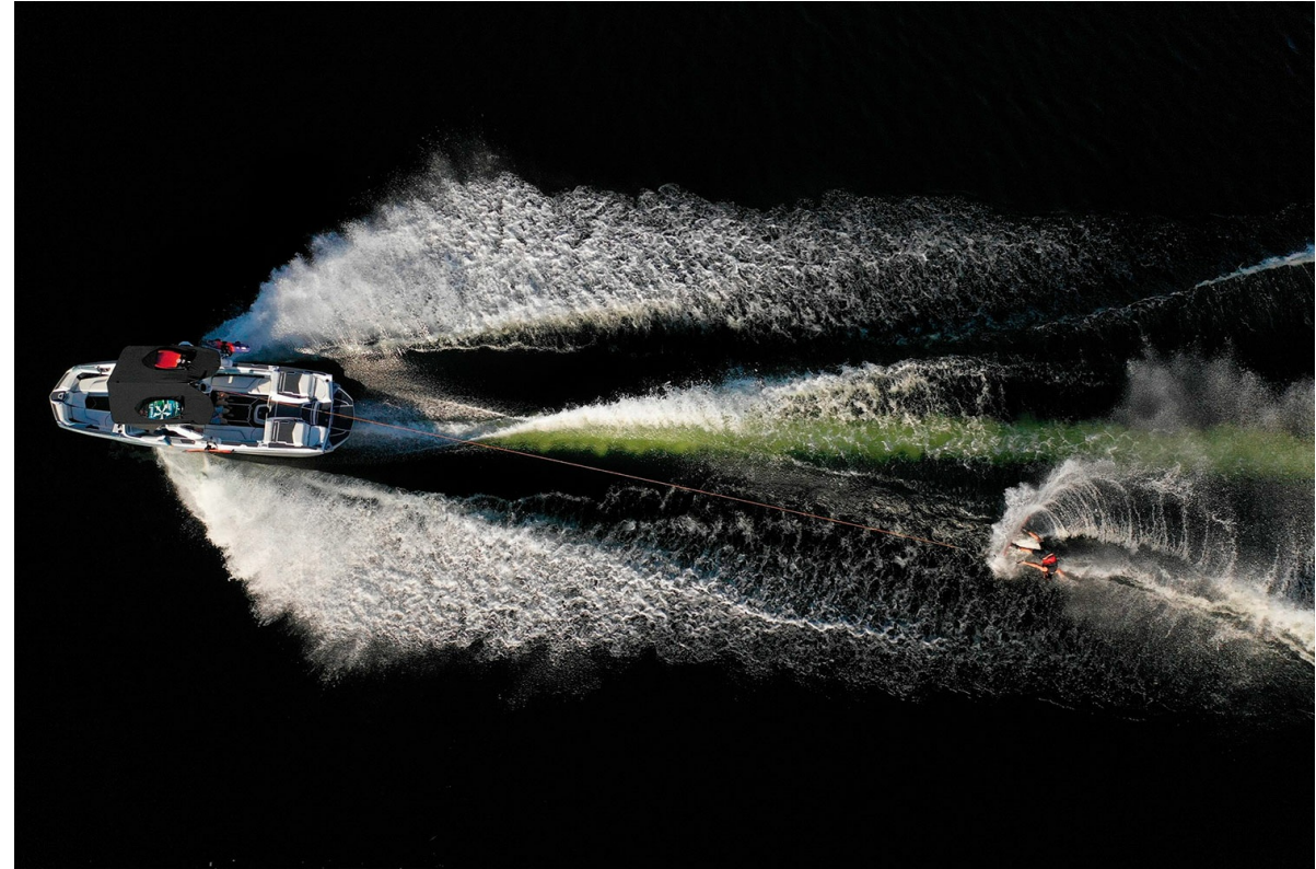
Nautique Super Air G25 Paragon