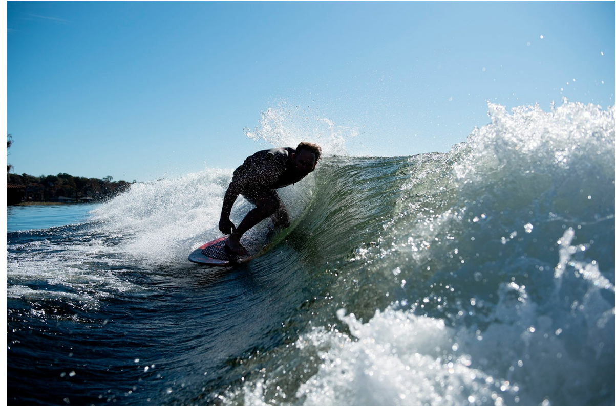
Nautique Super Air G25 Paragon