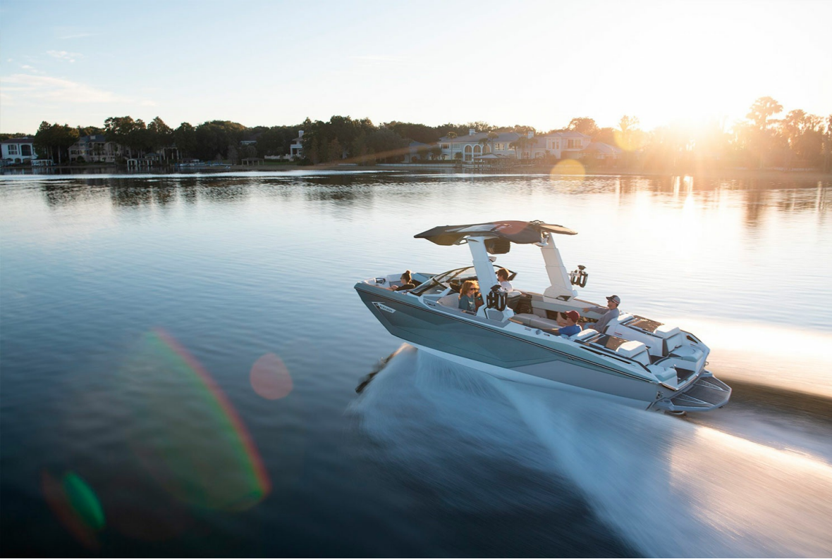
Nautique Super Air G25 Paragon