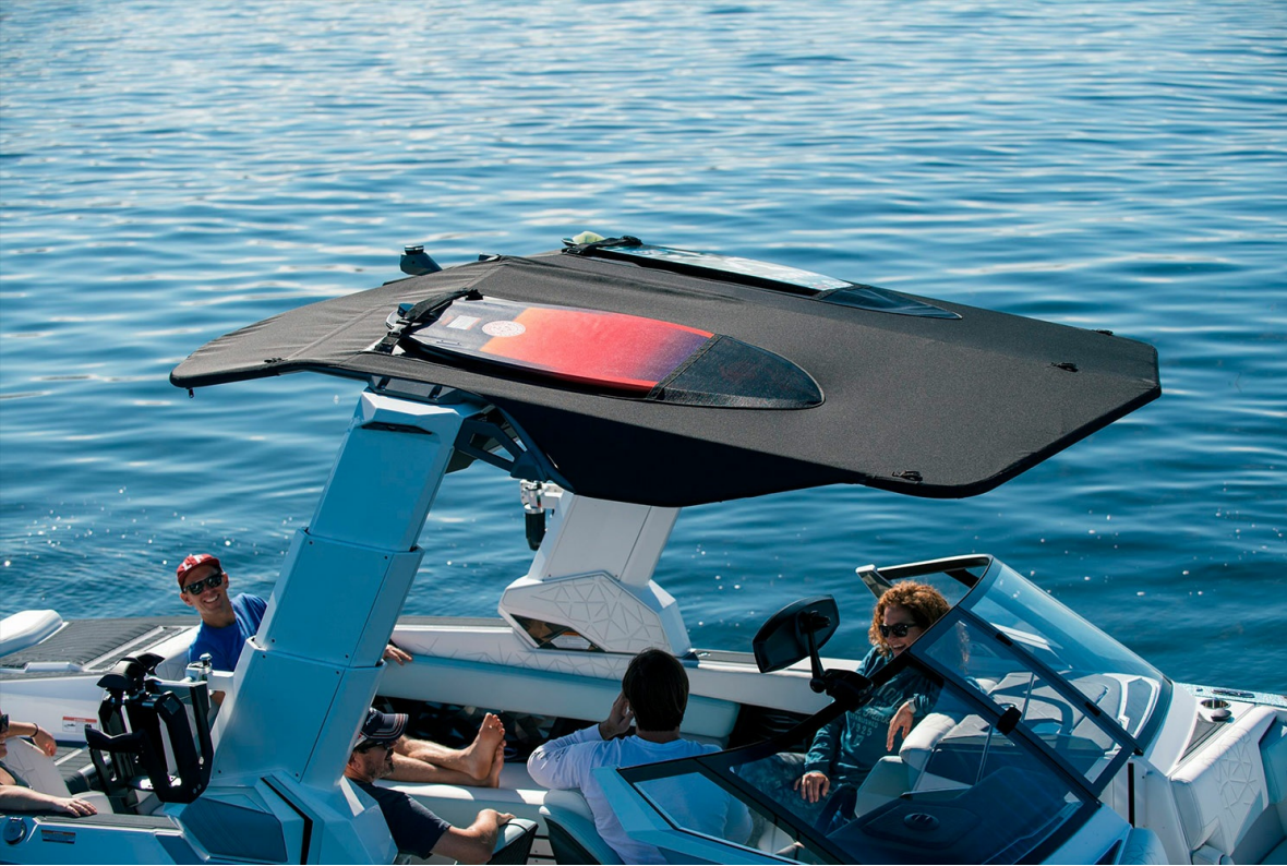
Nautique Super Air G25 Paragon