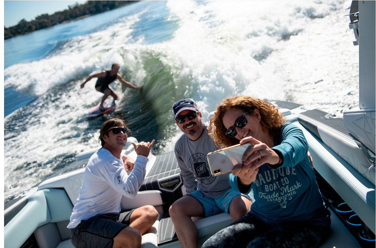
Nautique Super Air G25 Paragon