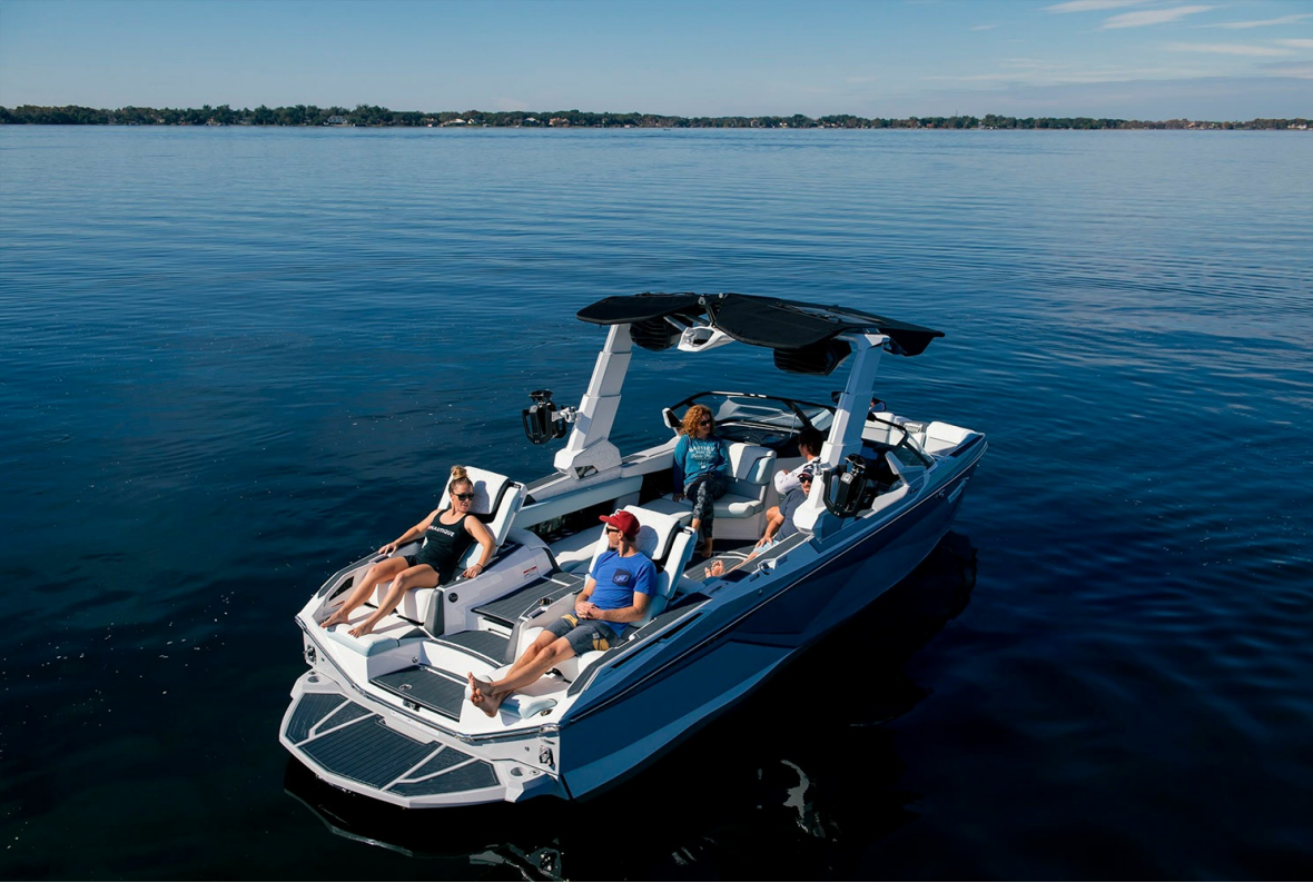
Nautique Super Air G25 Paragon