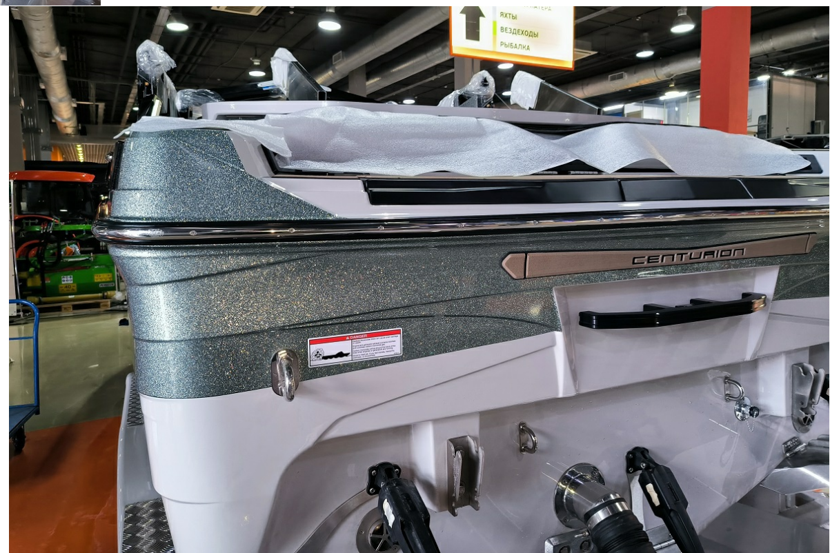
В наличии В наличии Centurion Ri230 2026