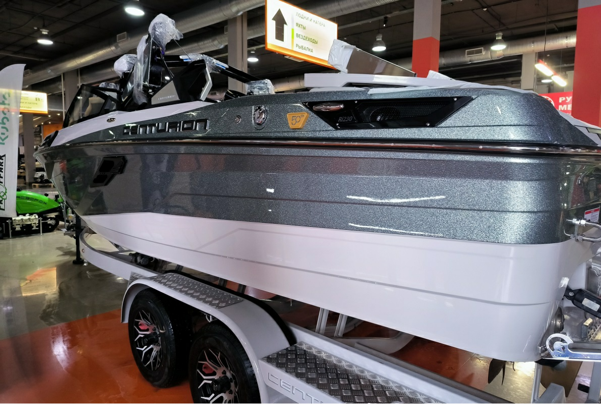
В наличии В наличии Centurion Ri230 2026