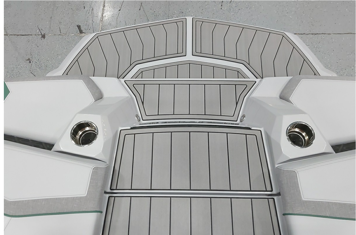
Super Air Nautique GS24 2026