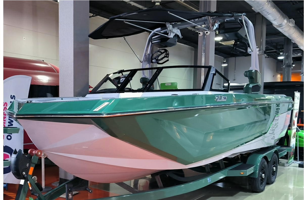
Super Air Nautique GS24 2026