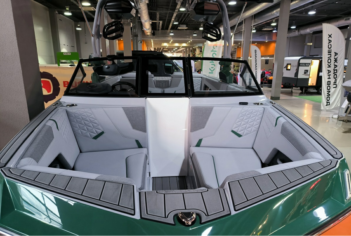
Super Air Nautique GS24 2026