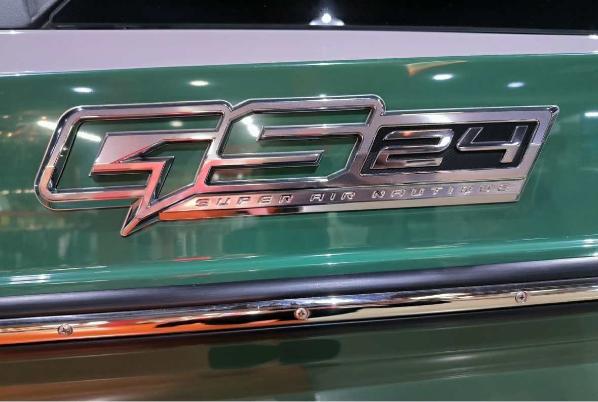
Super Air Nautique GS24 2026