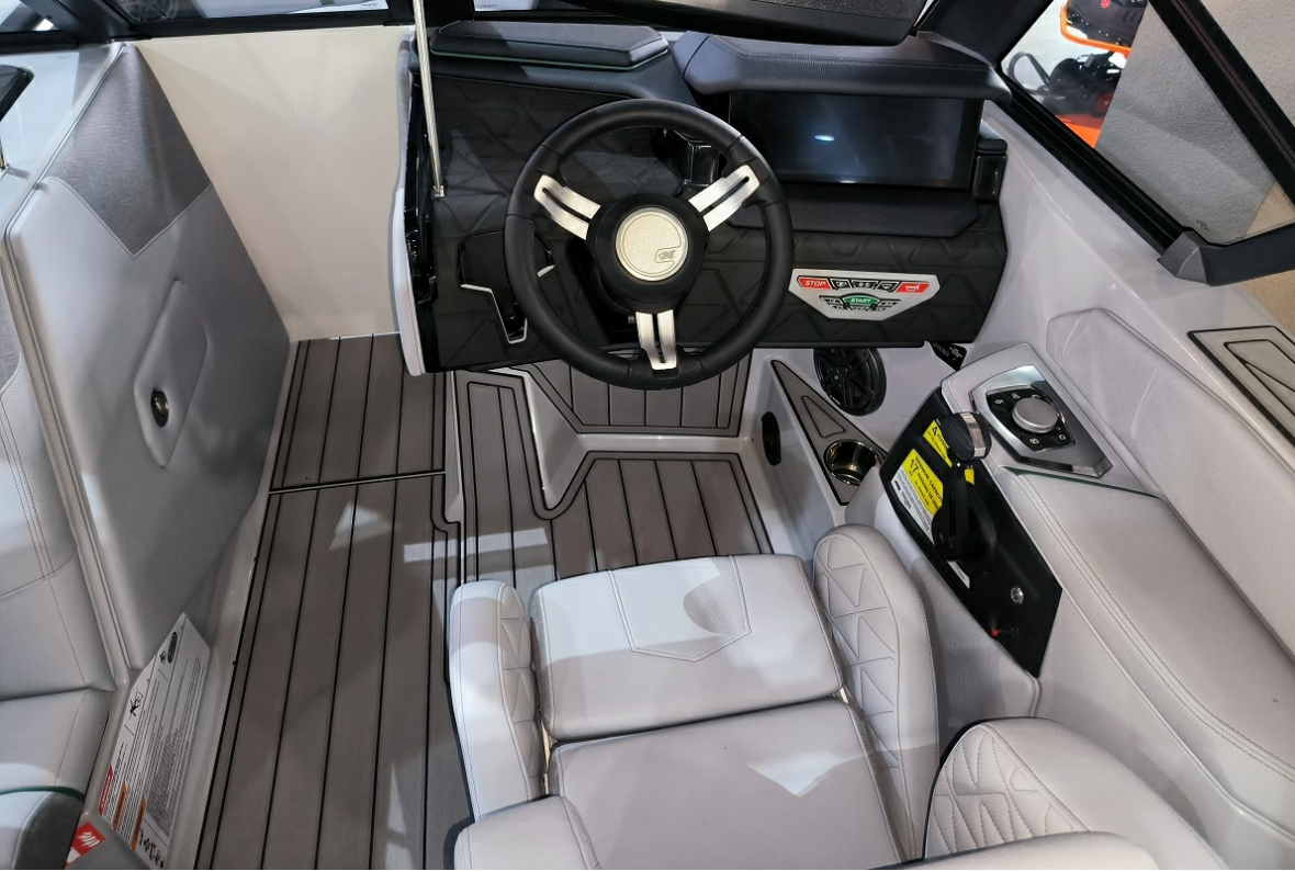
Super Air Nautique GS24 2026