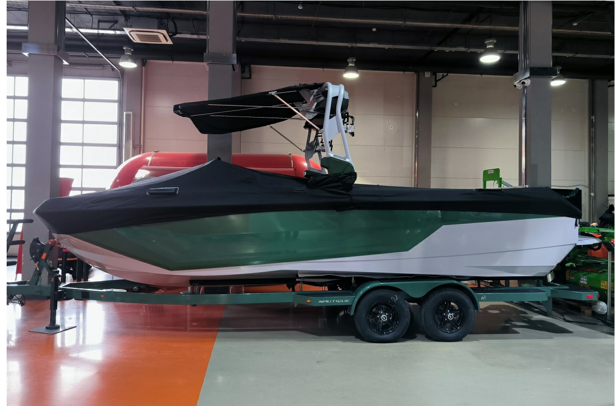
Super Air Nautique GS24 2026