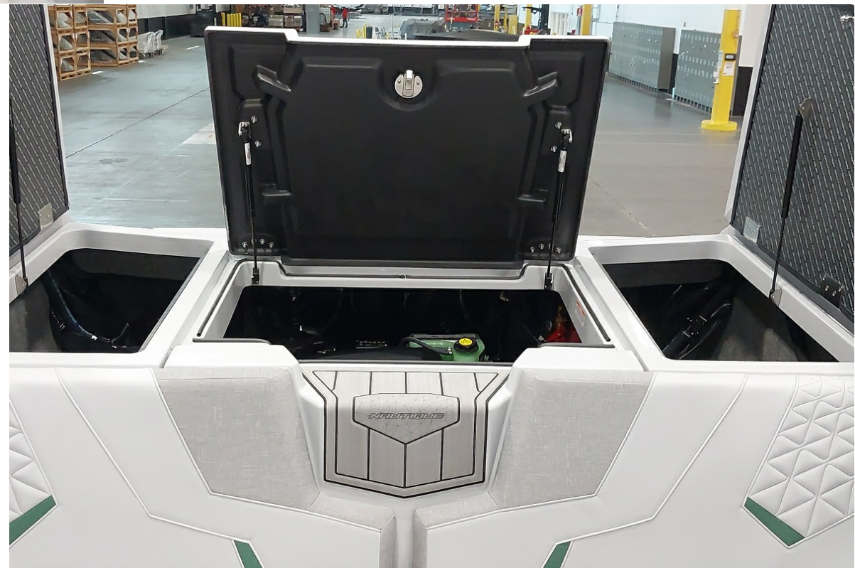
Super Air Nautique GS24 2026