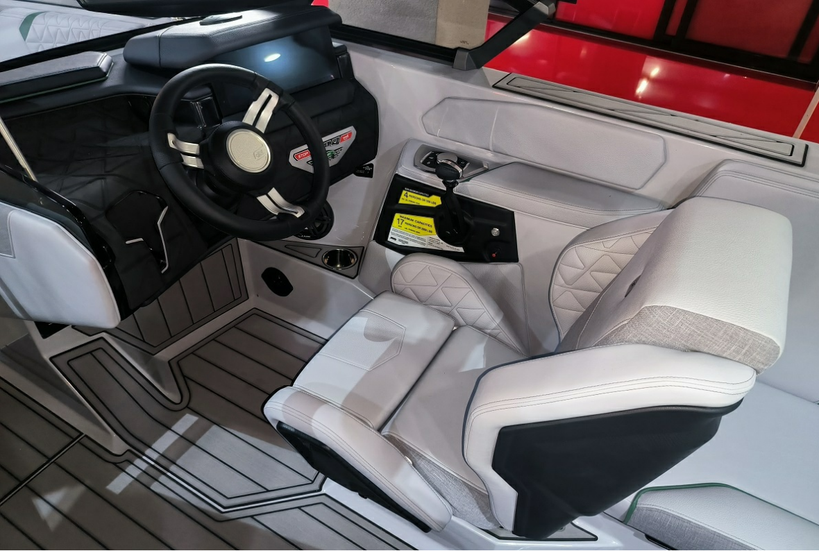
Super Air Nautique GS24 2026