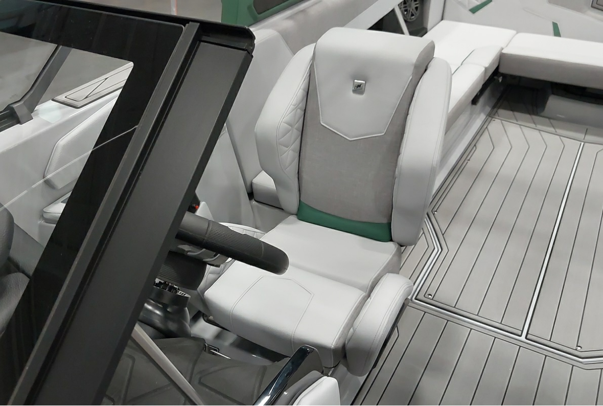
Super Air Nautique GS24 2026