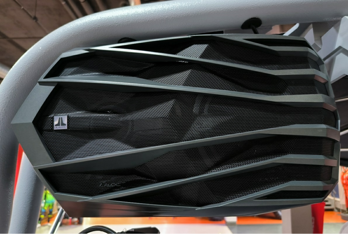
Super Air Nautique GS24 2026