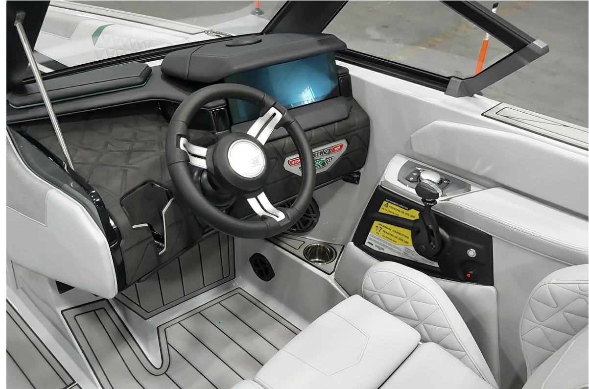
Super Air Nautique GS24 2026