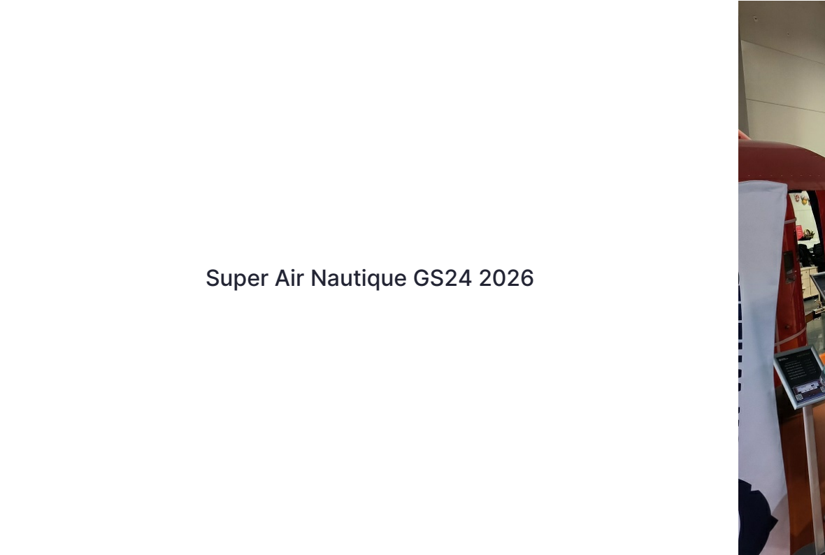
Super Air Nautique GS24 2026