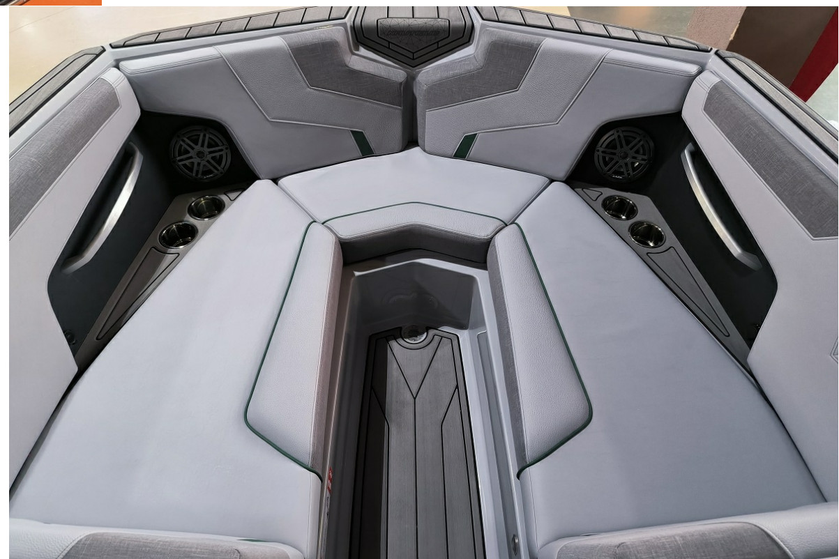
Super Air Nautique GS24 2026