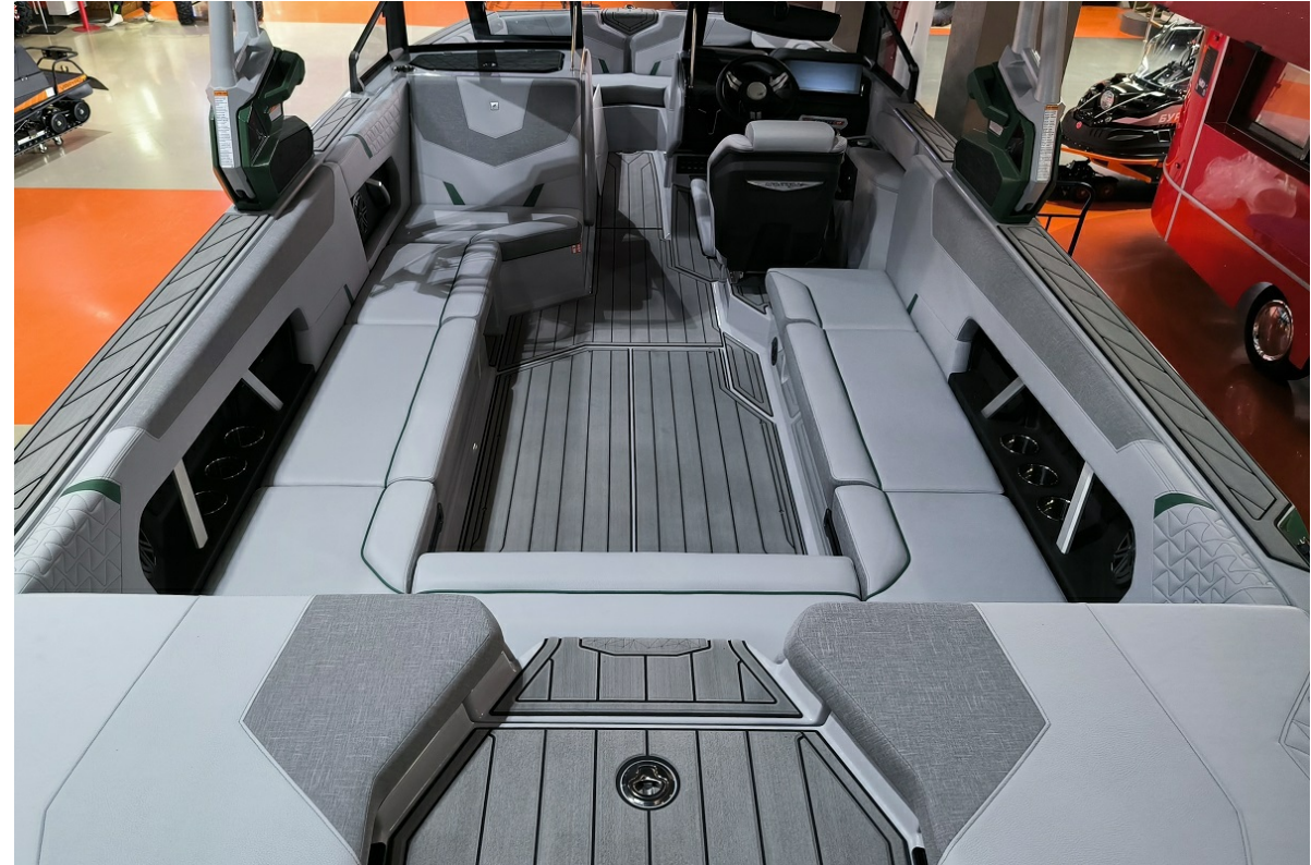
Super Air Nautique GS24 2026