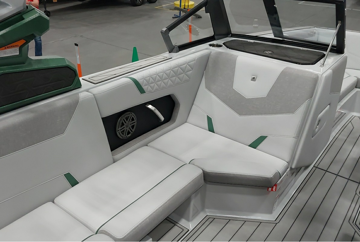
Super Air Nautique GS24 2026