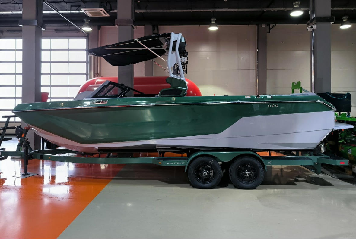
Super Air Nautique GS24 2026