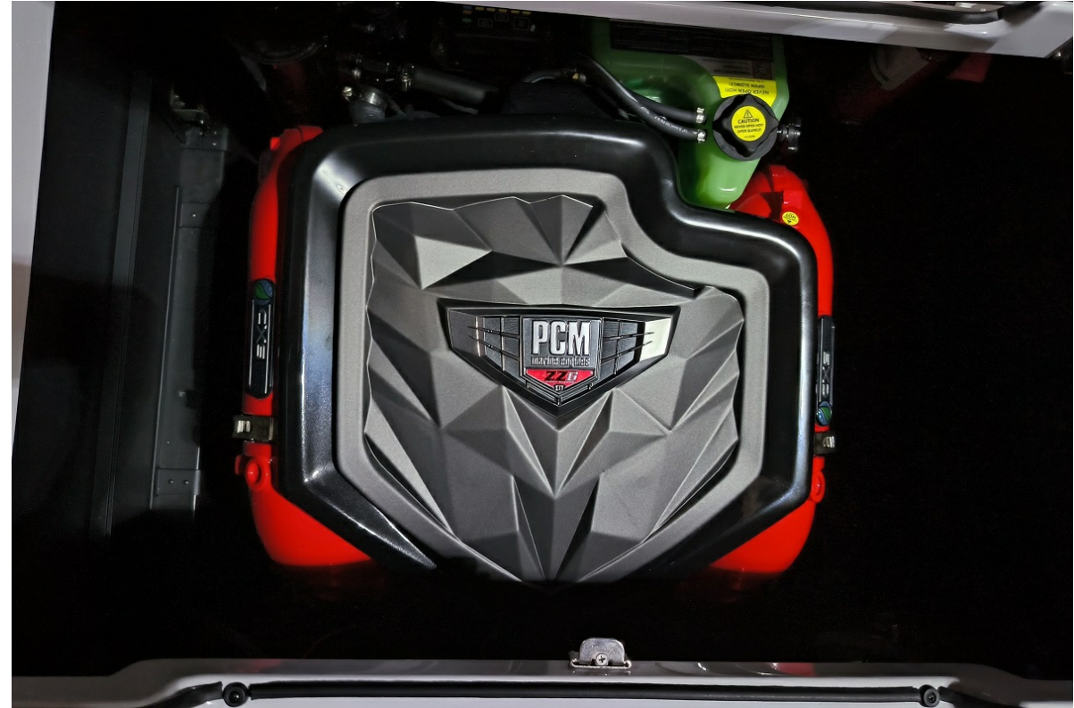
Super Air Nautique GS24 2026