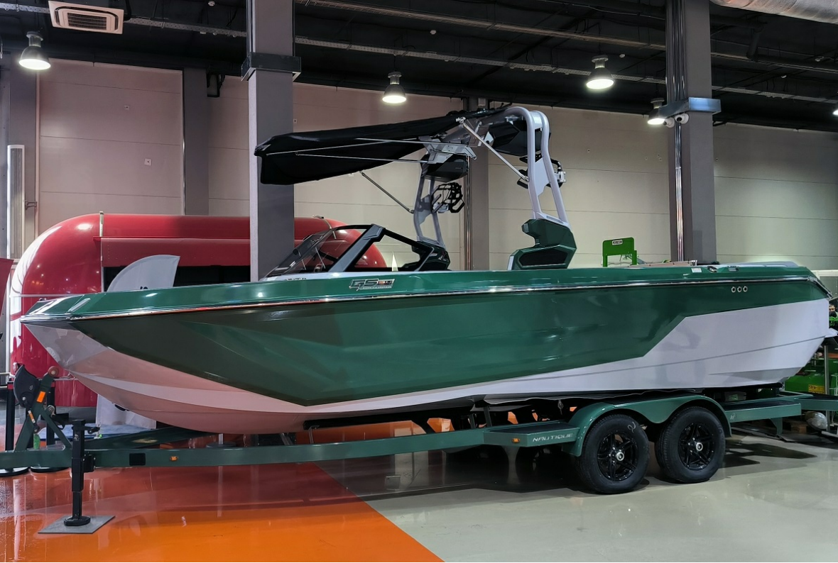
Super Air Nautique GS24 2026