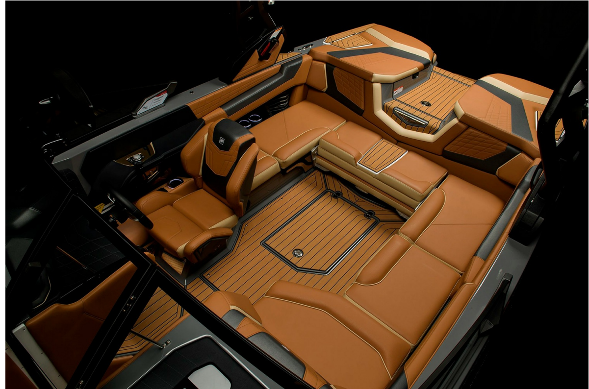
Nautique Super Air G21