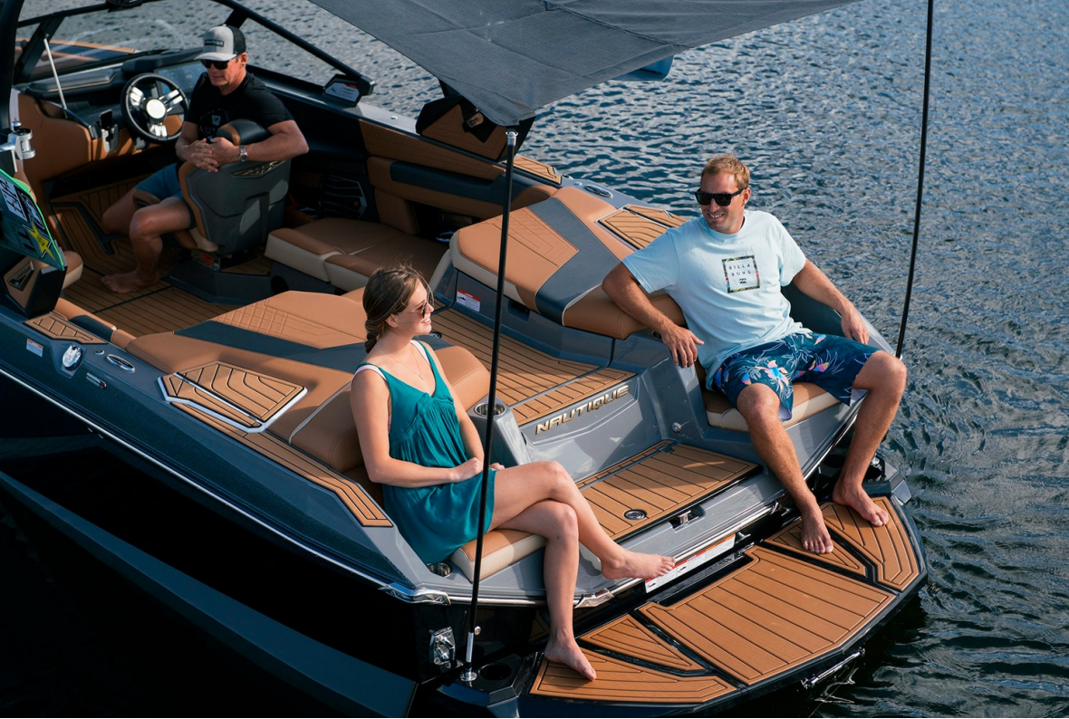
Nautique Super Air G21