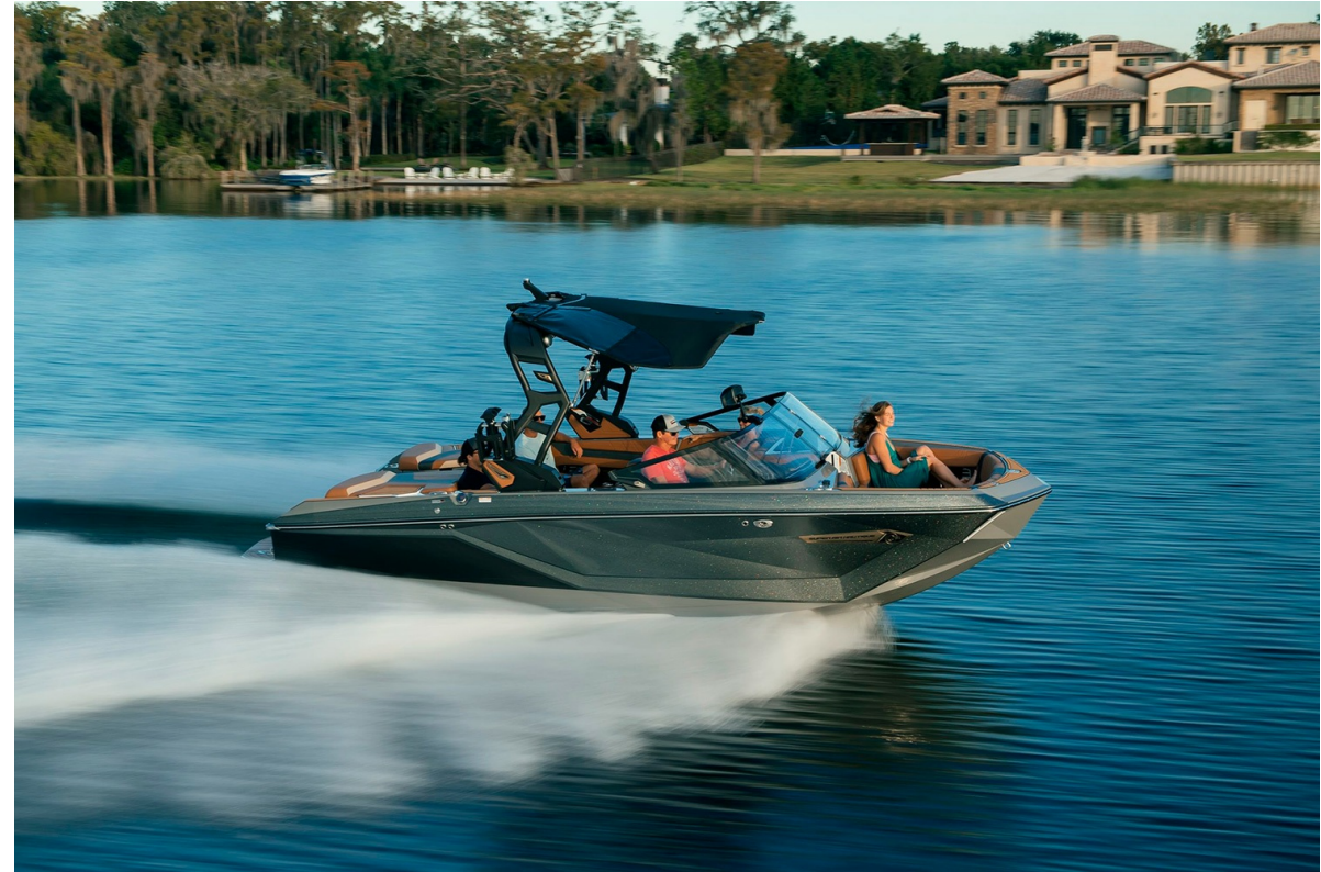
Nautique Super Air G21