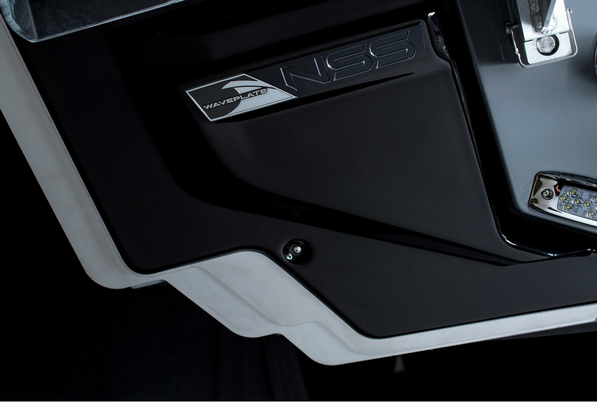
Nautique Super Air G21