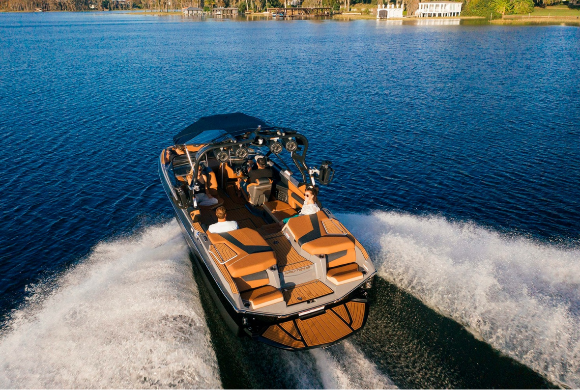
Nautique Super Air G21