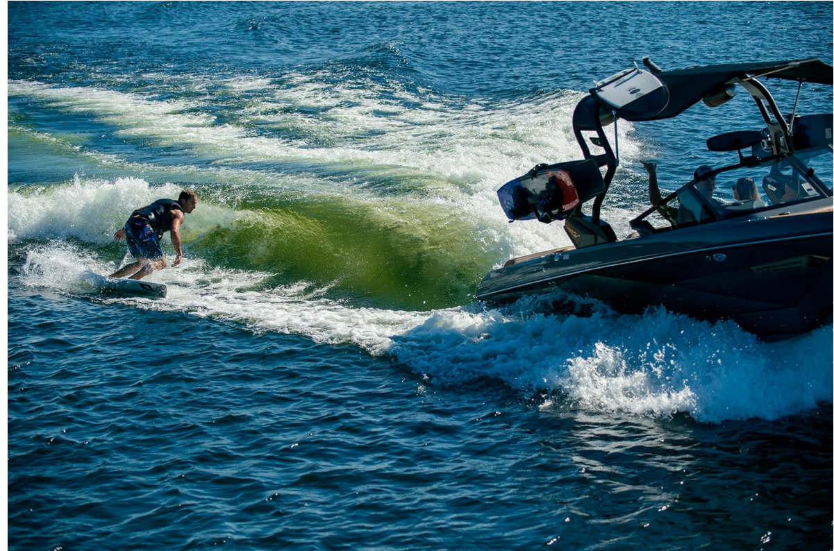
Nautique Super Air G21