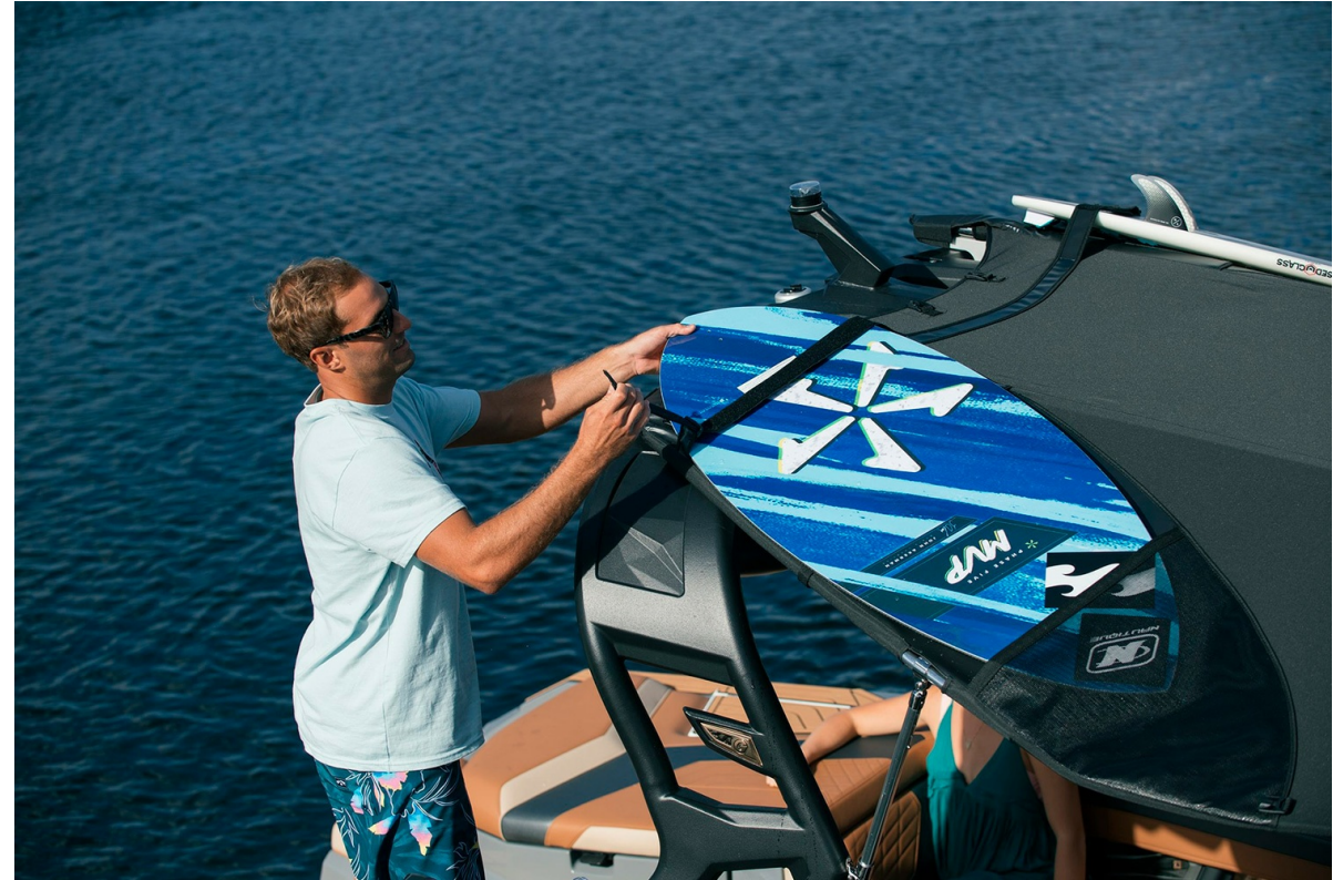
Nautique Super Air G21