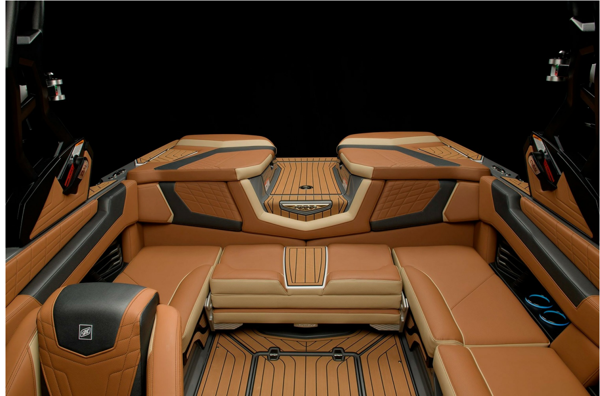
Nautique Super Air G21