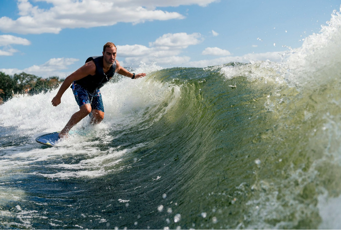
Nautique Super Air G21