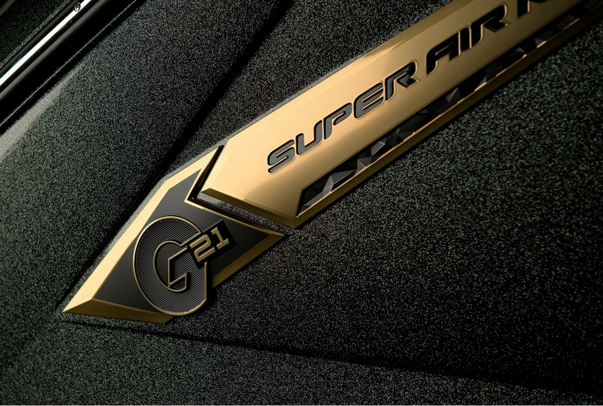
Nautique Super Air G21