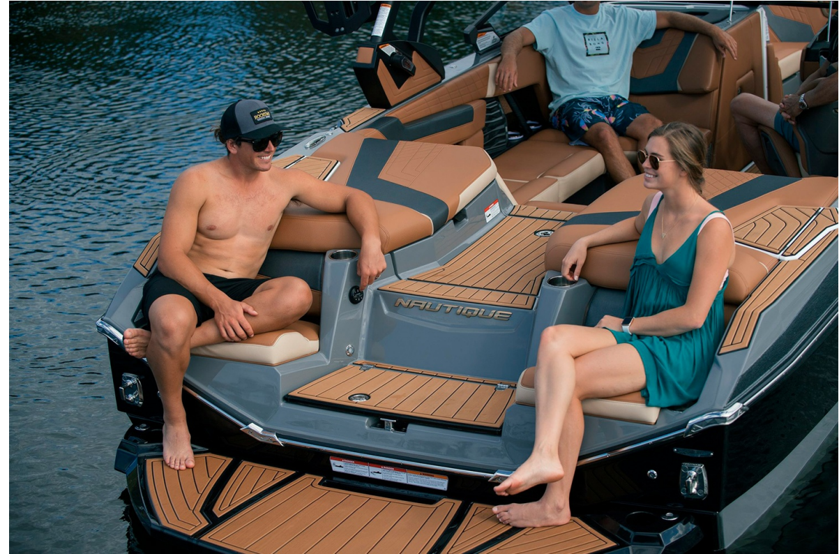
Nautique Super Air G21