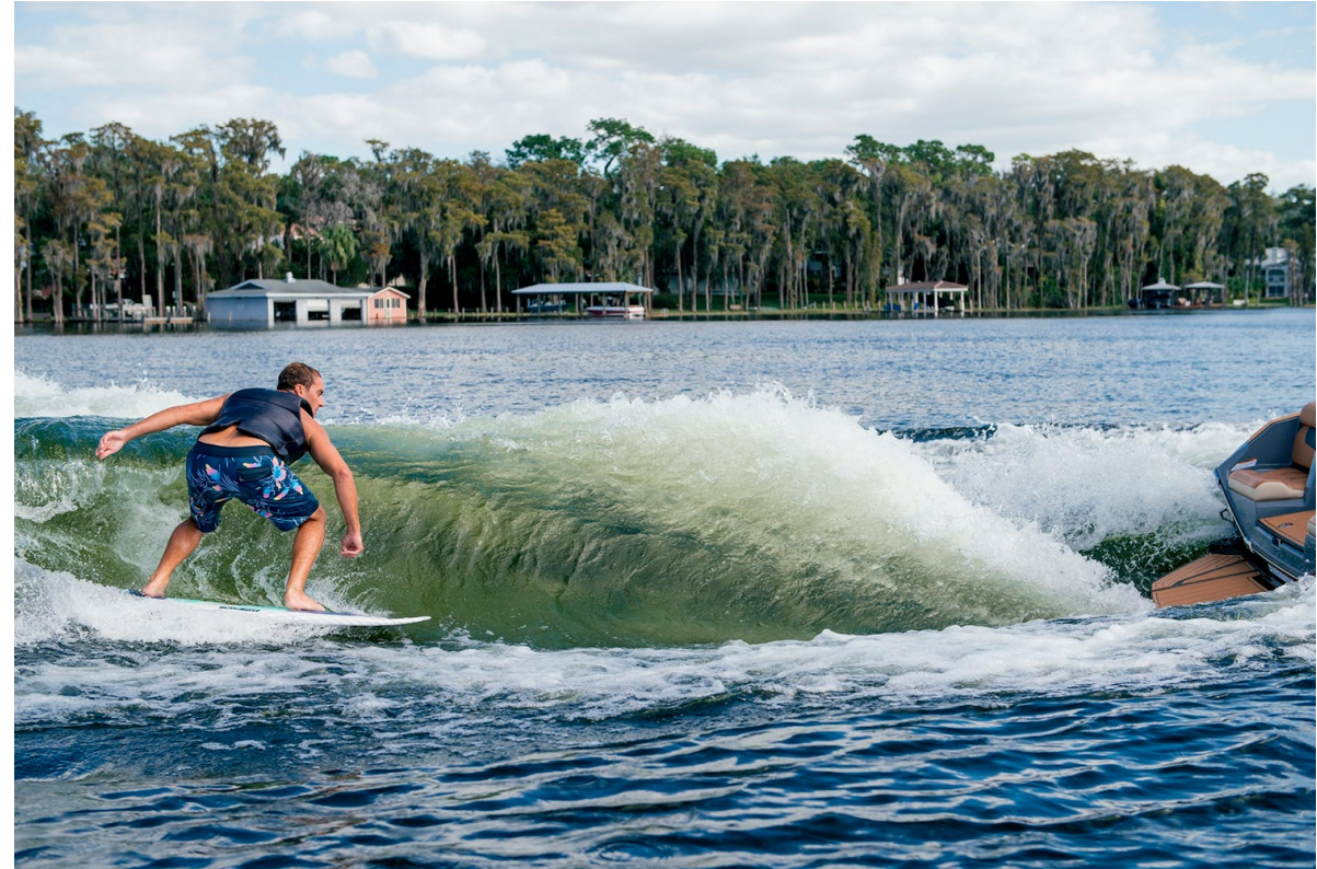
Nautique Super Air G21