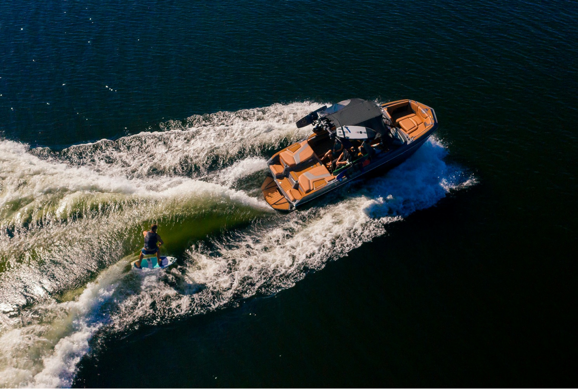
Nautique Super Air G21