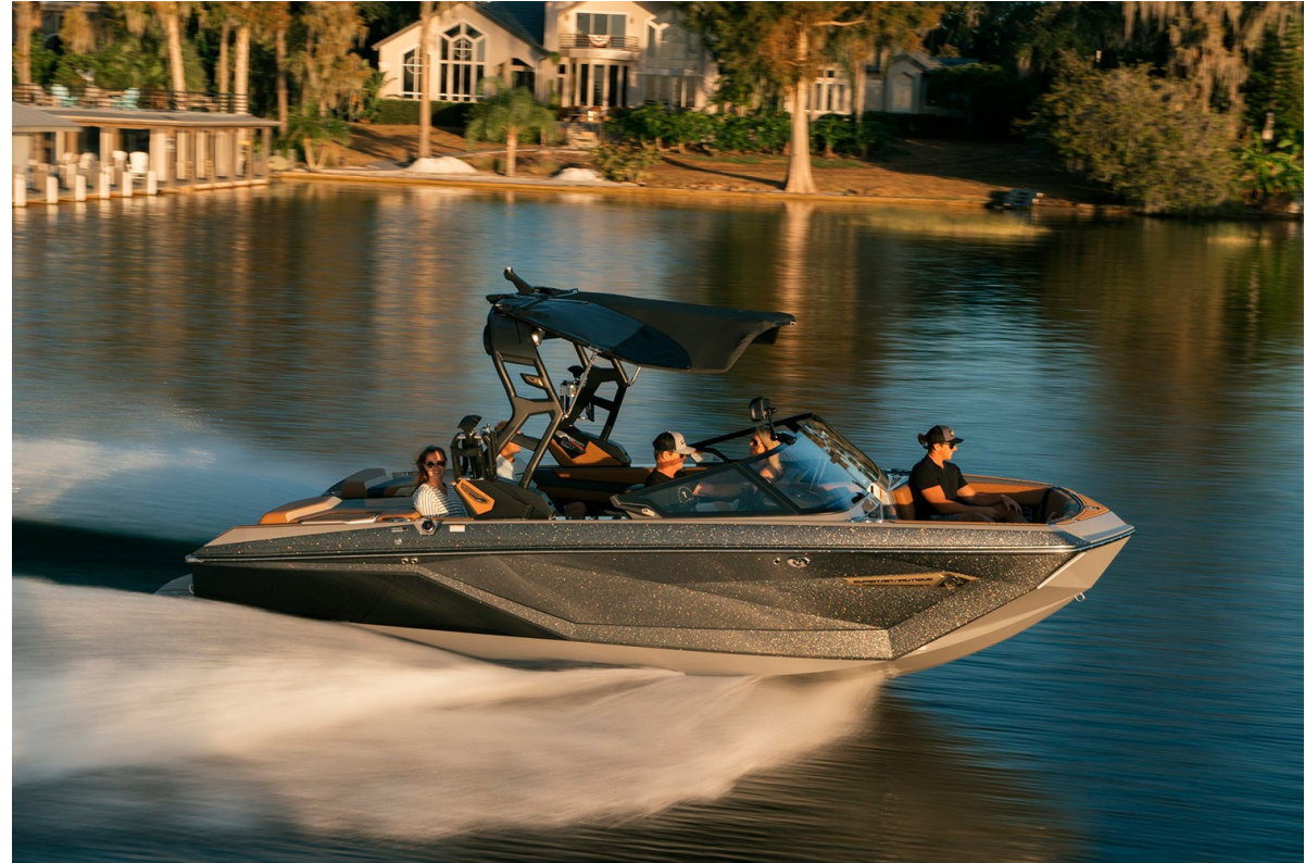
Nautique Super Air G21