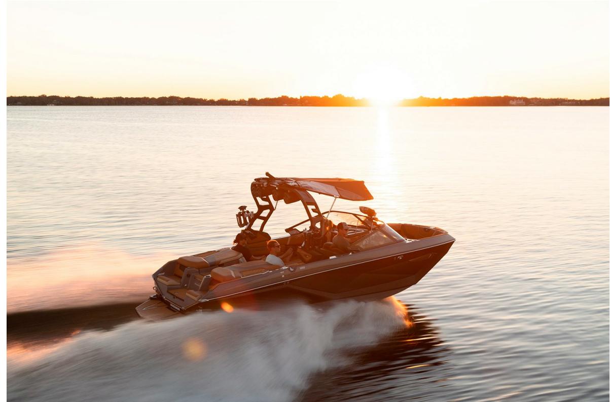
Nautique Super Air G21