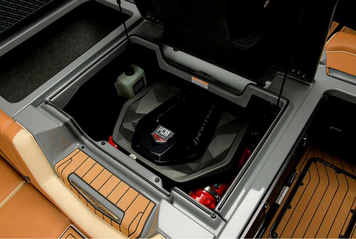
Nautique Super Air G21