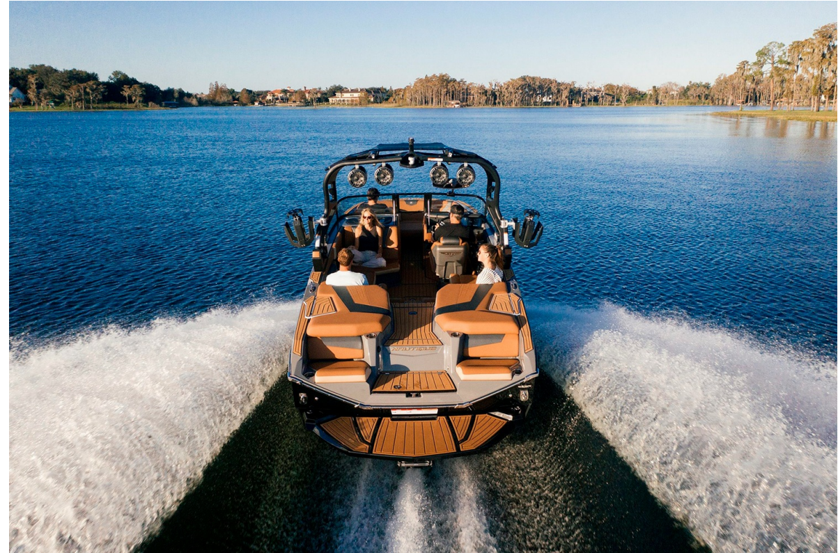
Nautique Super Air G21