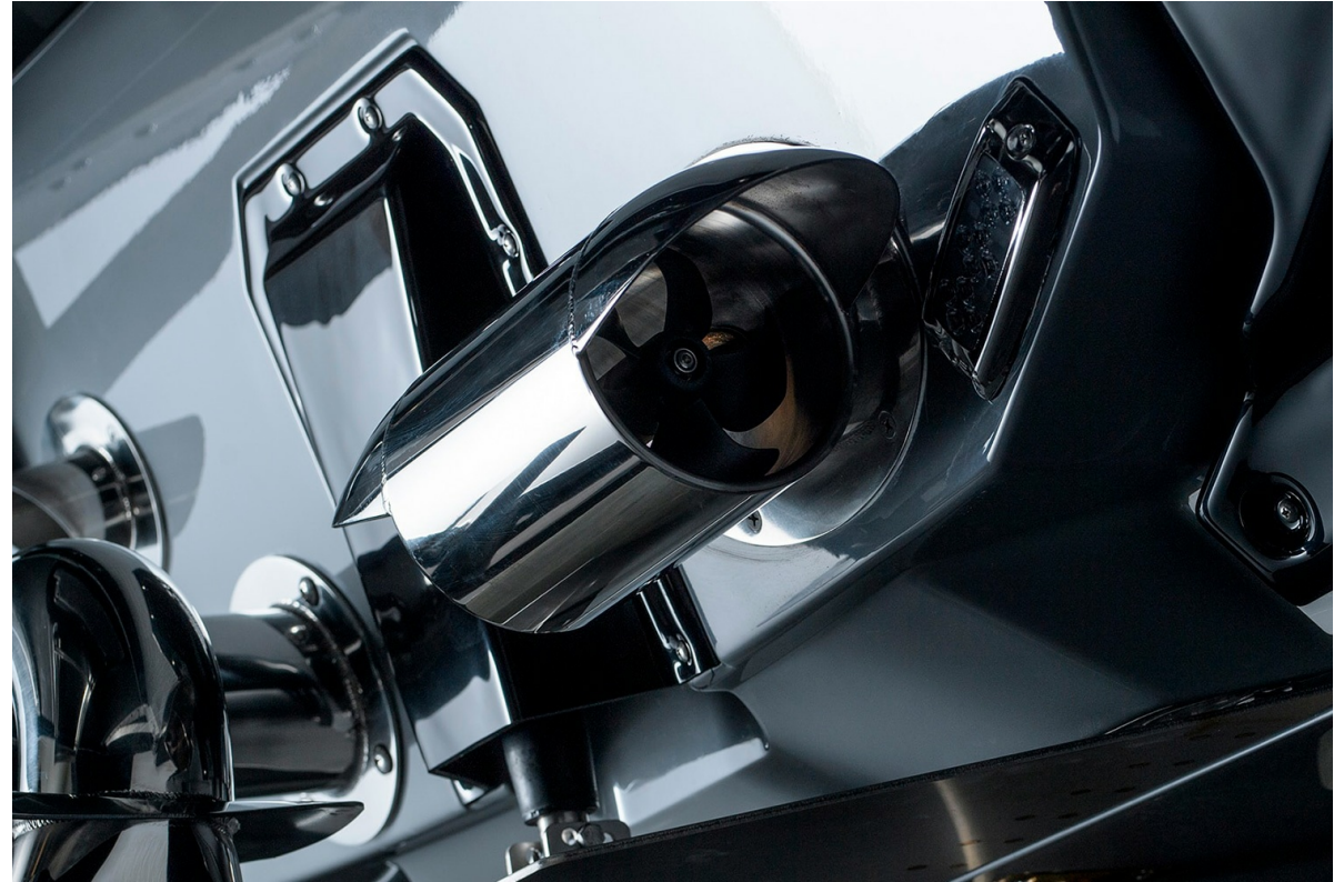
Nautique Super Air G21