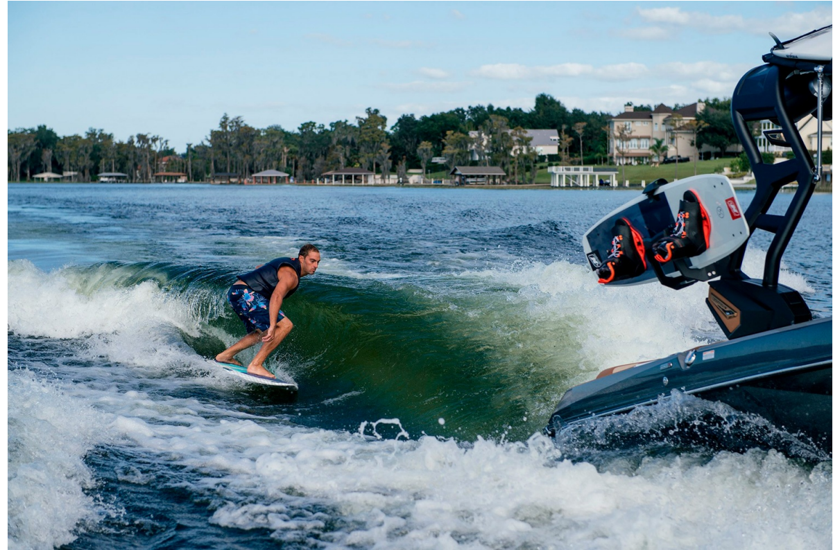
Nautique Super Air G21