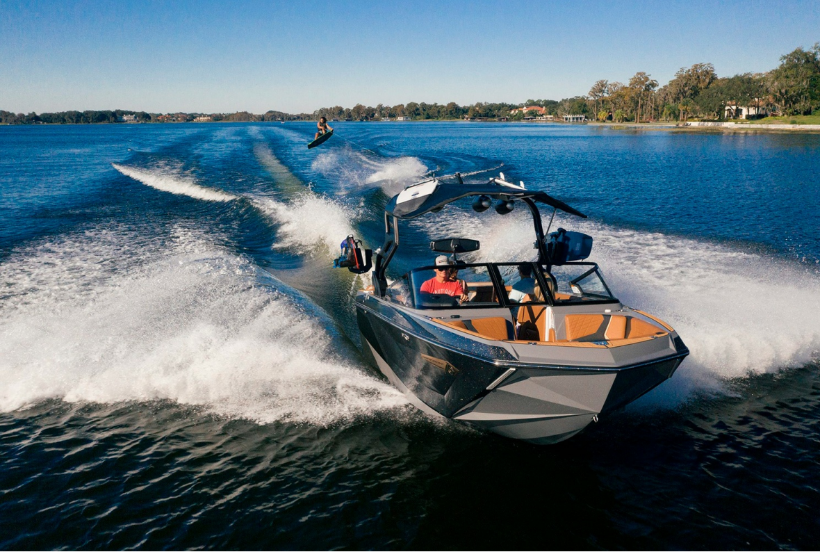
Nautique Super Air G21