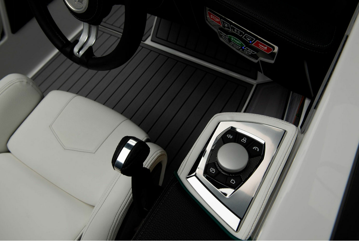
Nautique Super Air GS20