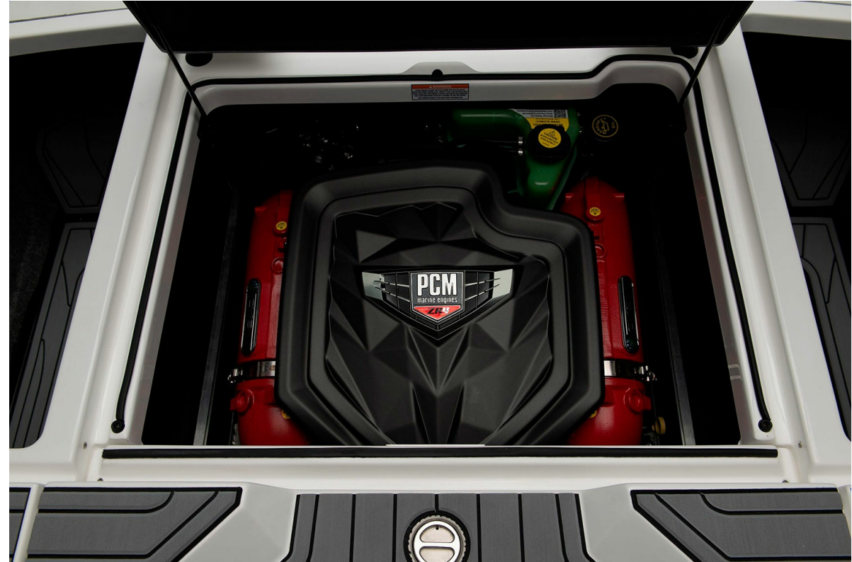
Nautique Super Air GS20