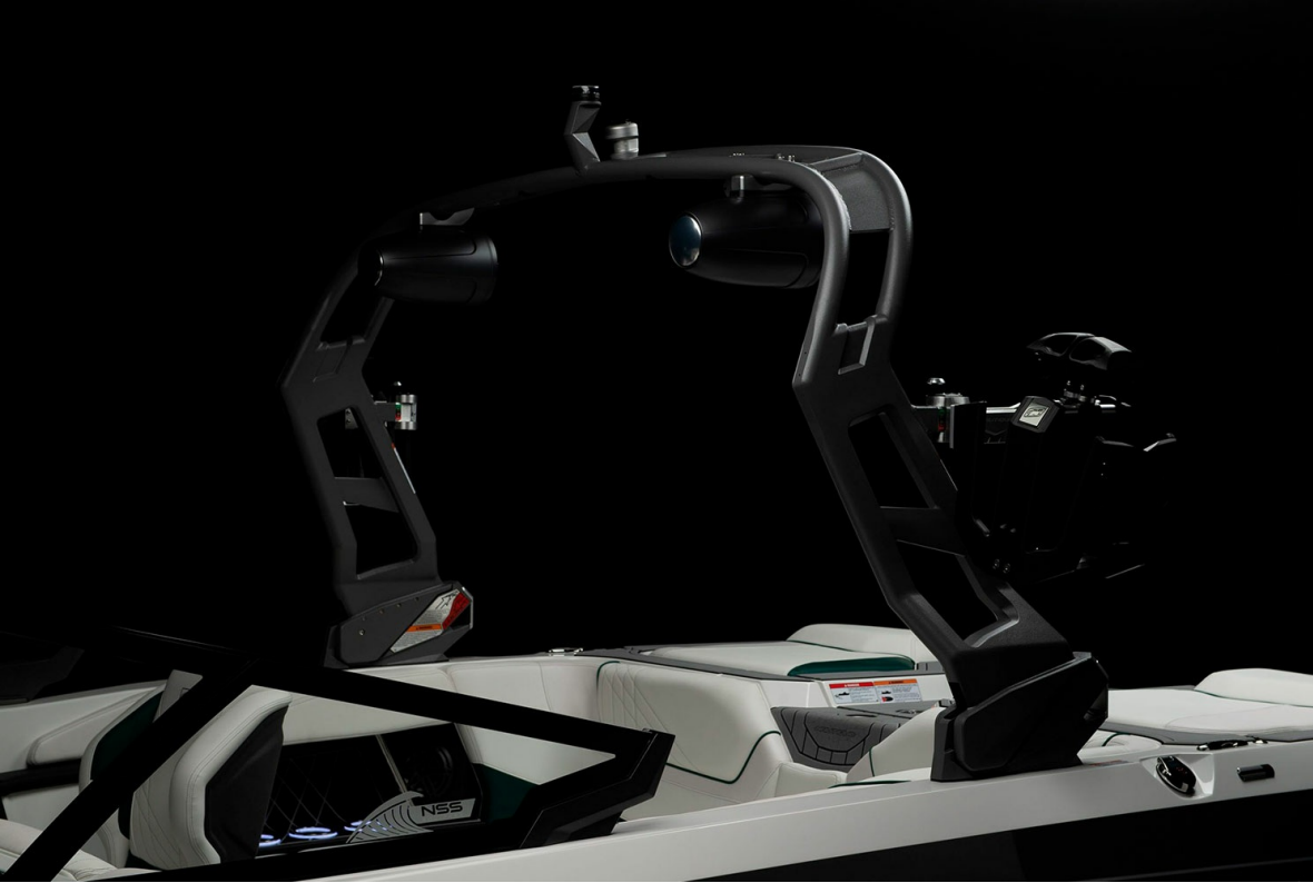
Nautique Super Air GS20