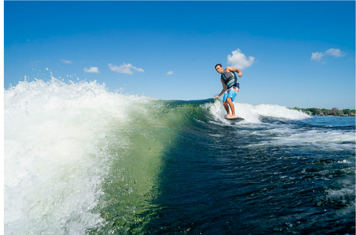
Nautique Super Air GS20