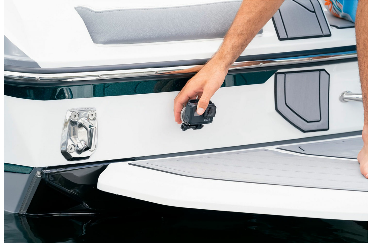
Nautique Super Air GS20