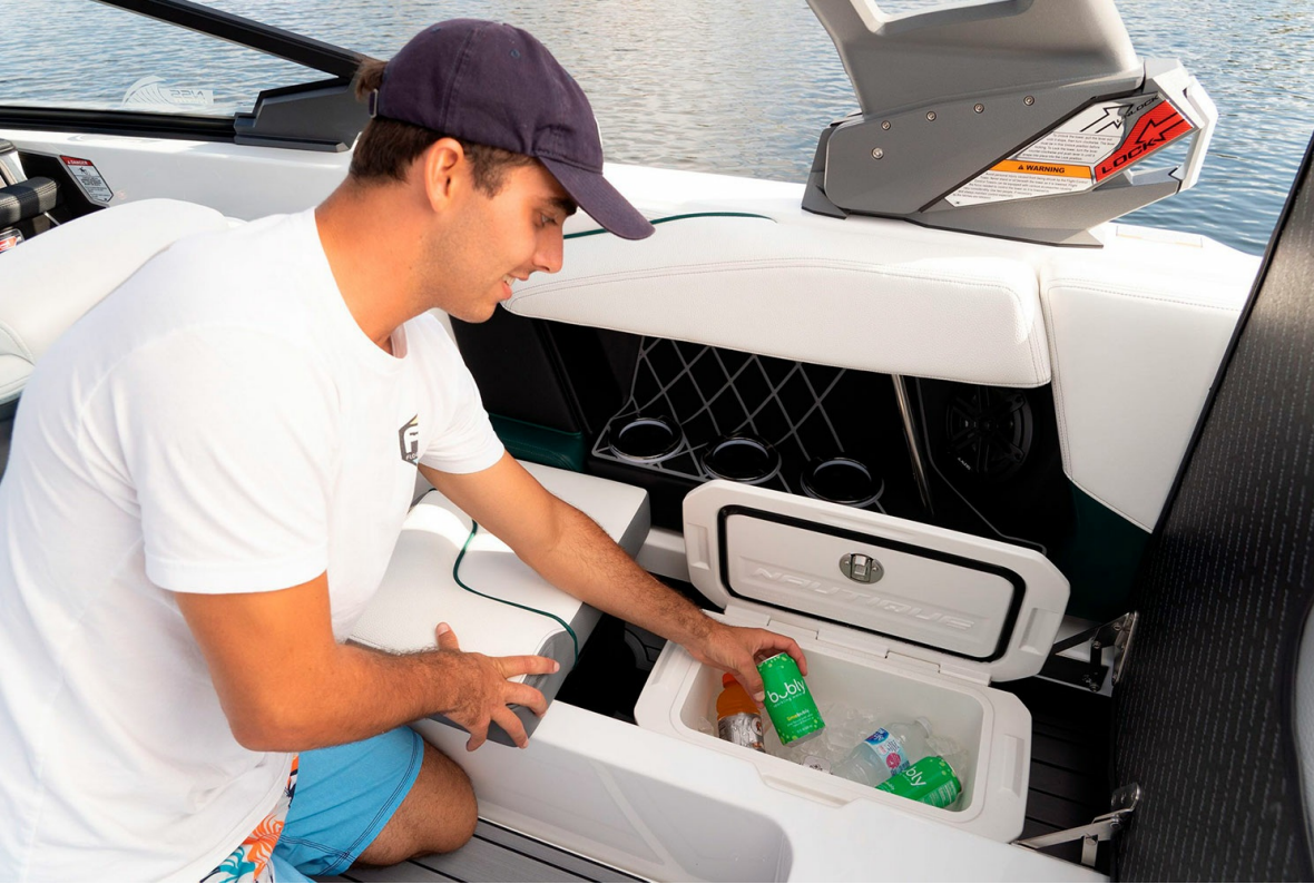
Nautique Super Air GS20