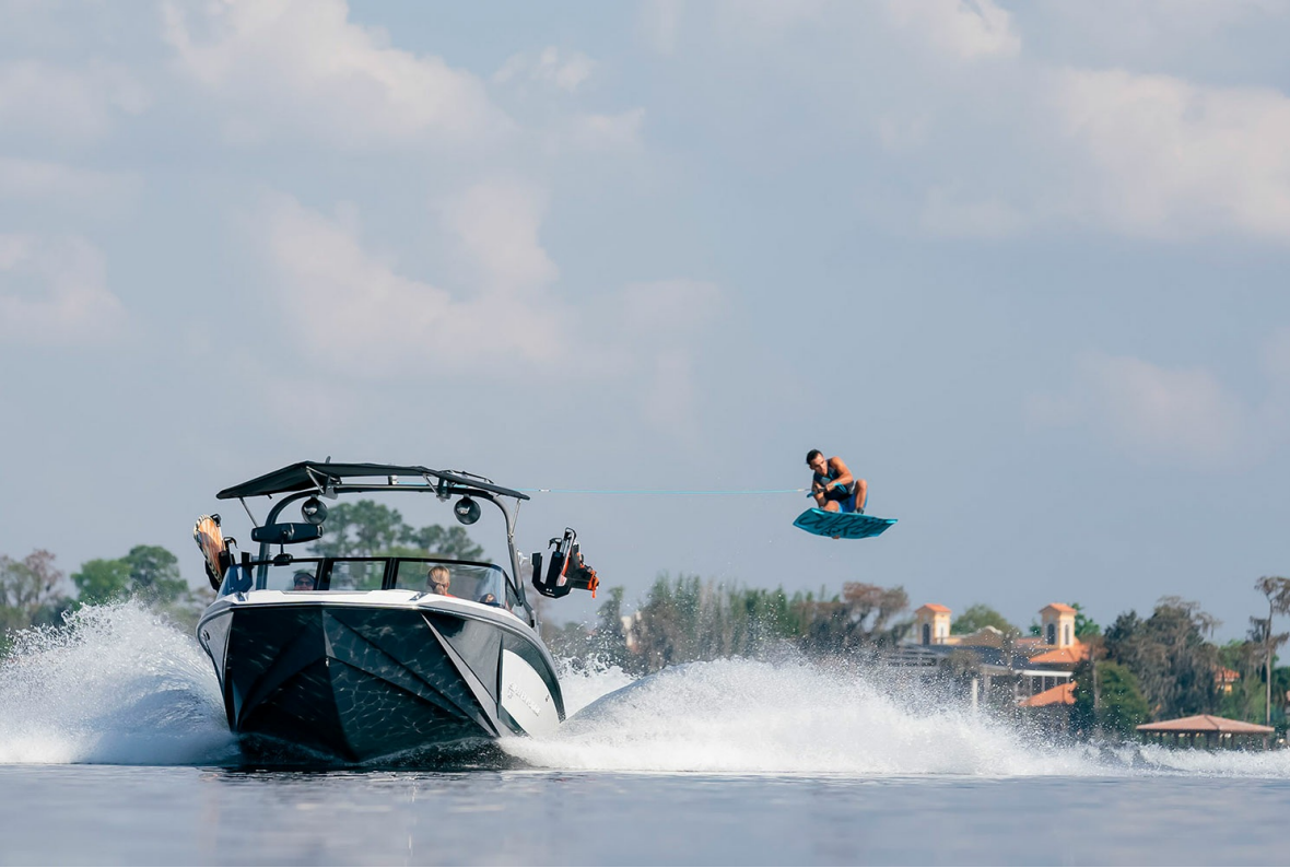
Nautique Super Air GS20