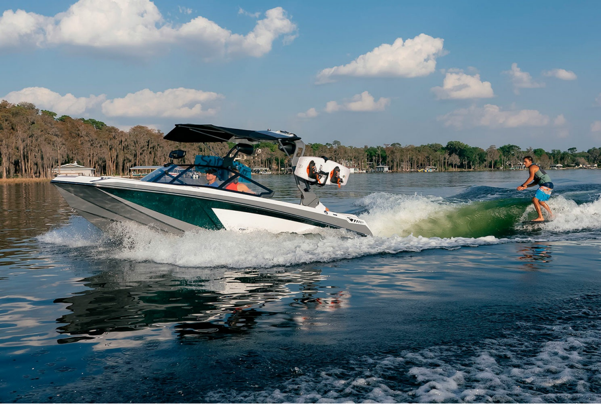
Nautique Super Air GS20