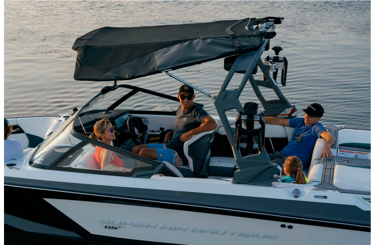
Nautique Super Air GS20