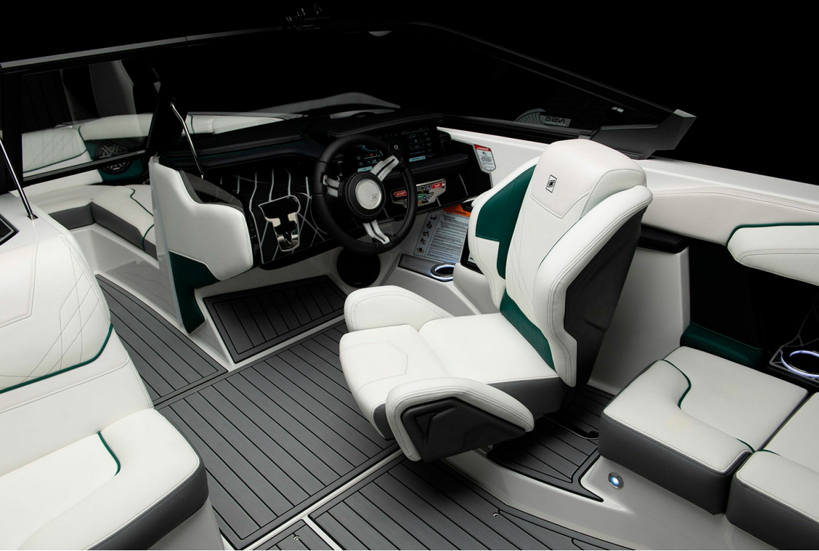
Nautique Super Air GS20