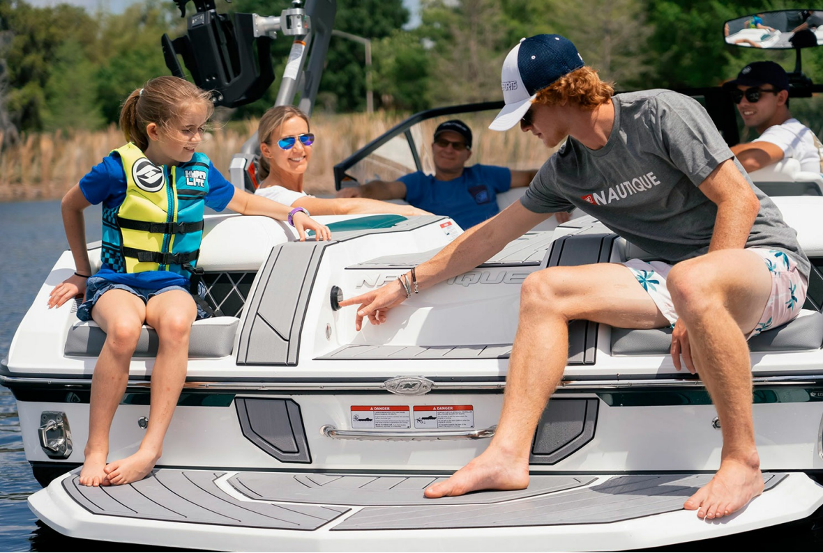
Nautique Super Air GS20