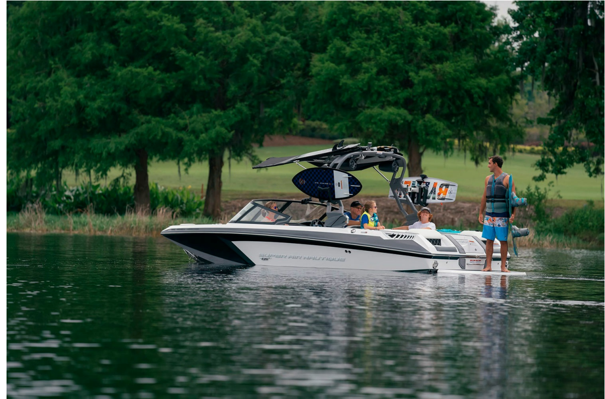
Nautique Super Air GS20