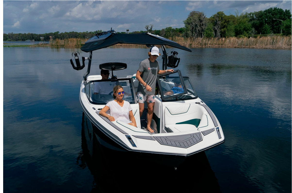
Nautique Super Air GS20