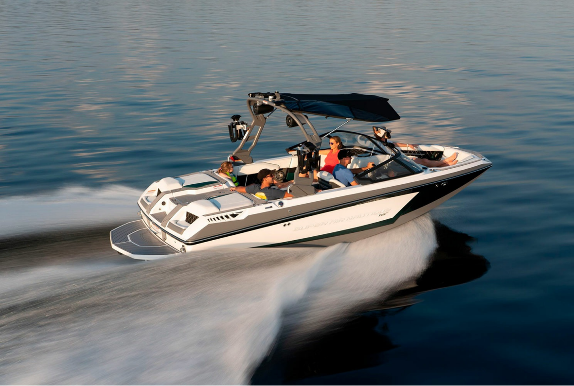
Nautique Super Air GS20