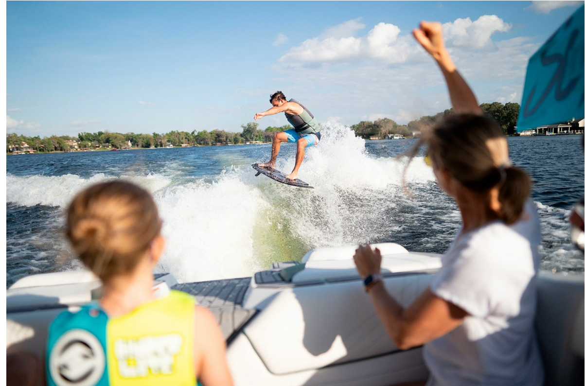
Nautique Super Air GS20