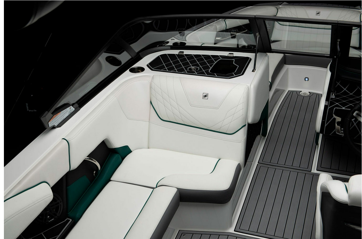
Nautique Super Air GS20