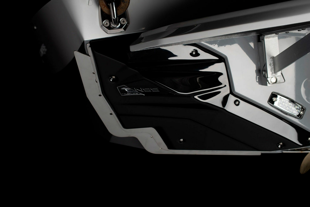
Nautique Super Air GS20