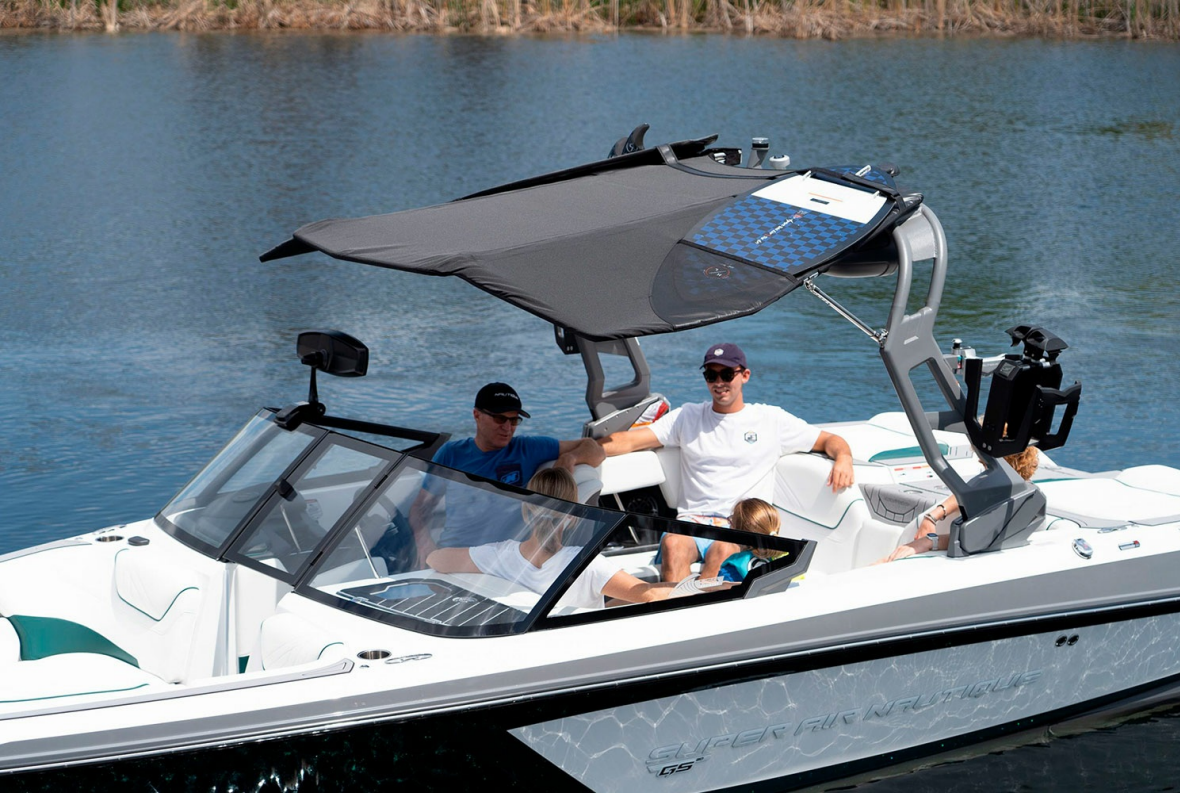
Nautique Super Air GS20