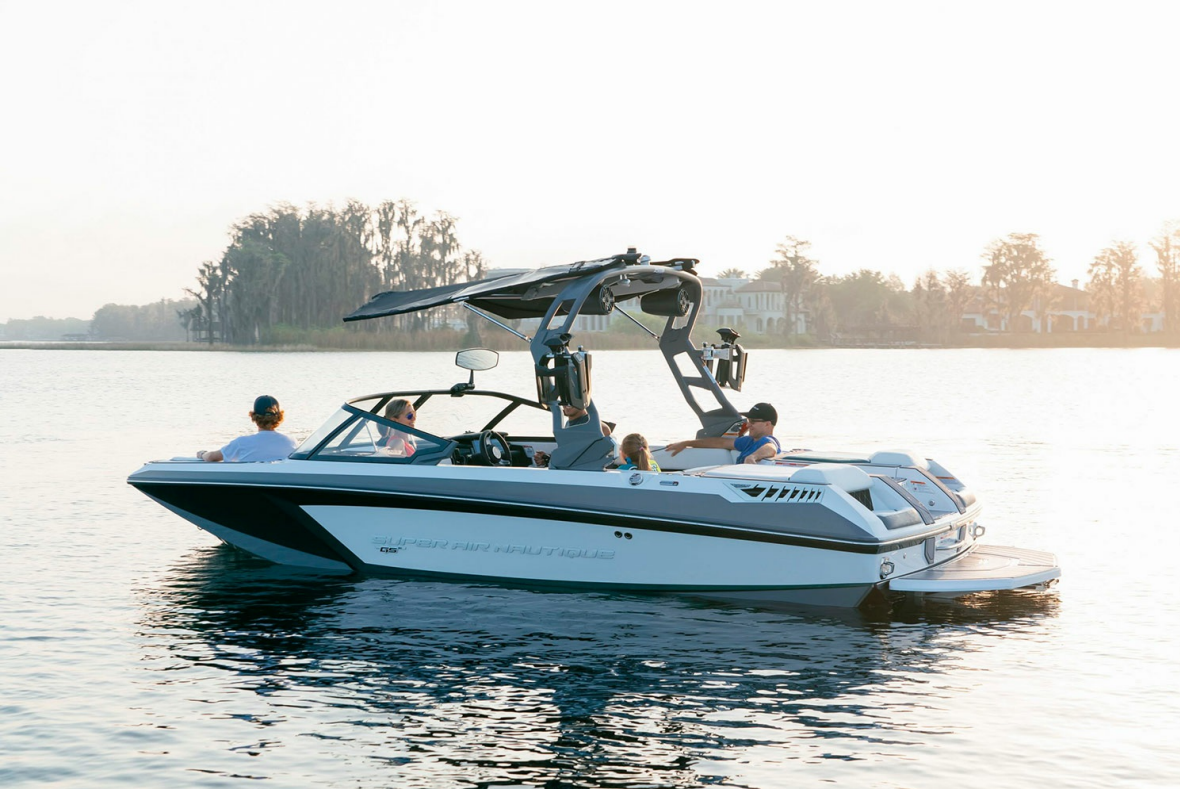
Nautique Super Air GS20