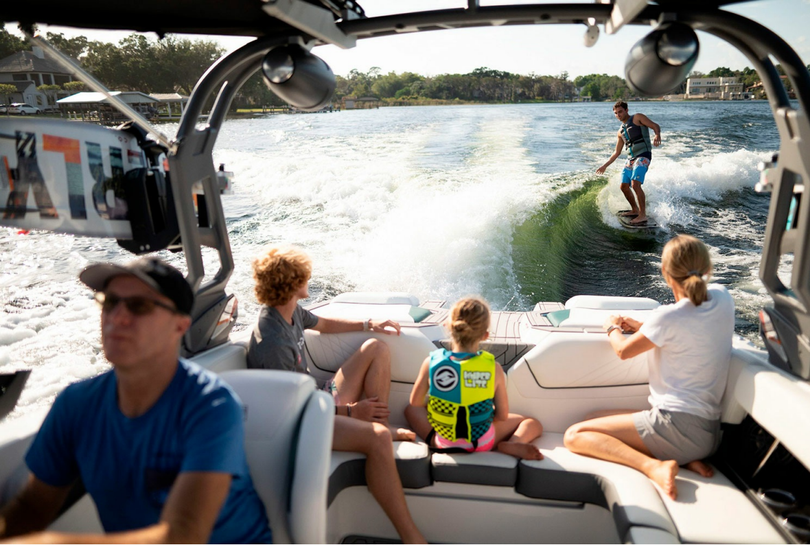
Nautique Super Air GS20