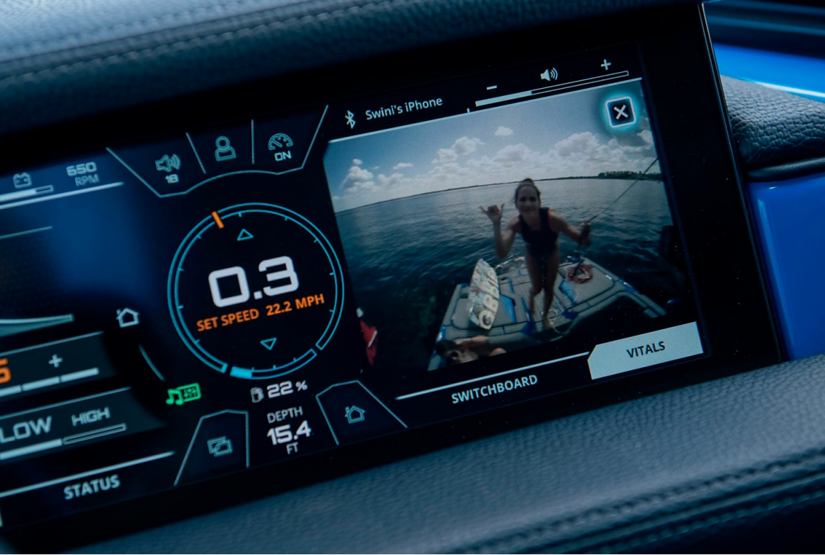
Nautique Super Air GS22