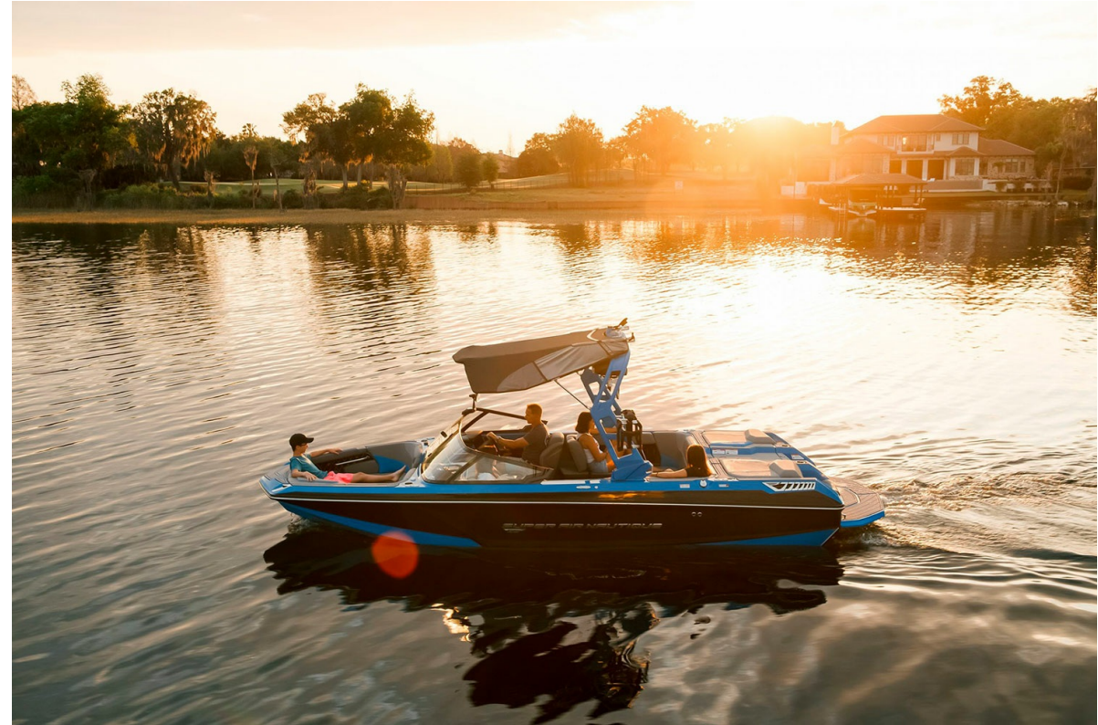
Nautique Super Air GS22