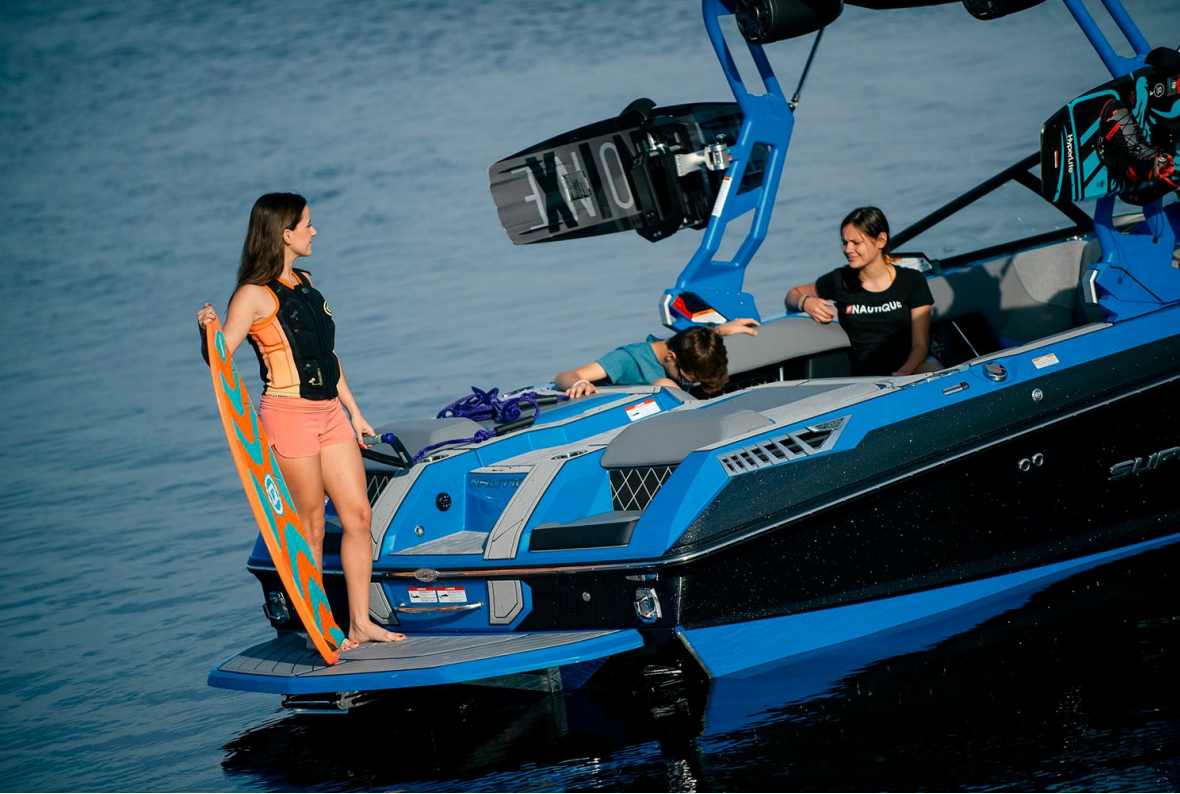
Nautique Super Air GS22