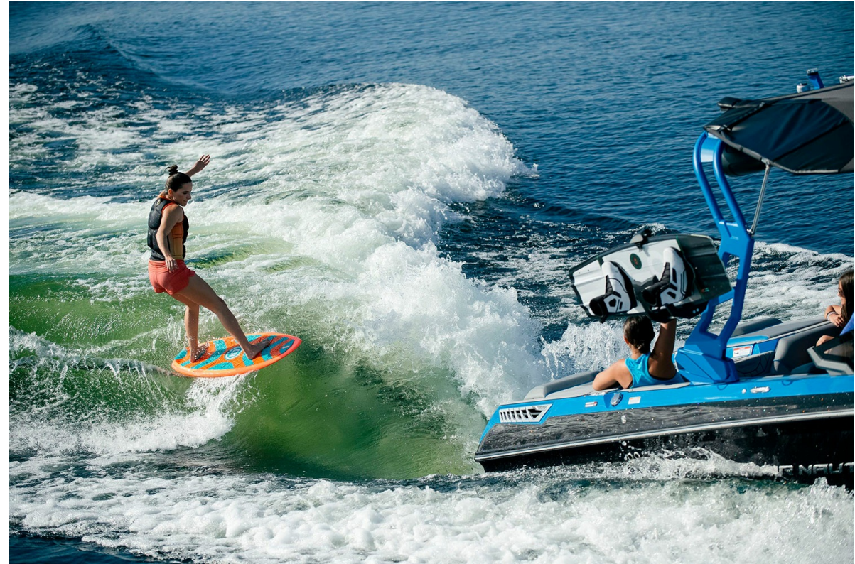
Nautique Super Air GS22