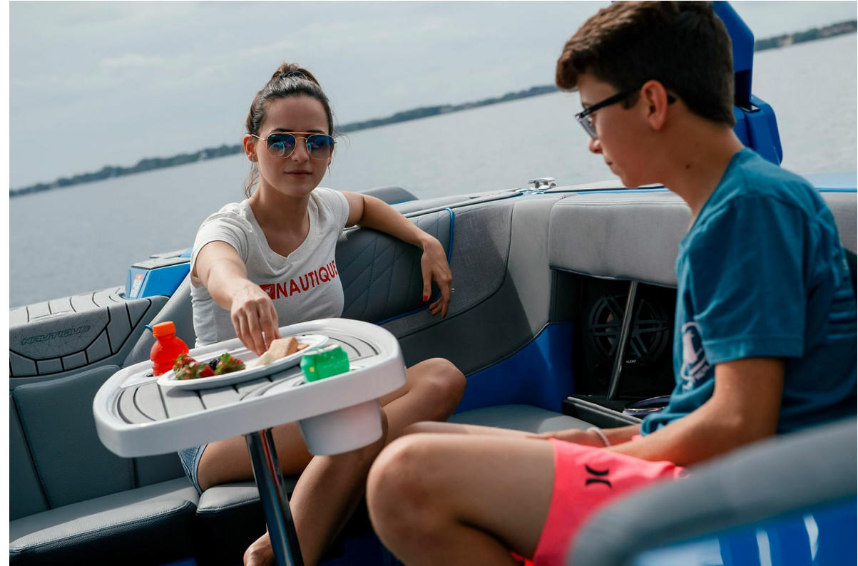
Nautique Super Air GS22