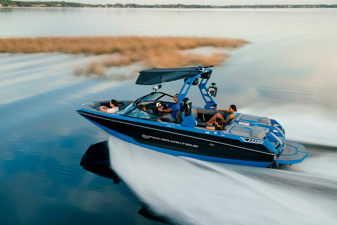
Nautique Super Air GS22