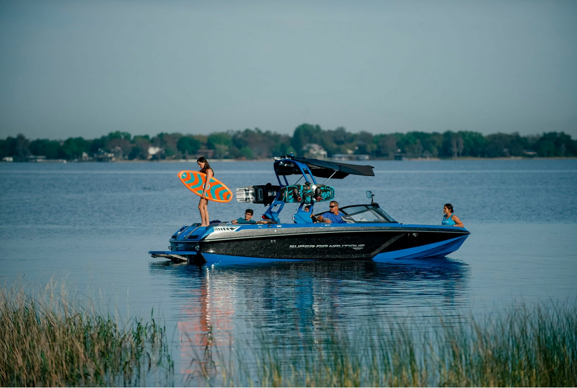
Nautique Super Air GS22