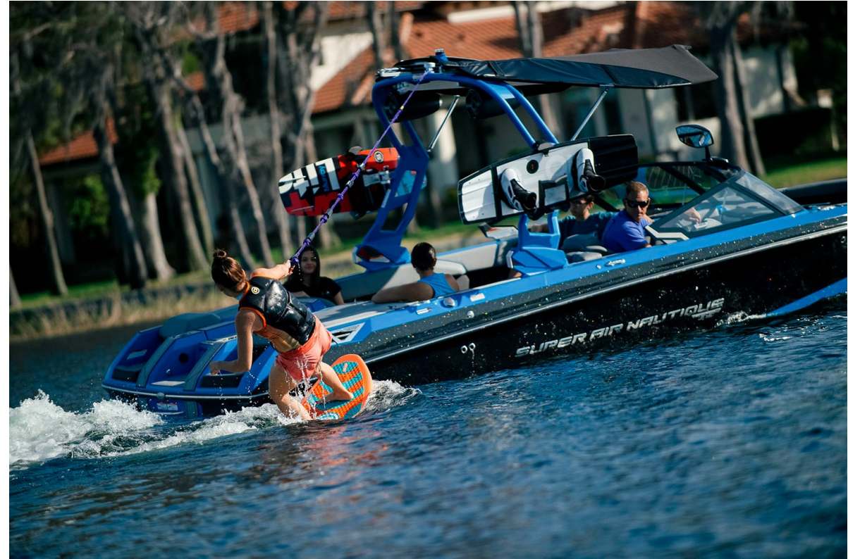
Nautique Super Air GS22