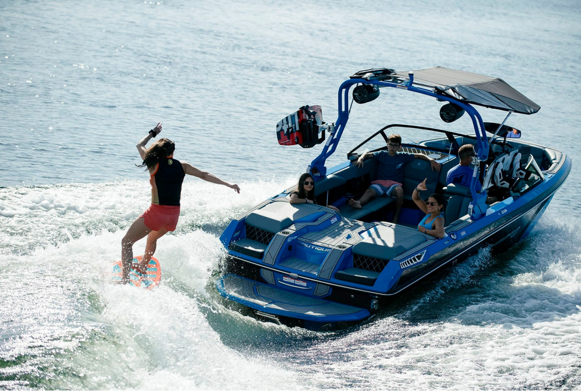
Nautique Super Air GS22