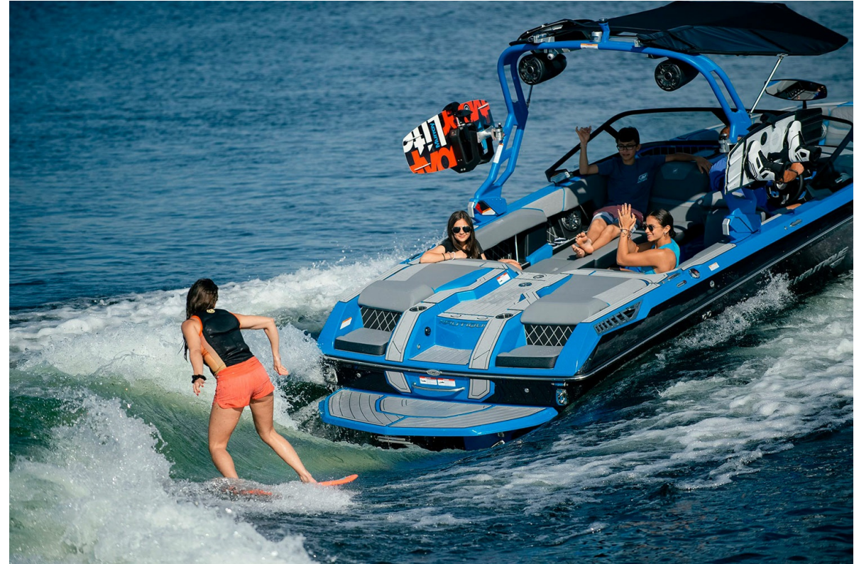
Nautique Super Air GS22