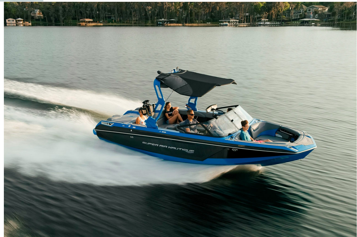
Nautique Super Air GS22