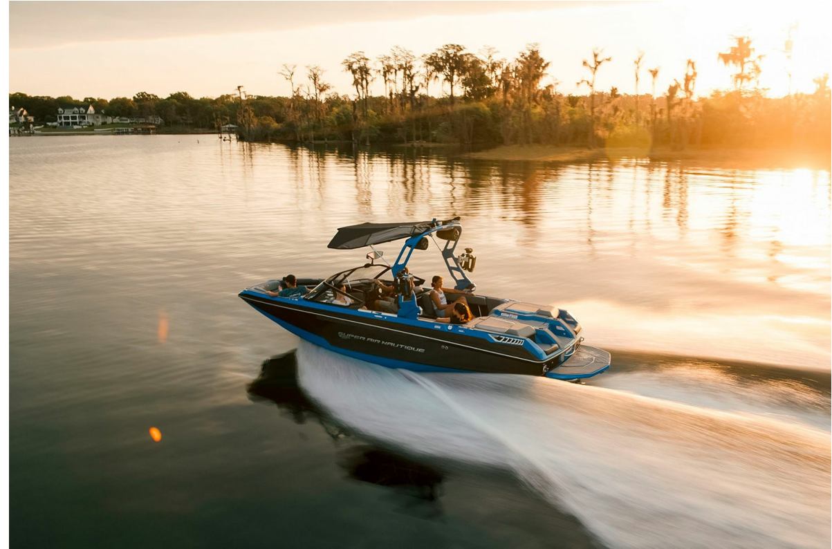
Nautique Super Air GS22