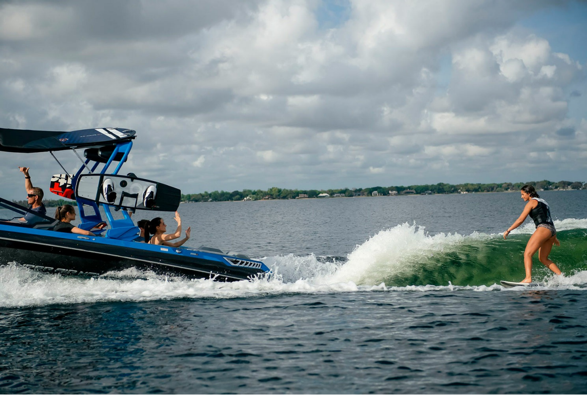
Nautique Super Air GS22