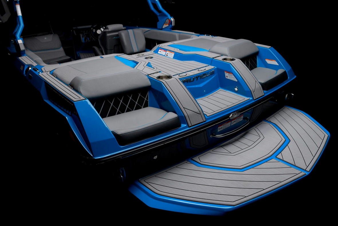
Nautique Super Air GS22