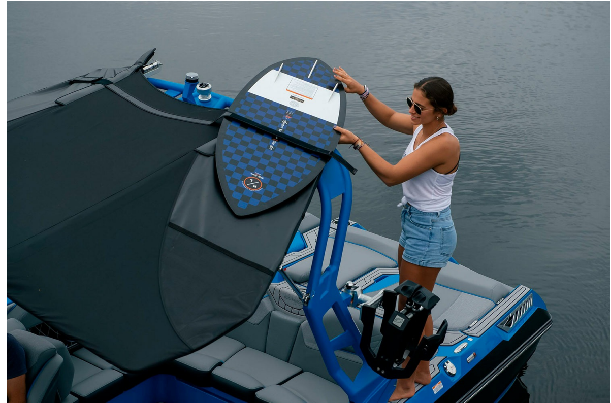
Nautique Super Air GS22