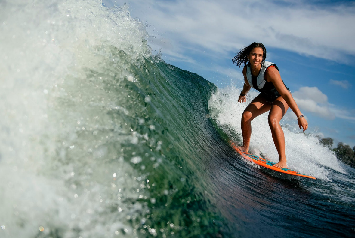
Nautique Super Air GS22