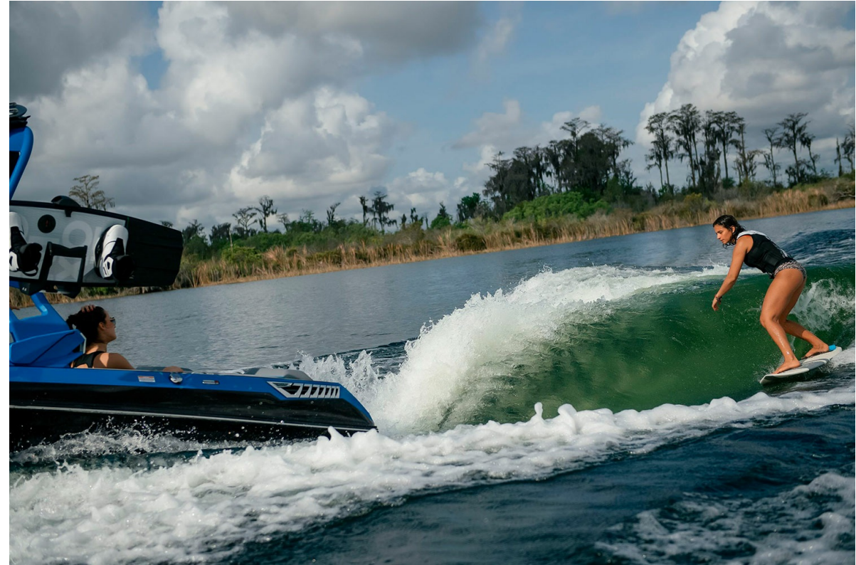
Nautique Super Air GS22