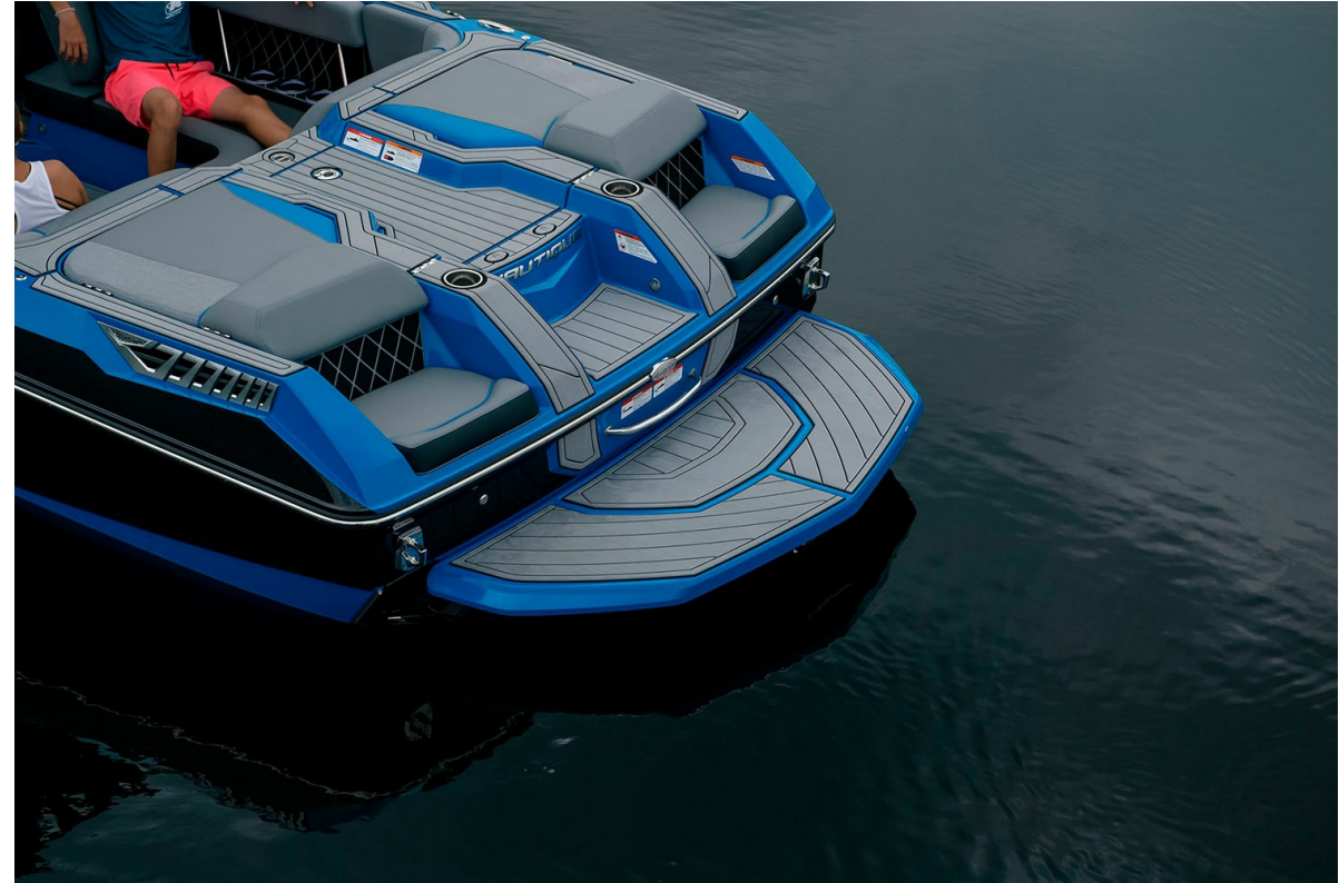
Nautique Super Air GS22