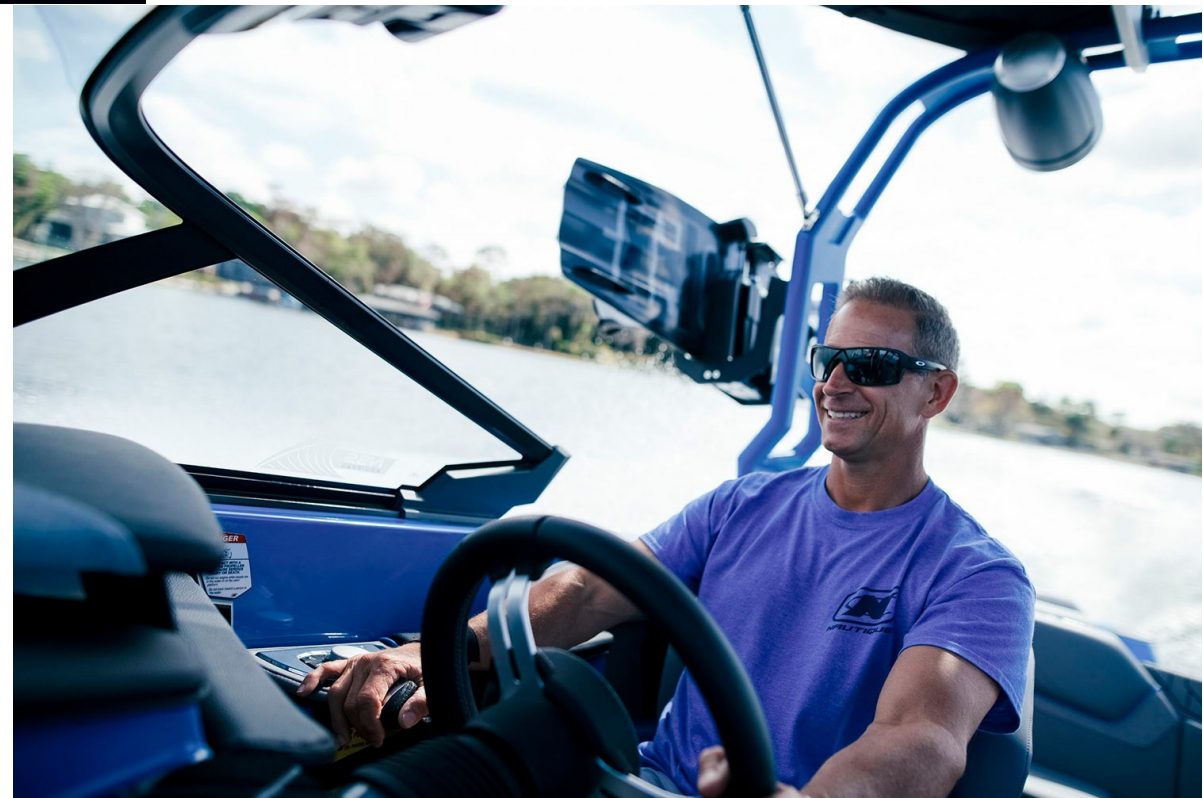
Nautique Super Air GS22