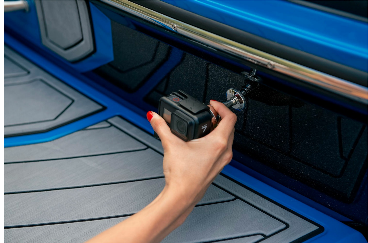
Nautique Super Air GS22