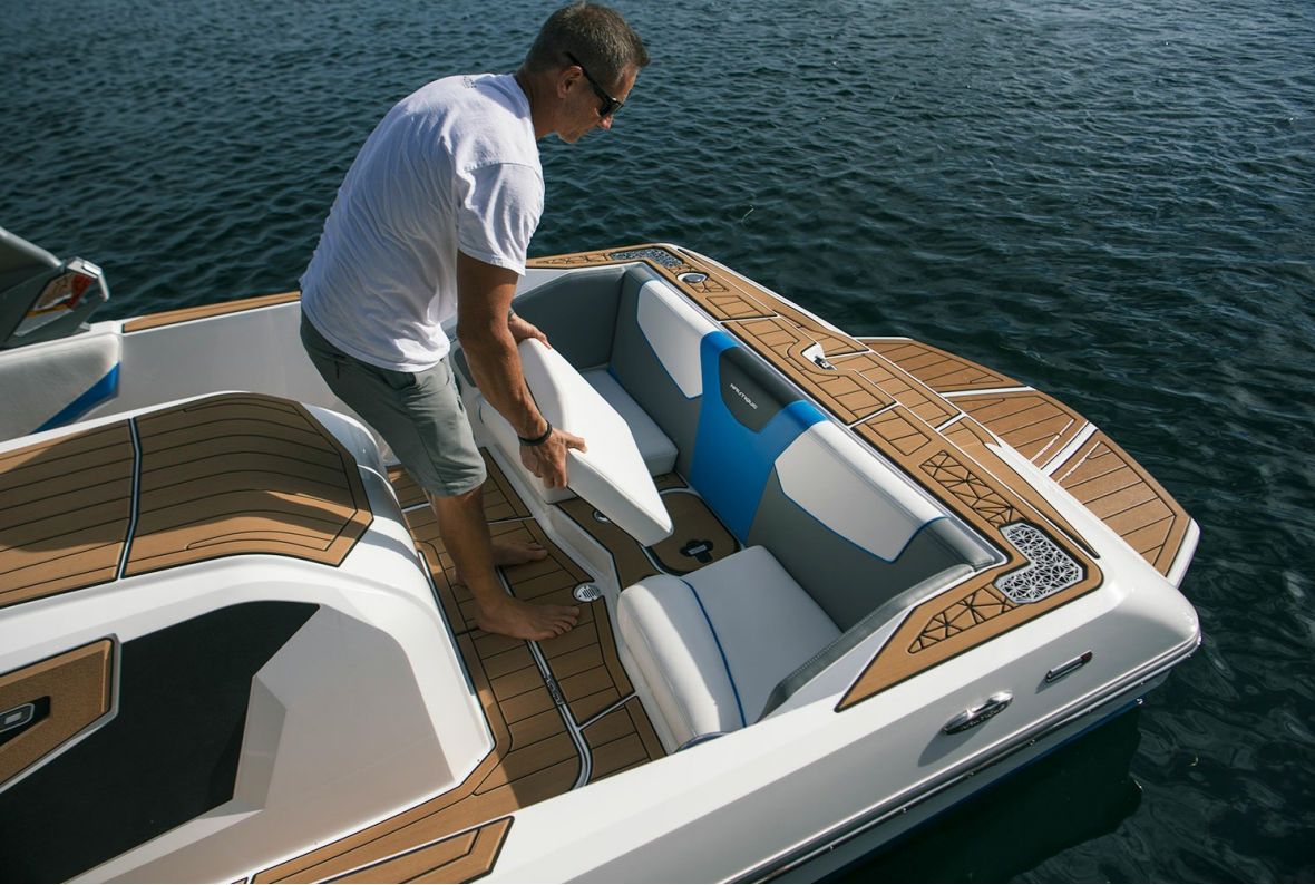
Nautique Ski 200