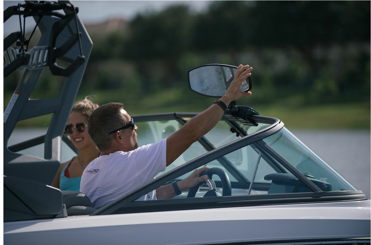
Nautique Ski 200