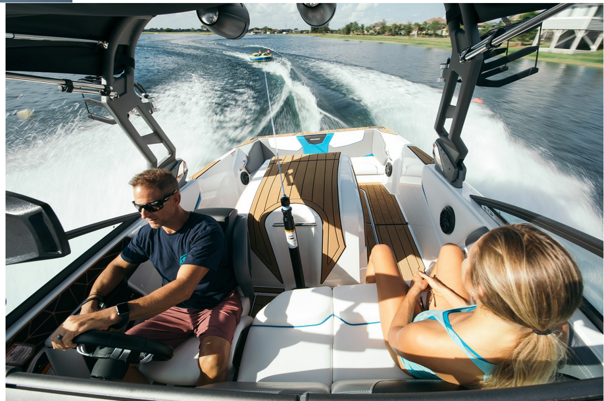
Nautique Ski 200