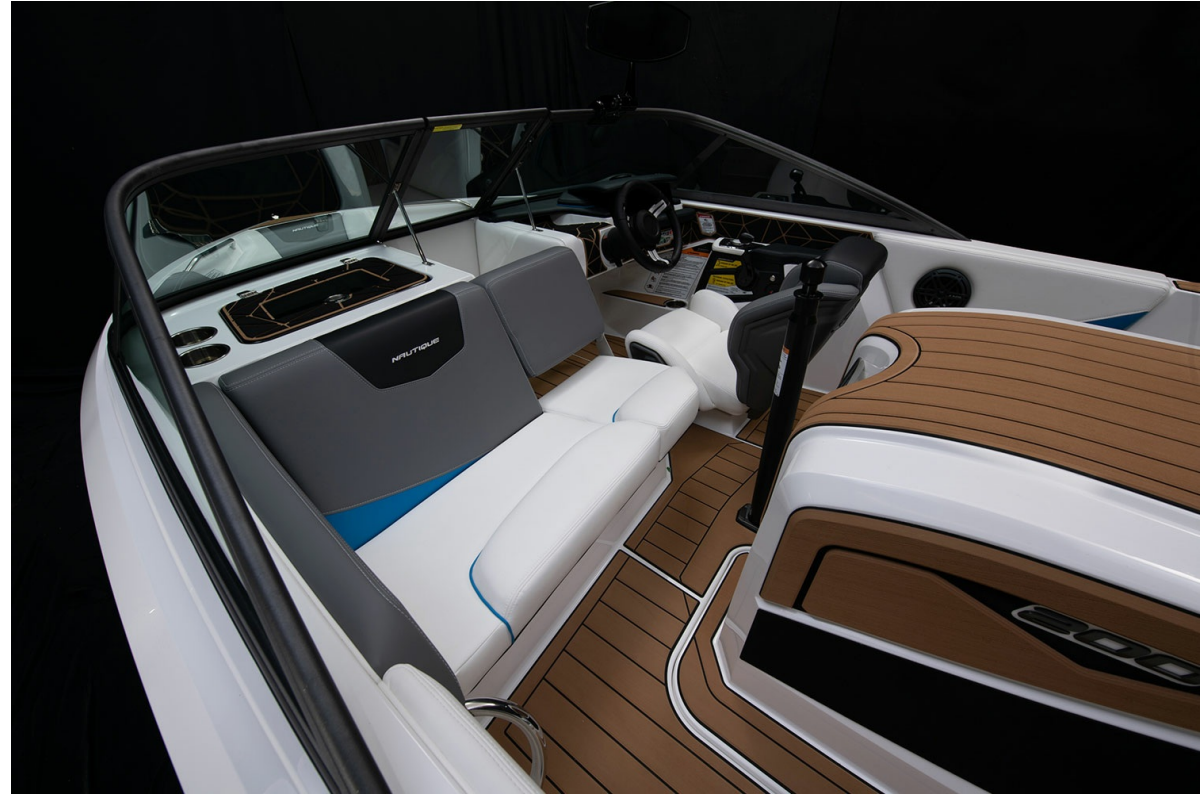
Nautique Ski 200