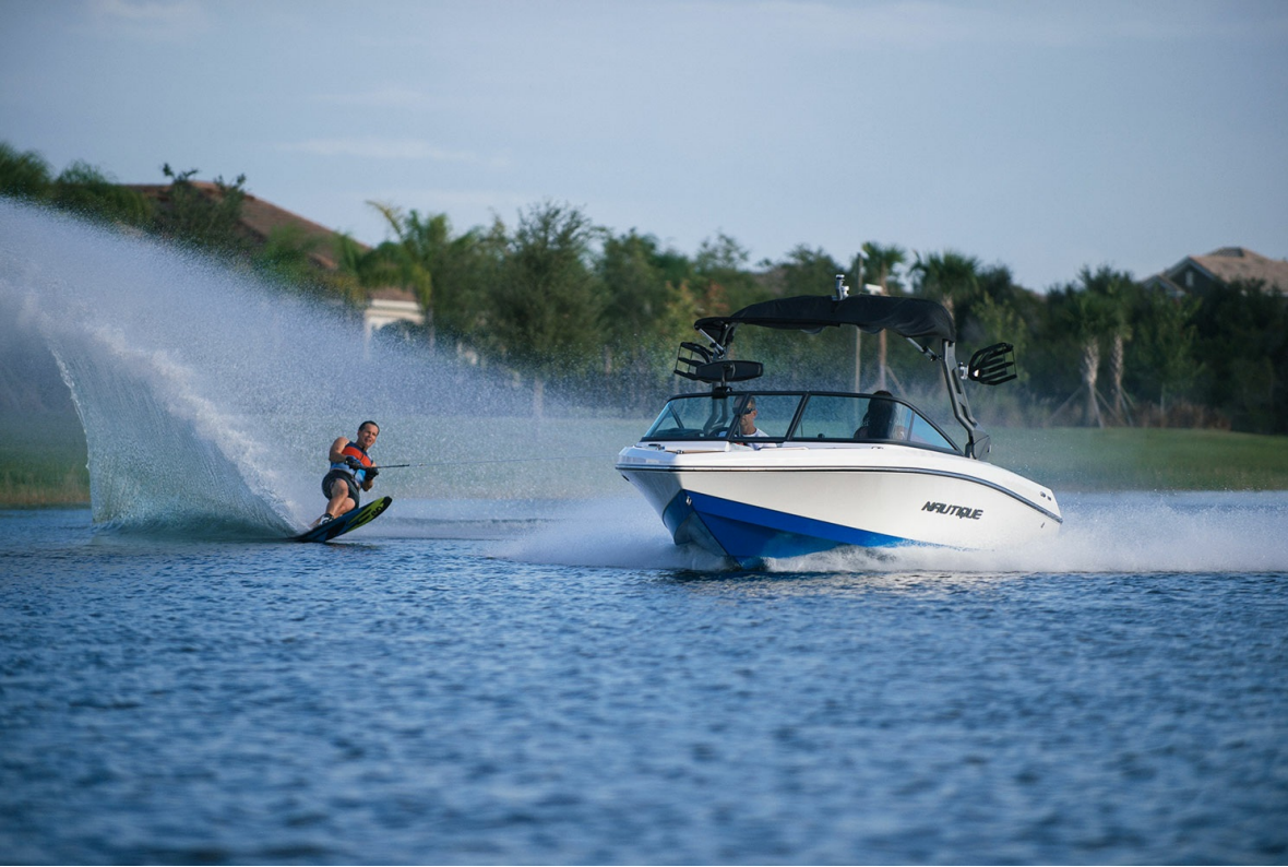
Nautique Ski 200