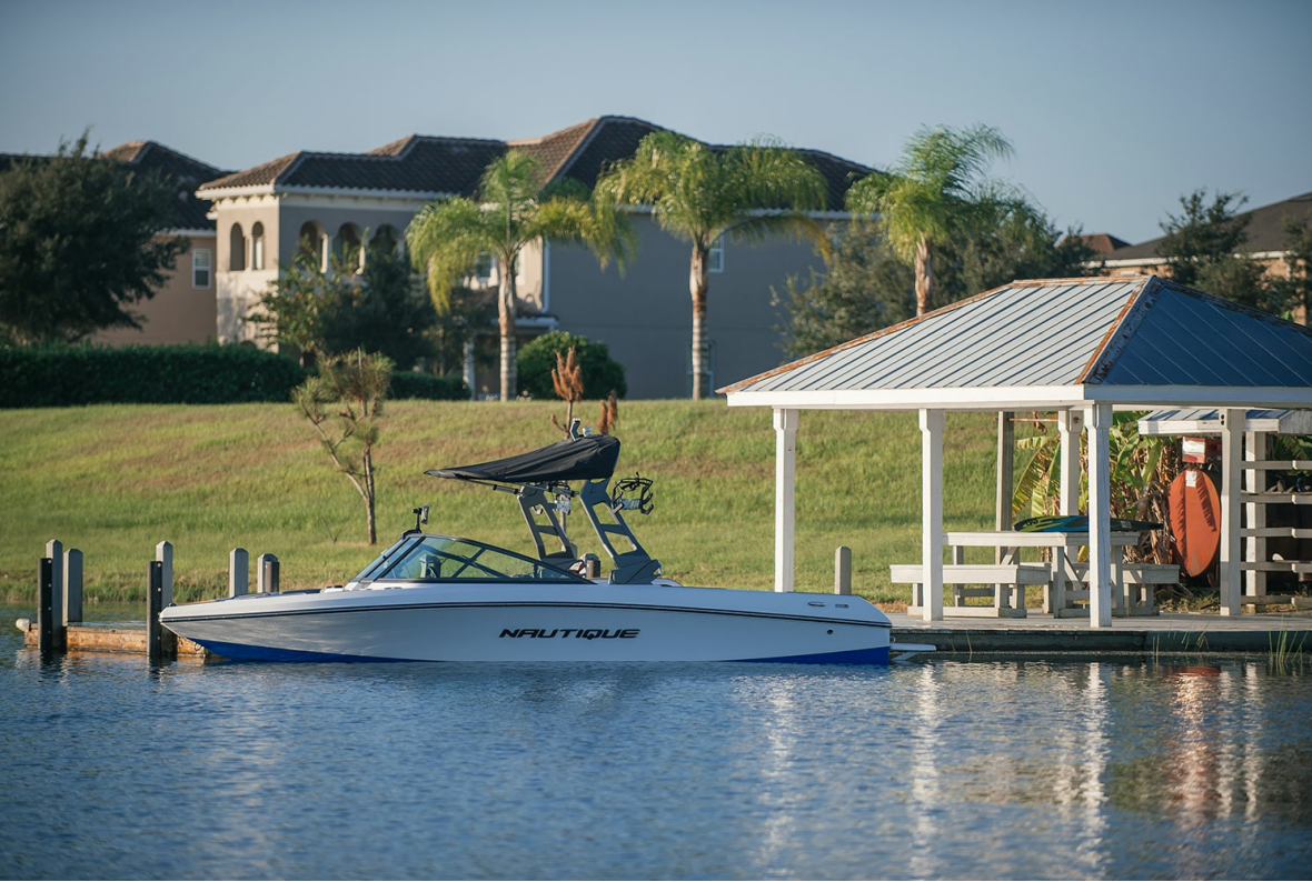
Nautique Ski 200