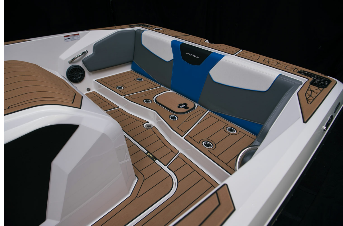
Nautique Ski 200