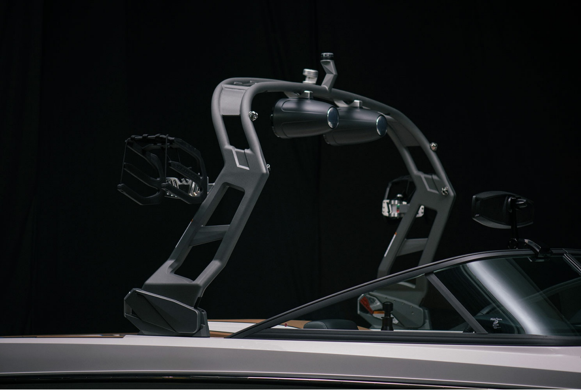
Nautique Ski 200