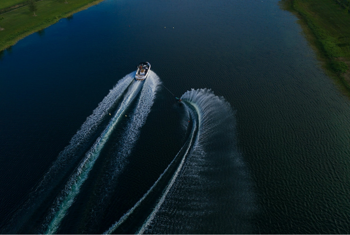
Nautique Ski 200