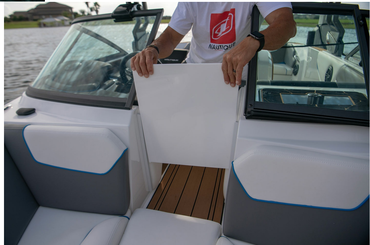
Nautique Ski 200