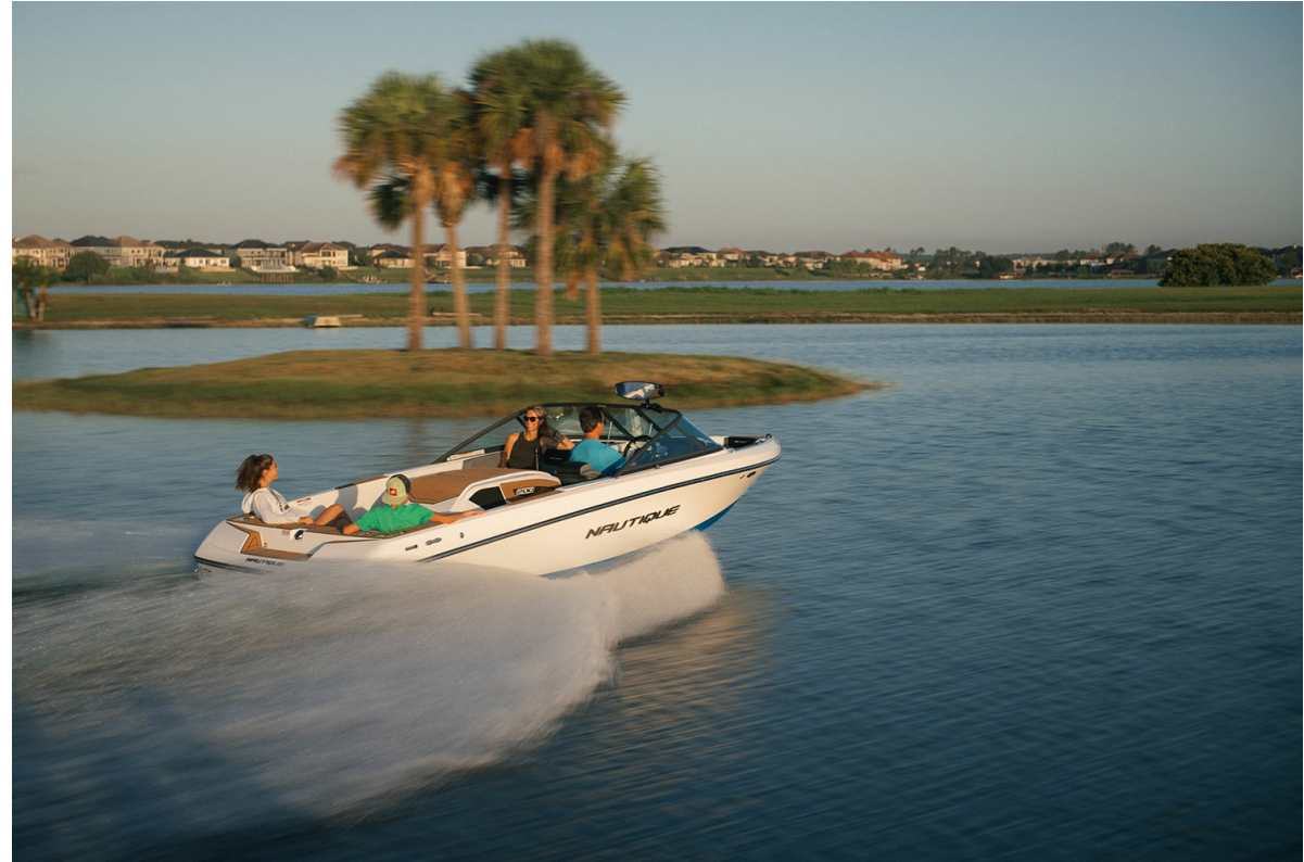
Nautique Ski 200