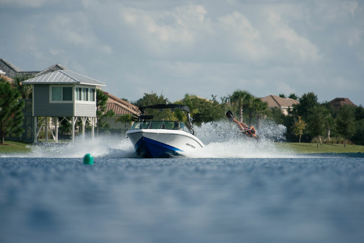
Nautique Ski 200