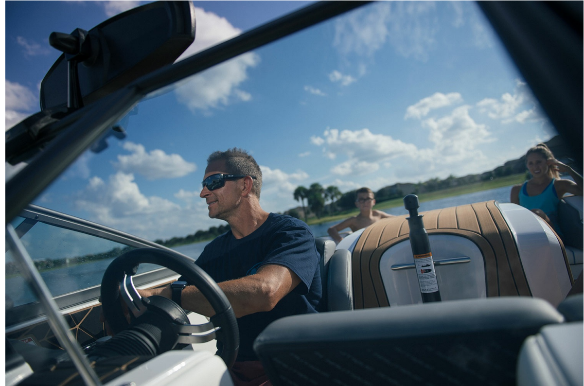
Nautique Ski 200