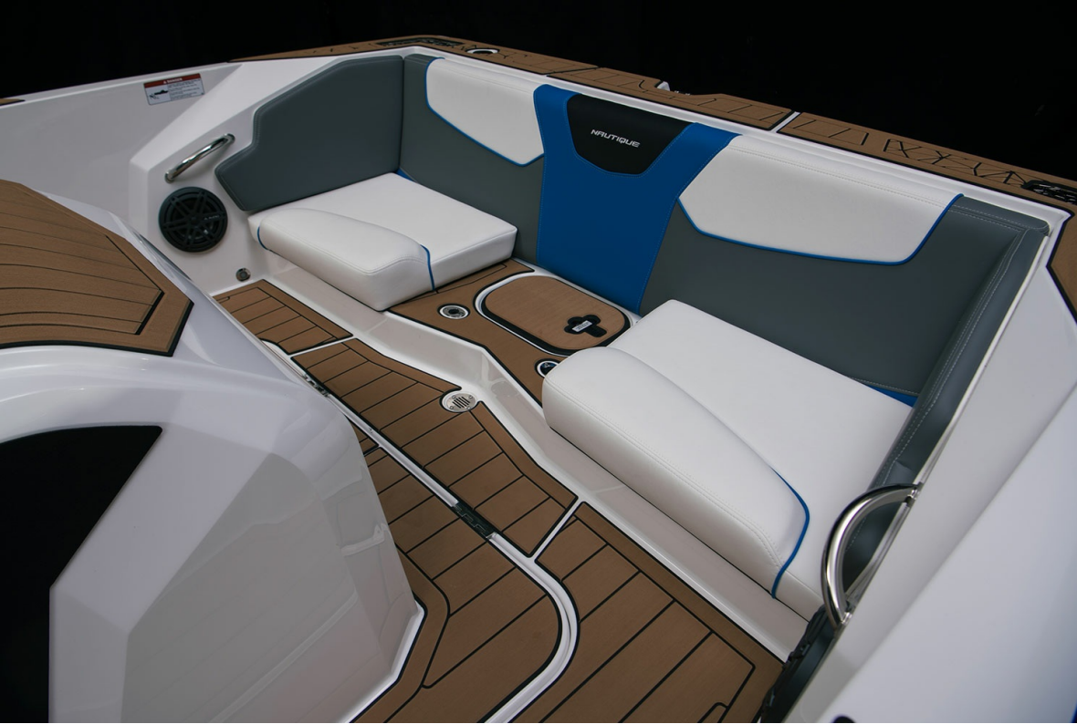
Nautique Ski 200