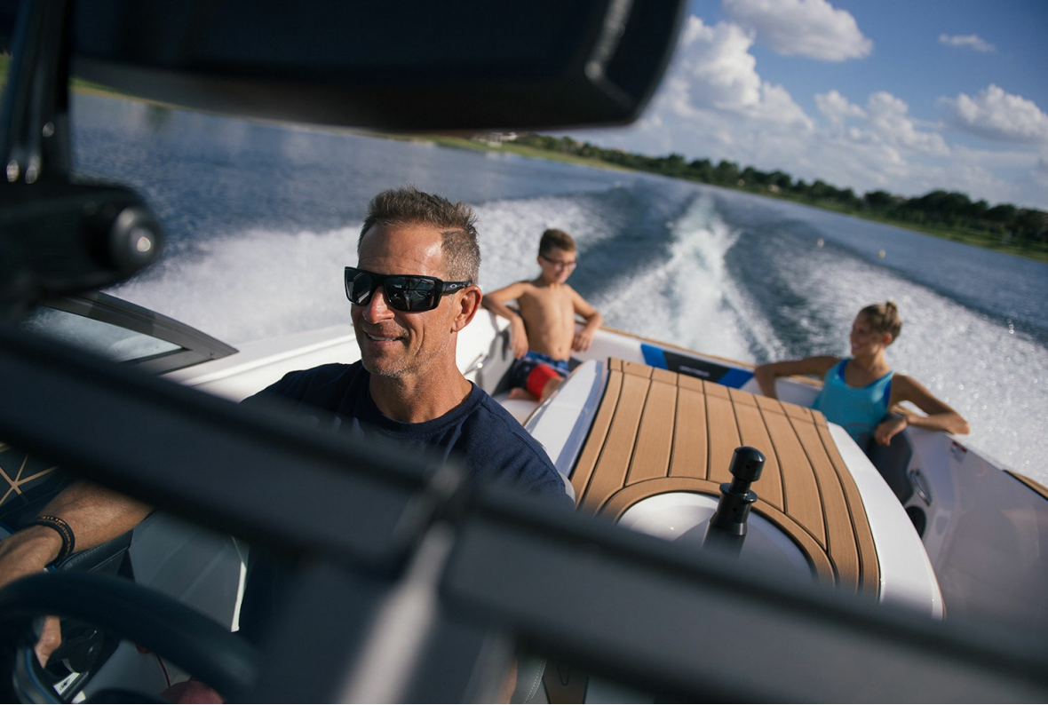
Nautique Ski 200