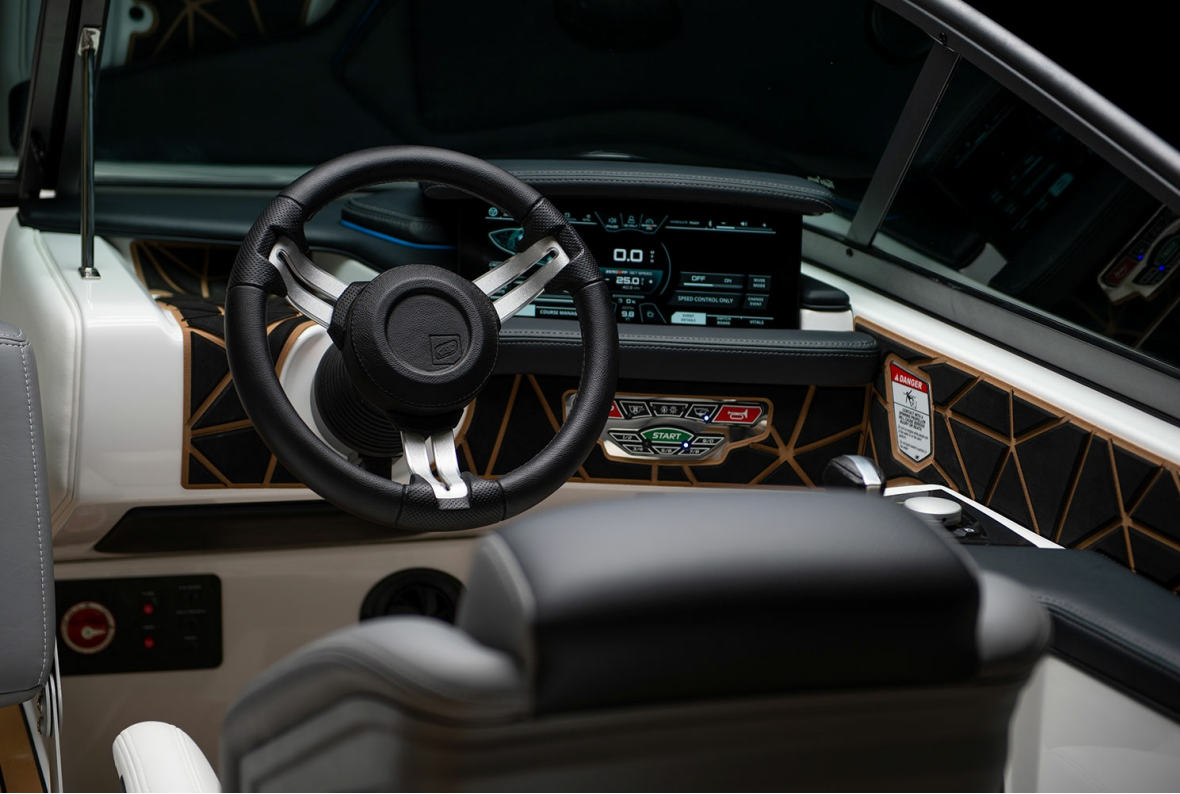
Nautique Ski 200