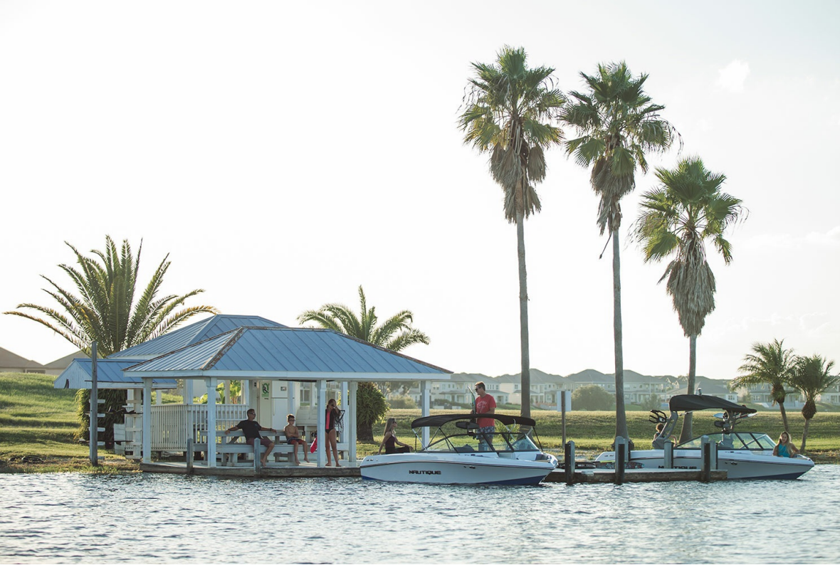
Nautique Ski 200