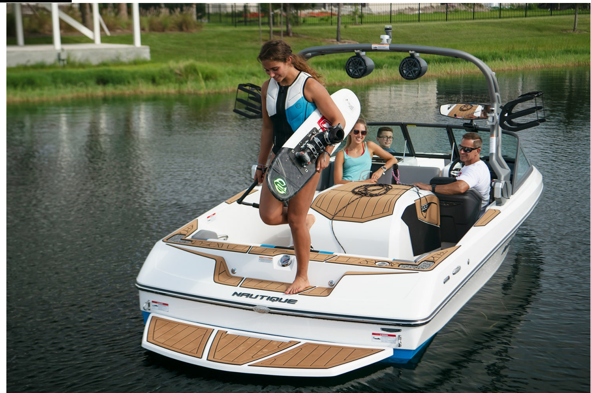
Nautique Ski 200