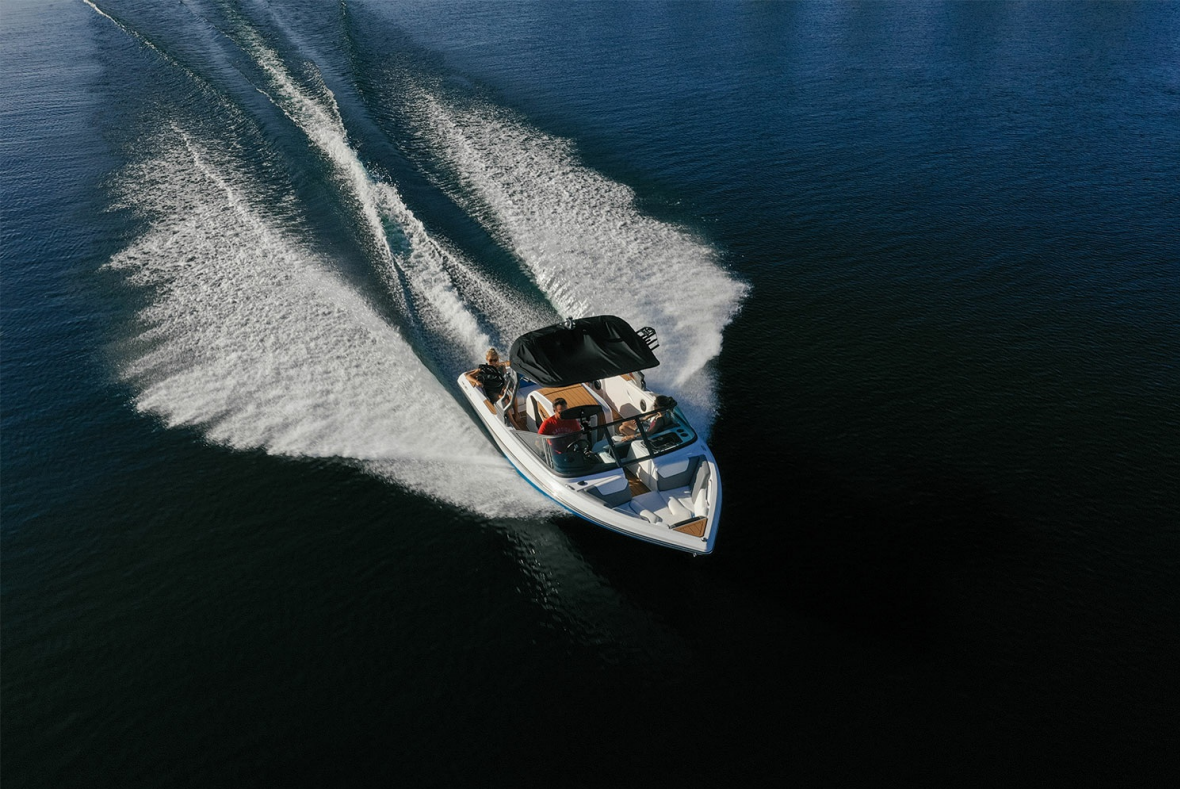
Nautique Ski 200