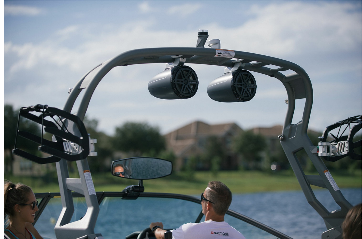
Nautique Ski 200