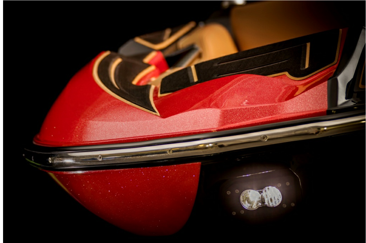
Centurion Fi 21