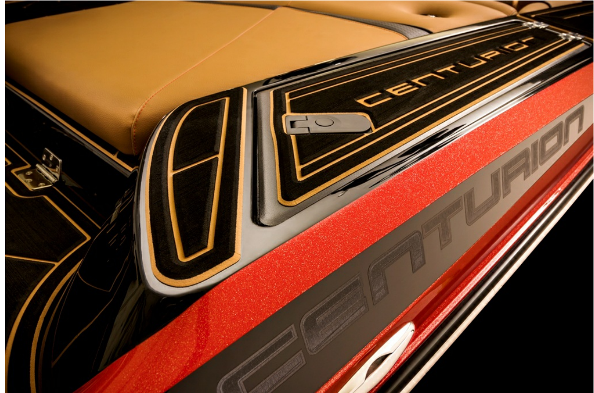
Centurion Fi 21