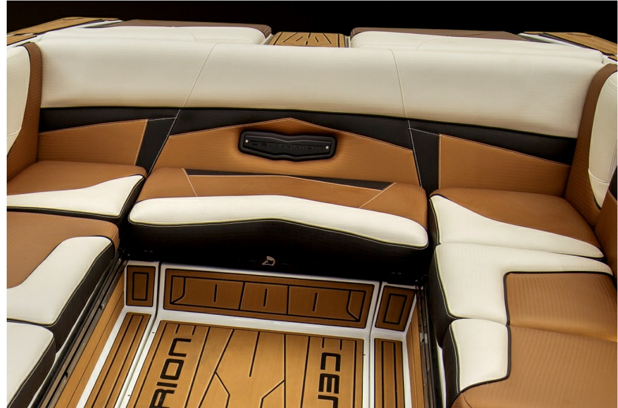
Centurion Fi 21