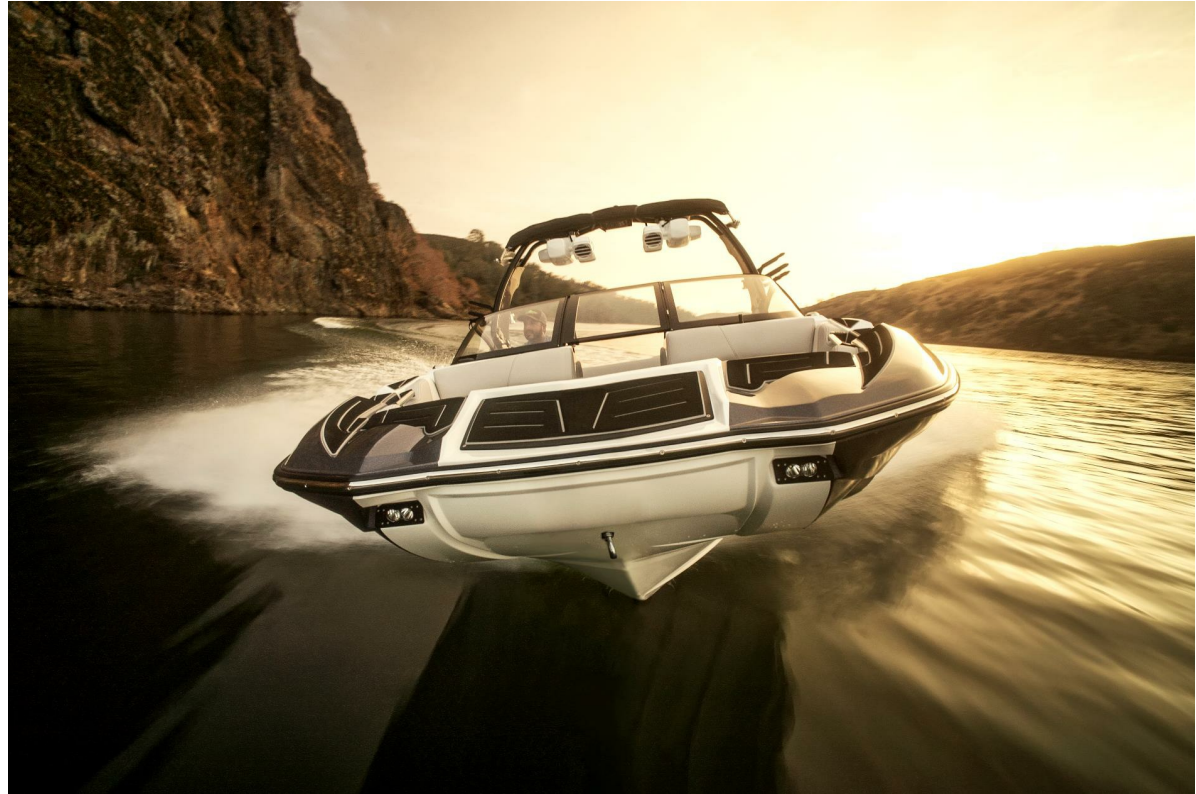
Centurion Fi 21