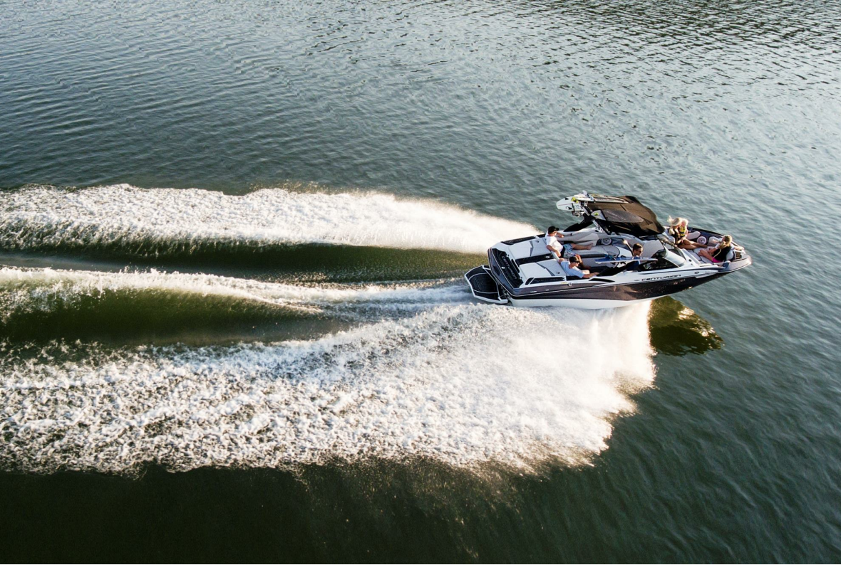
Centurion Fi 21