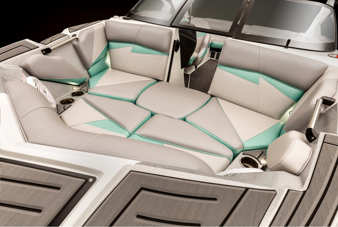
Centurion Fi 21