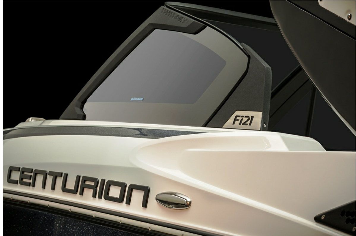
Centurion Fi 21