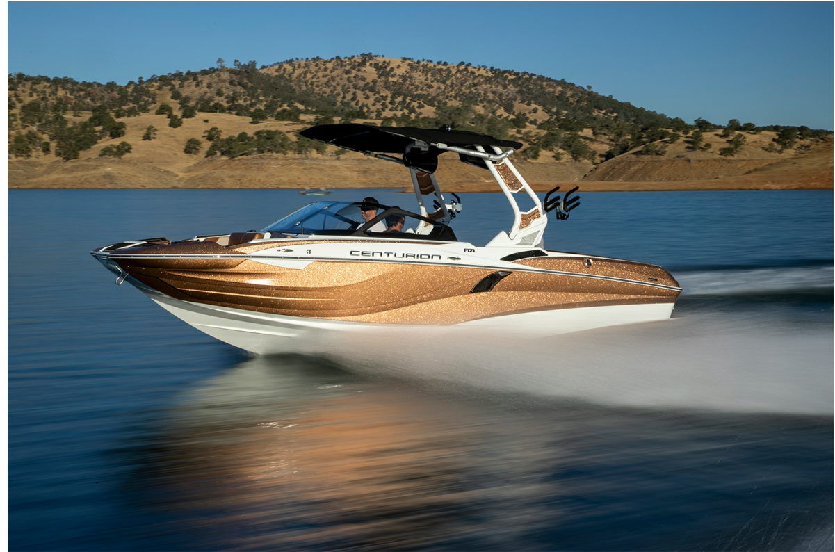
Centurion Fi 21