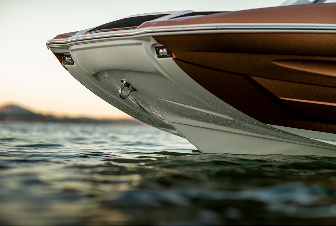
Centurion Fi 21