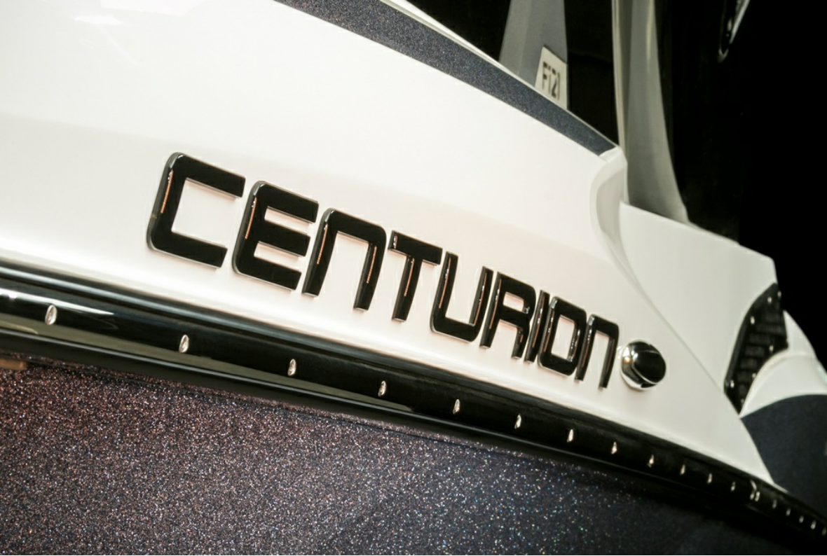
Centurion Fi 21