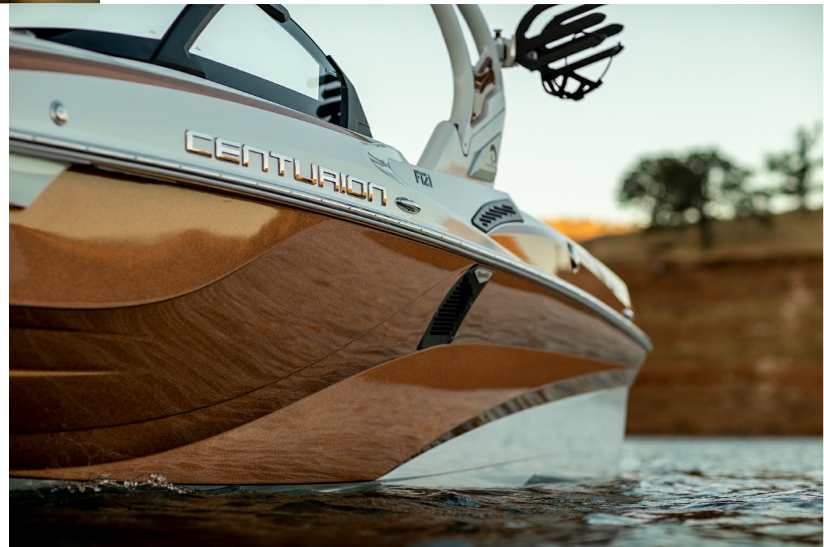
Centurion Fi 21