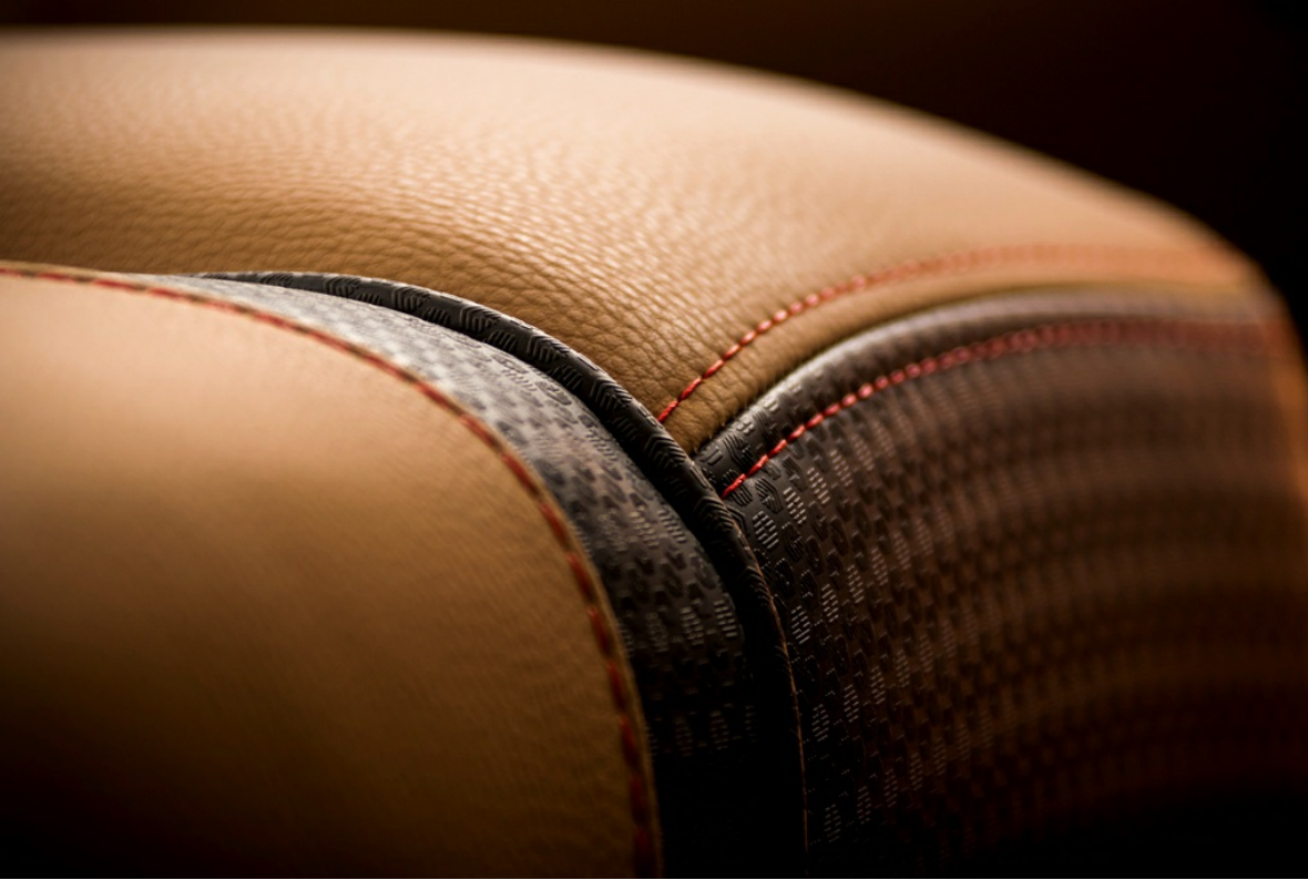
Centurion Fi 21