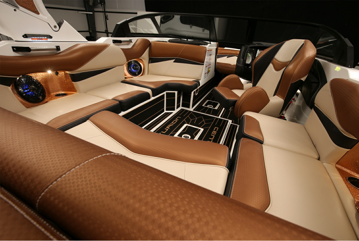
Centurion Fi 21