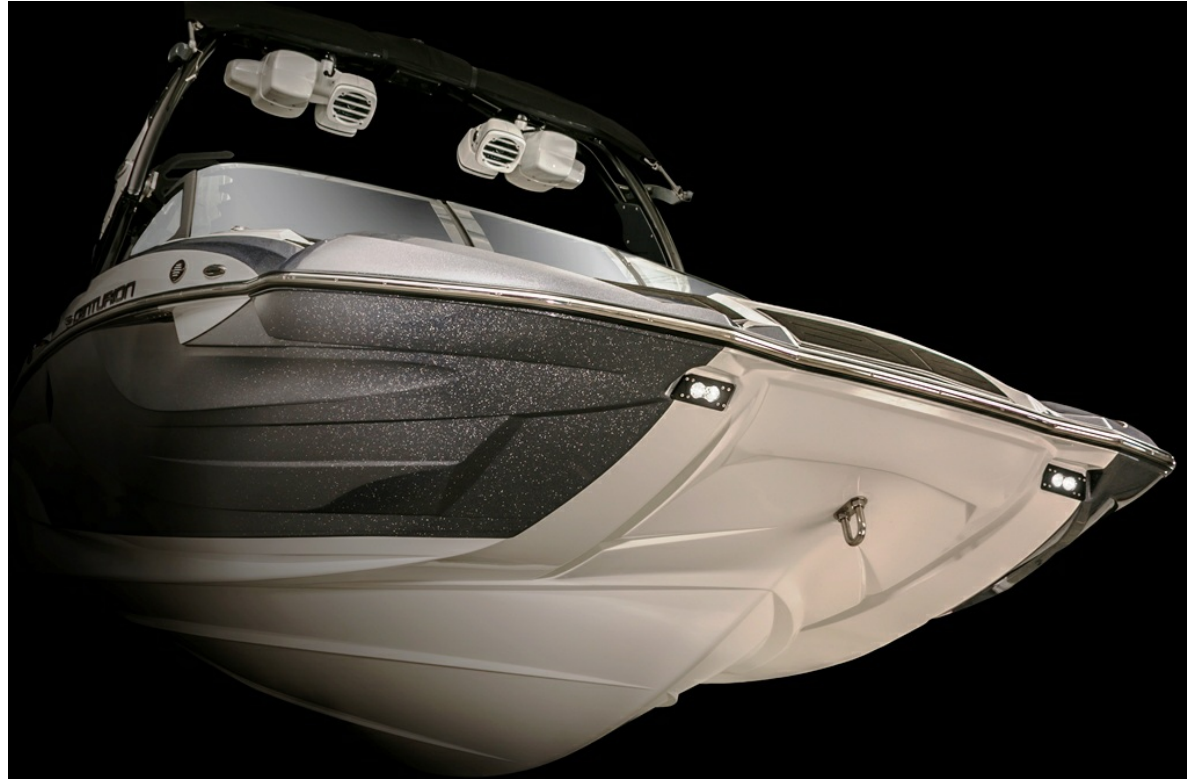
Centurion Fi 21