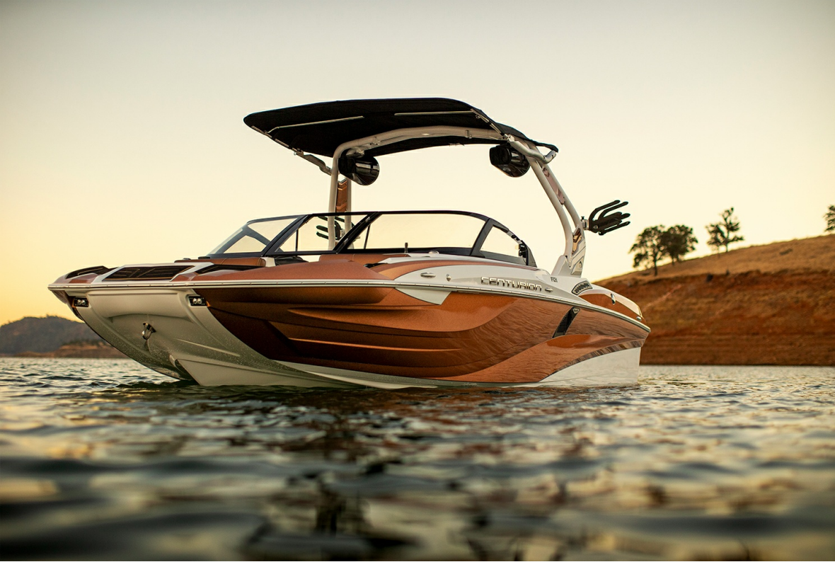
Centurion Fi 21