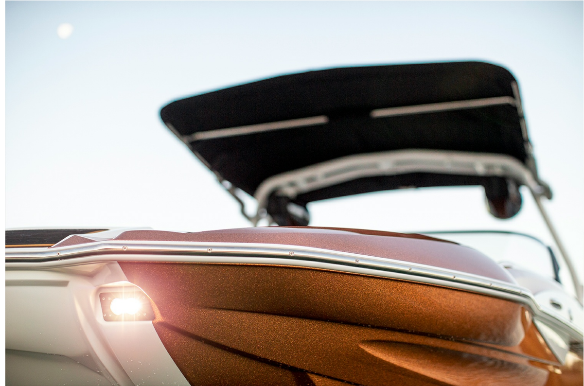
Centurion Fi 21