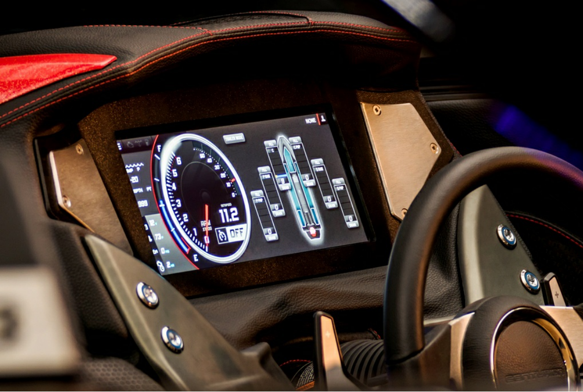
Centurion Fi 21