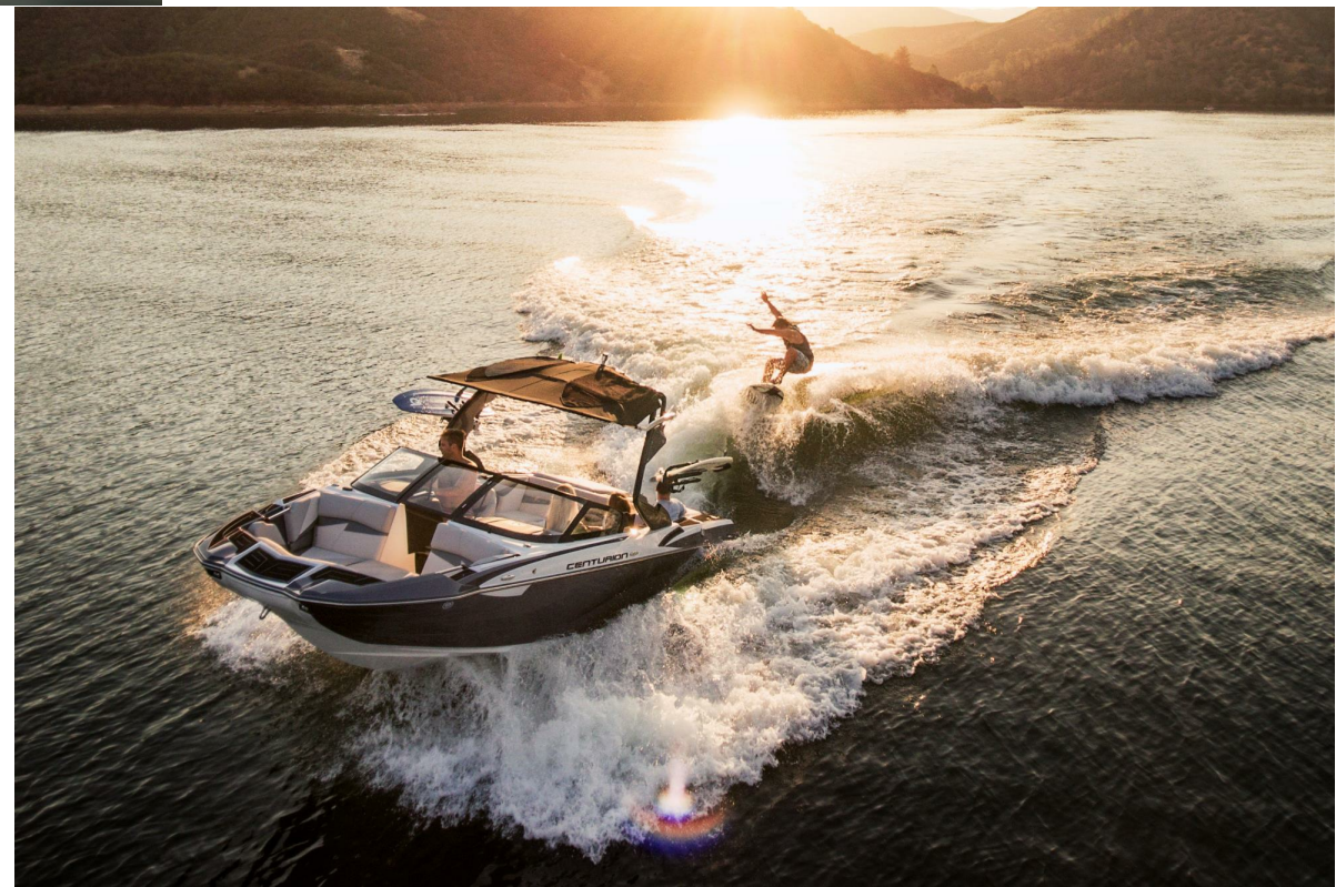
Centurion Fi 21