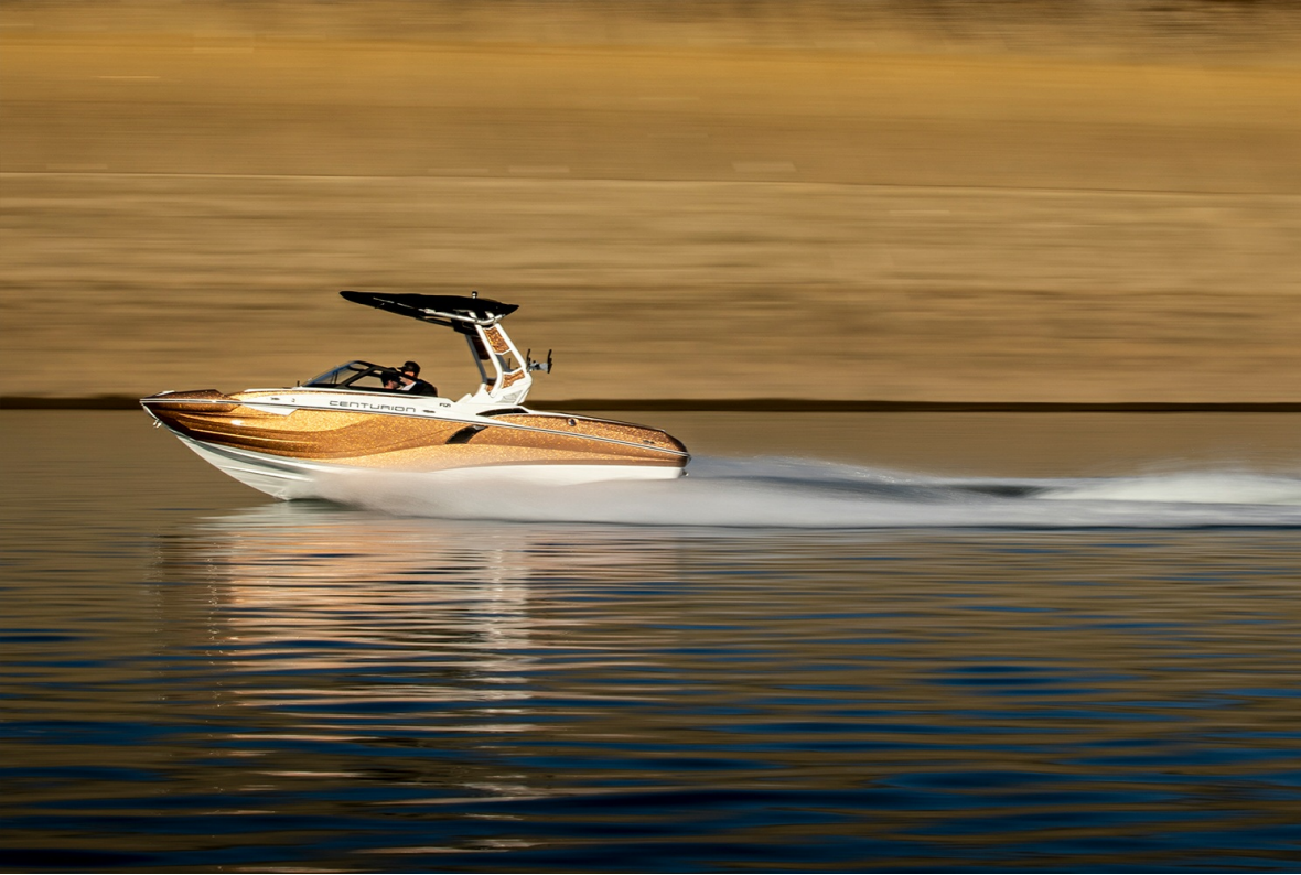
Centurion Fi 21