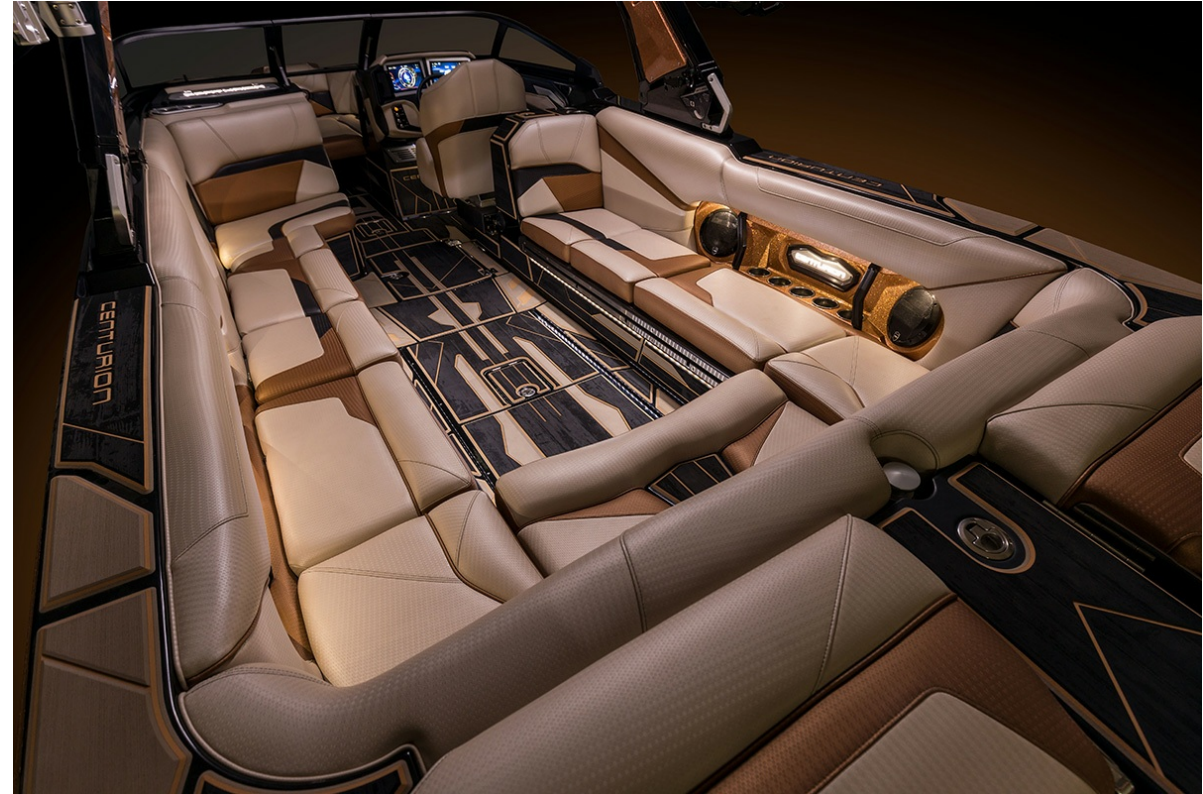
Centurion Ri 265