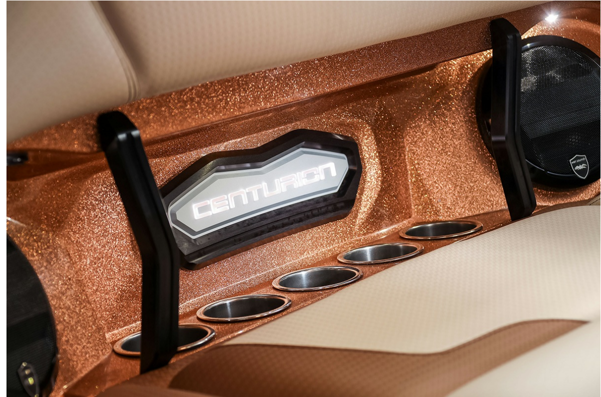
Centurion Ri 265