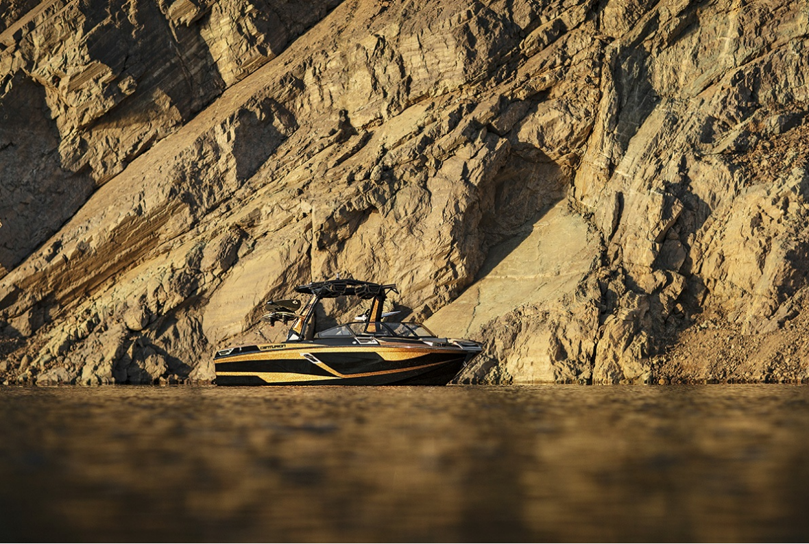
Centurion Ri 265