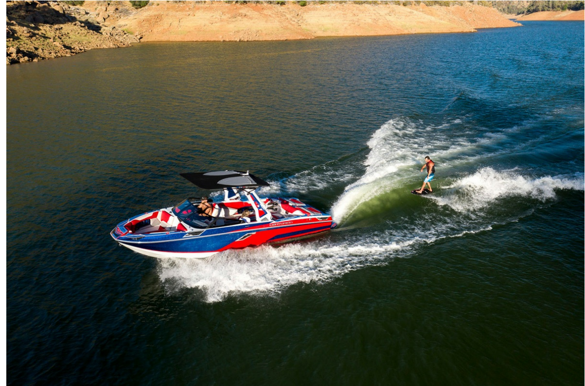
Centurion Ri 265