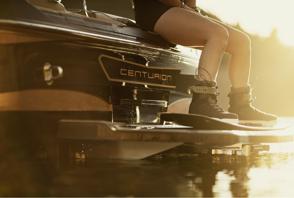
Centurion Ri 265