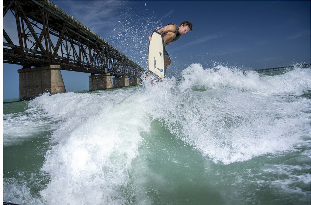
Centurion Ri 265