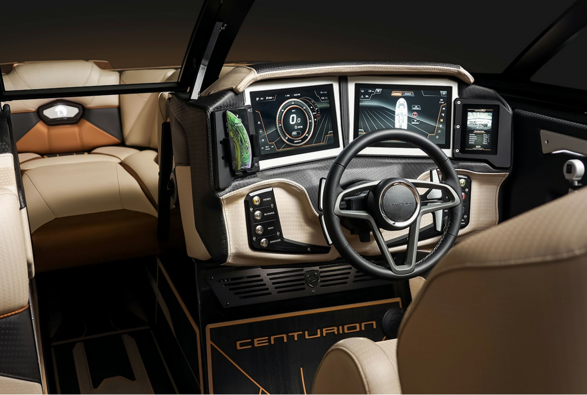
Centurion Ri 265