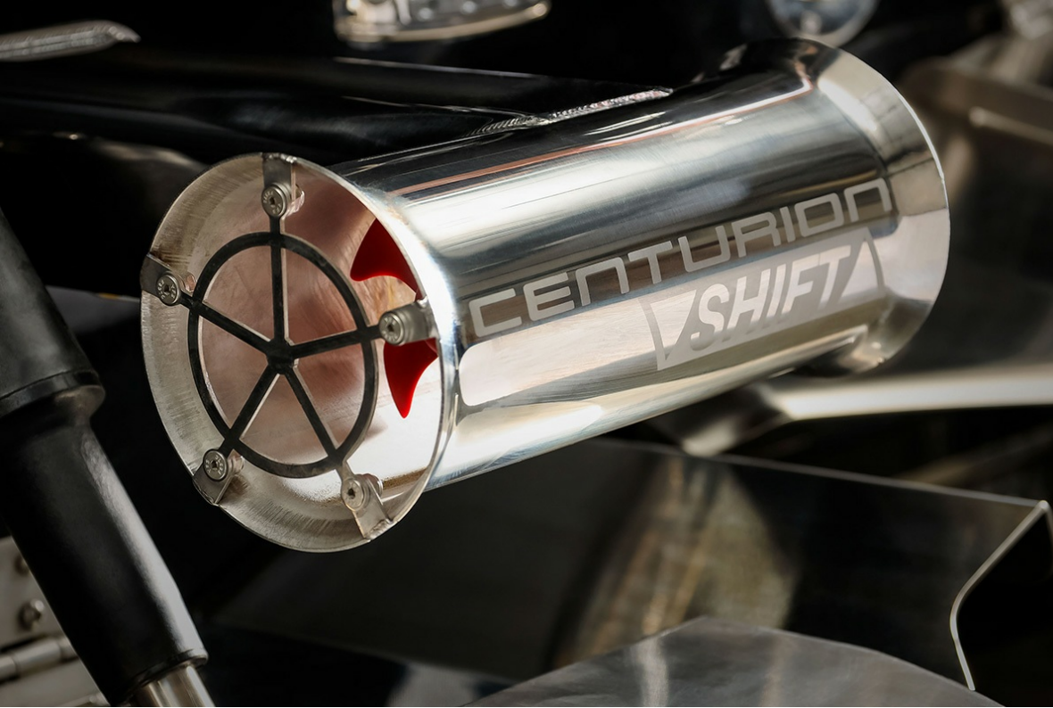
Centurion Ri 265