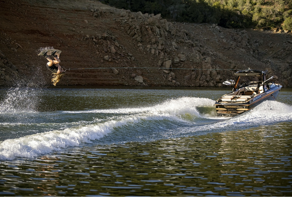
Centurion Ri 265