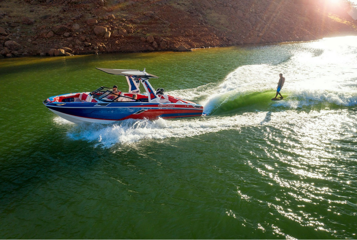
Centurion Ri 265