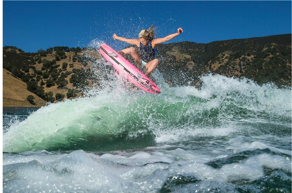
Centurion Ri 265