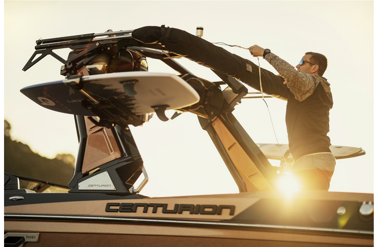
Centurion Ri 265